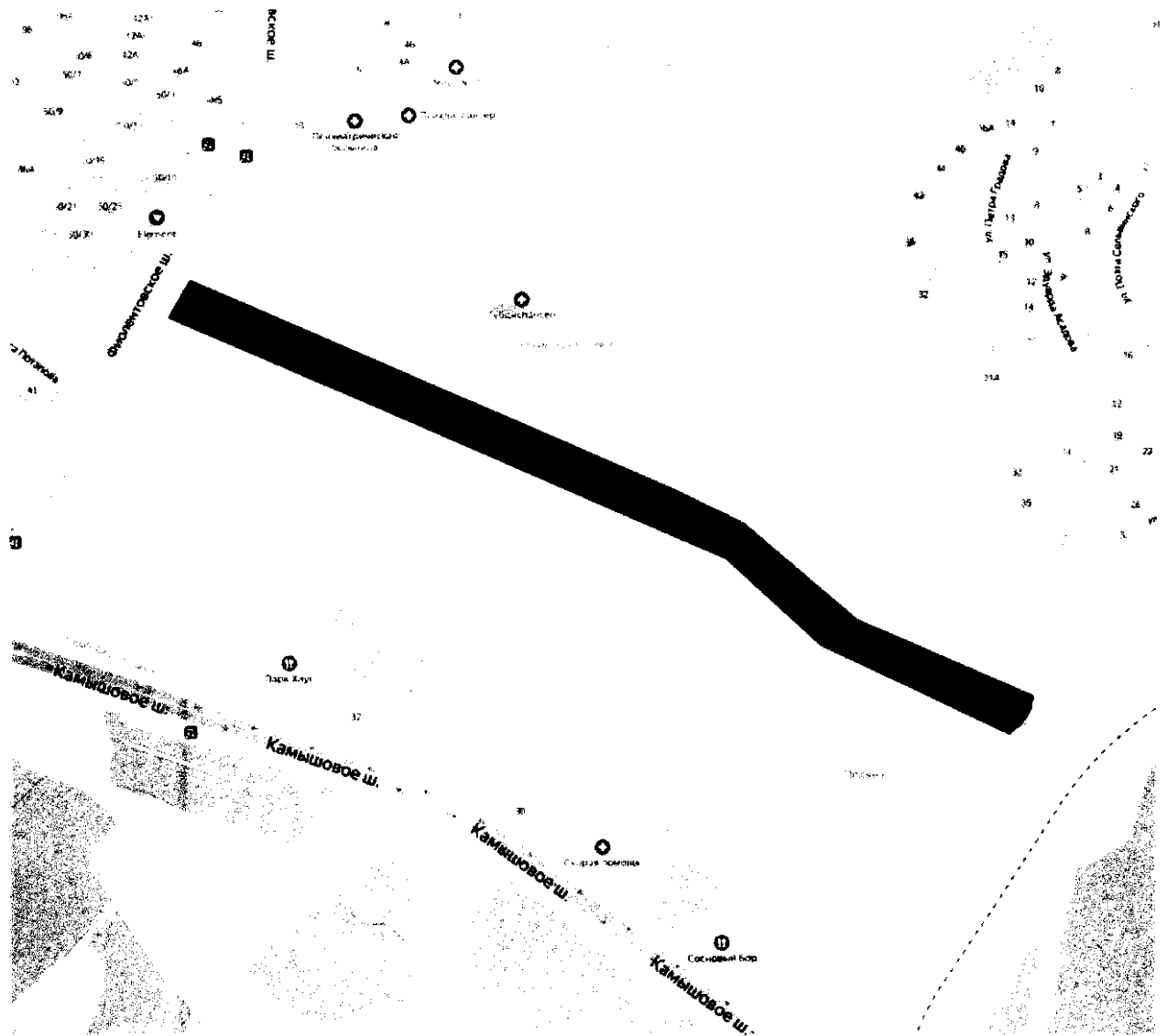
СХЕМА РАСПОЛОЖЕНИЯ улицы «Пелагеи Мазуровой»

Приложение № 1 к постановлению Правительства Севастополя от 29.12.2021 № 726-ПП