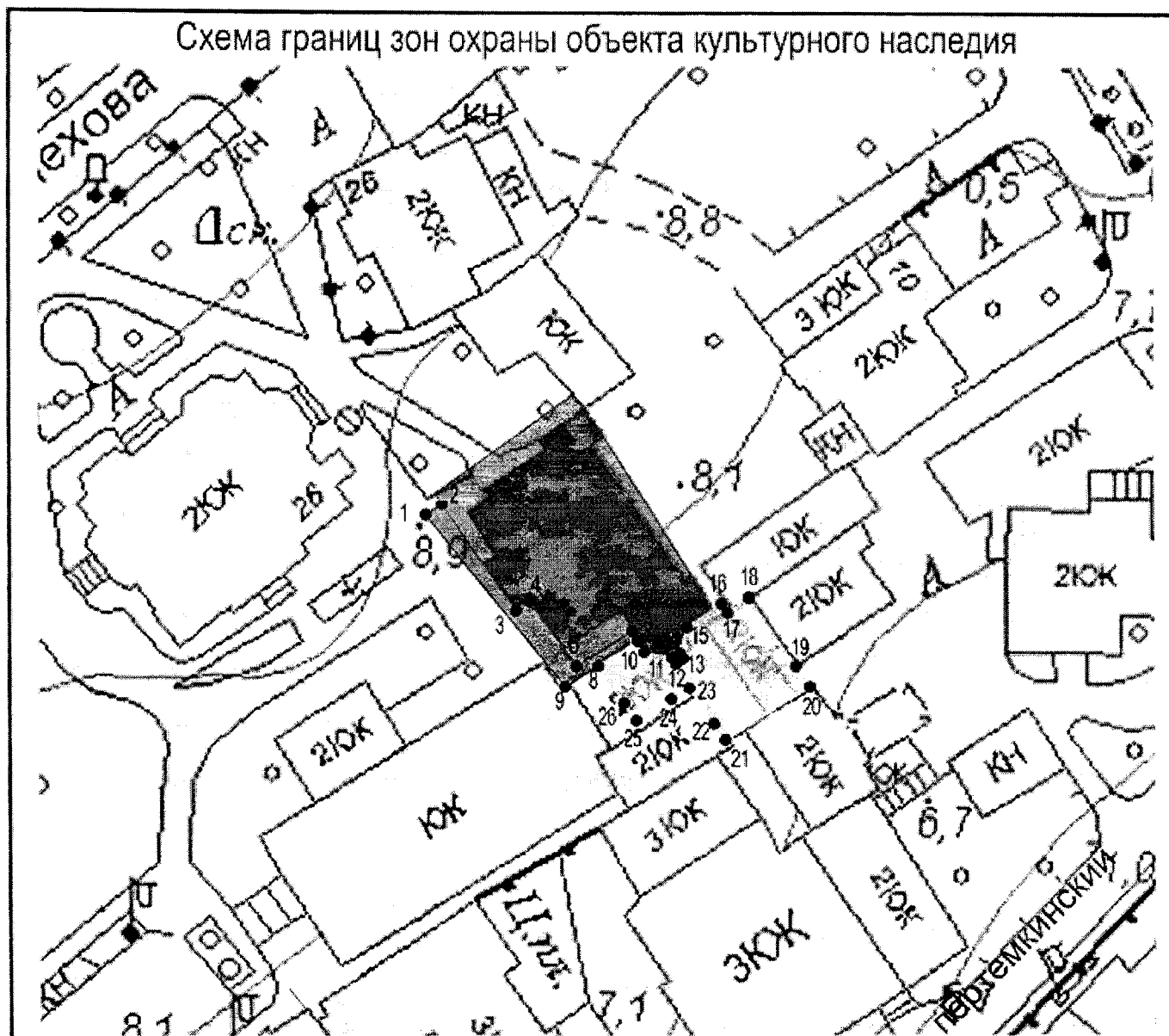
Схема границ зон охраны объекта культурного наследия