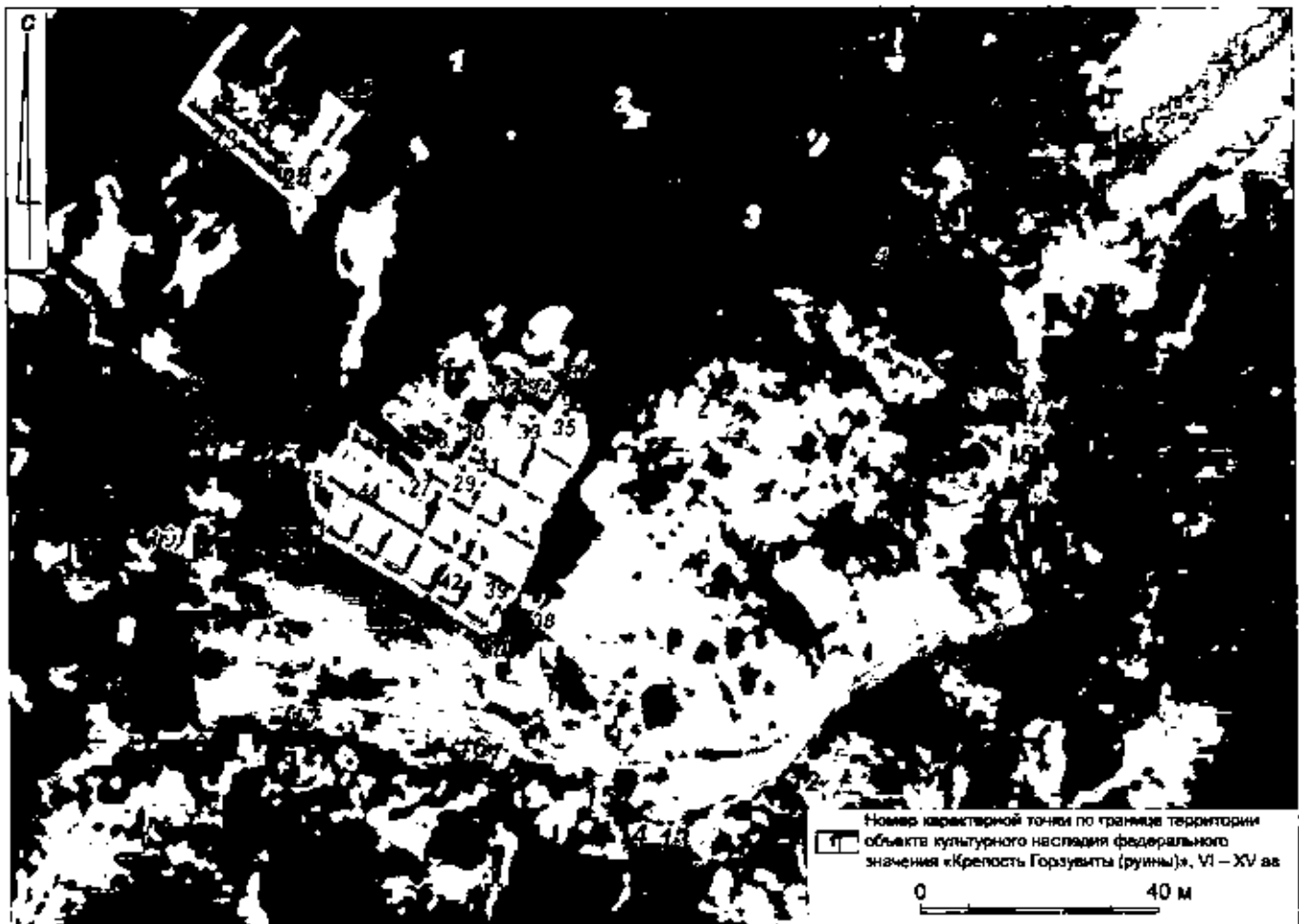
Схема границ территории объекта культурного наследия федерального значения «Крепость Горзувиты (руины)», расположенного по адресу: Республика Крым, городской округ Ялта, пгт Гурзуф