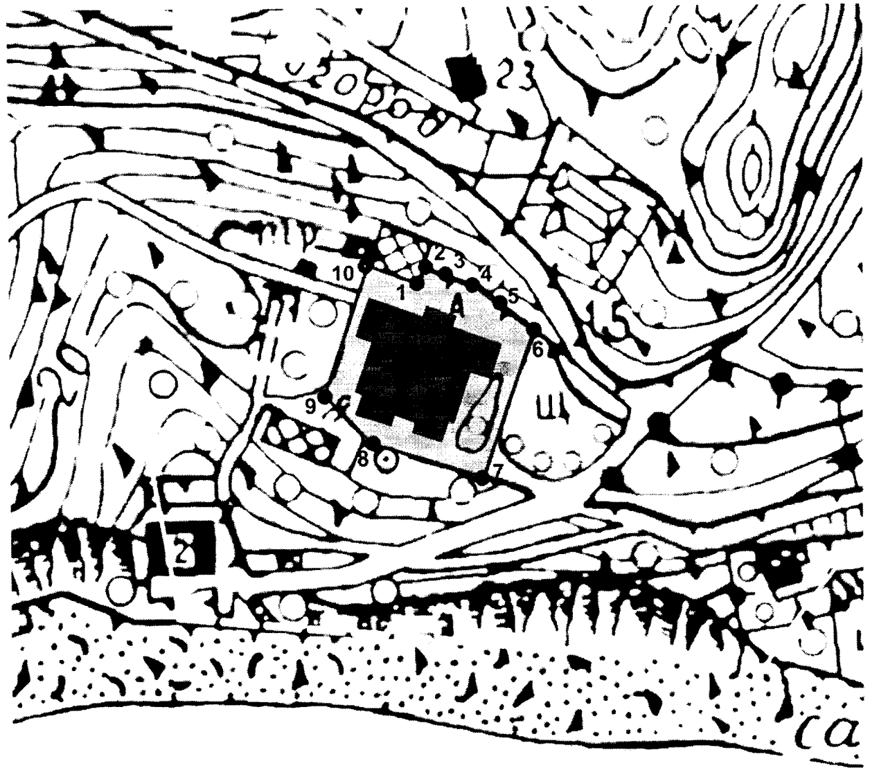
Схема границ территории