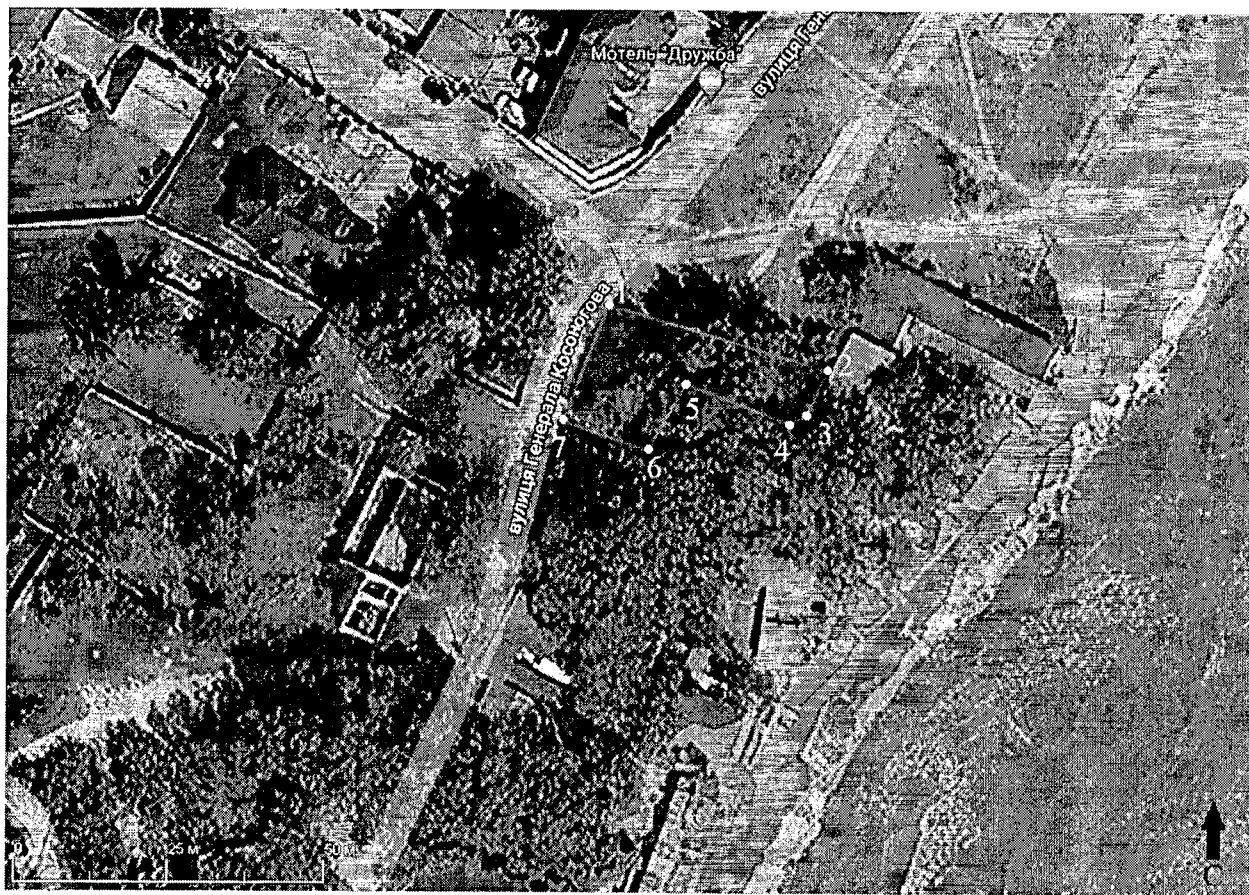
Схема границ территории