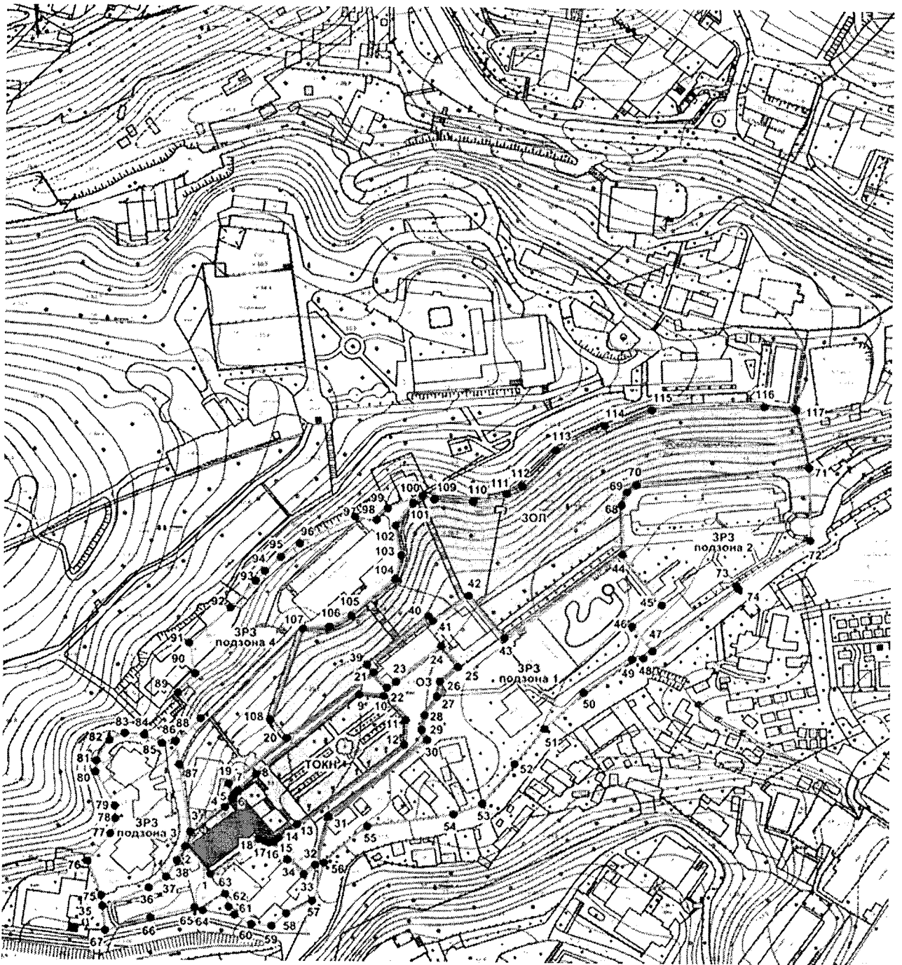
Схема зон охраны объекта культурного наследия