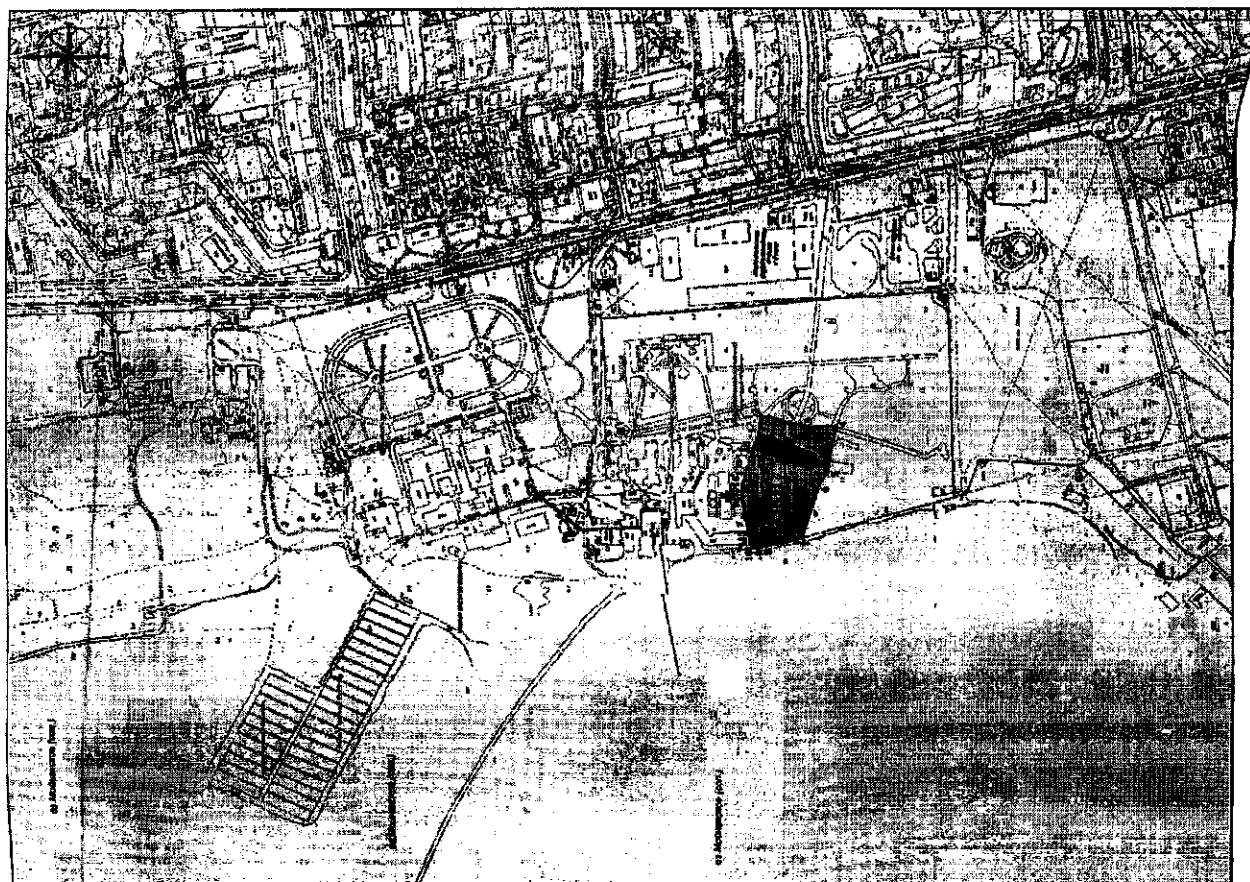
Схема границ территории объекта культурного наследия регионального значения «Гостиница Мойнакской грязелечебницы (архитектор А. О. Бернардашчи), 1894 год» расположенный по адресу: Республика Крым, г. Евпатория, ул. Франко, д. 30 лит. А, корпус 1