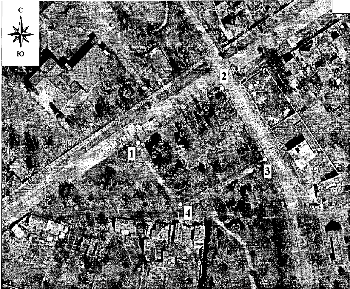
Схема границ территории