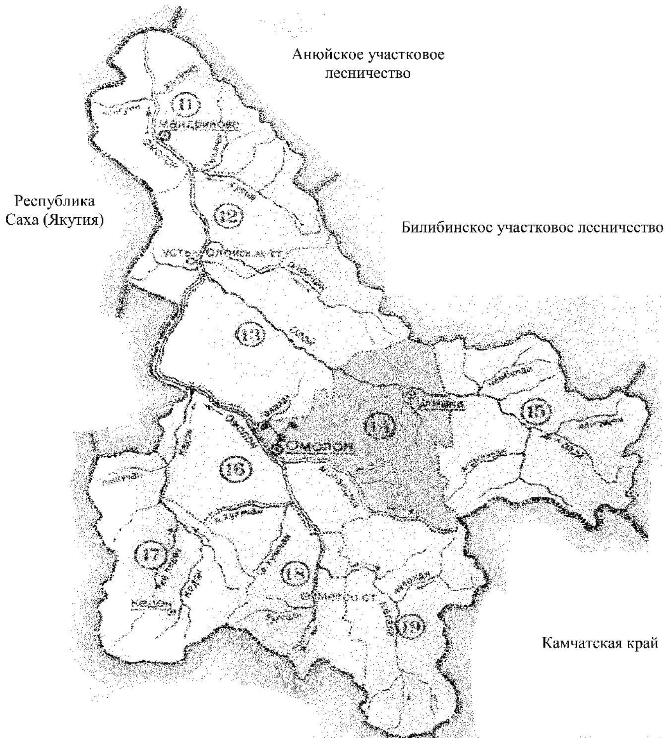
СХЕМА ТЕРРИТОРИИ Омолонского участкового лесничества Чукотского лесничества, на которой вводится особый противопожарный режим