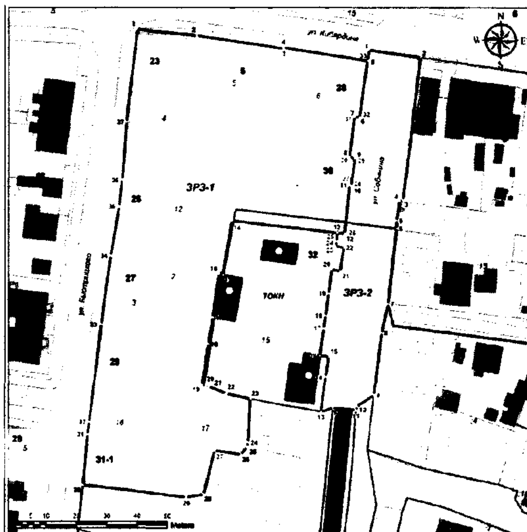
Схема границ зон охраны объекта культурного наследия регионального значения Ансамбль «Комплекс жилых и хозяйственных построек»