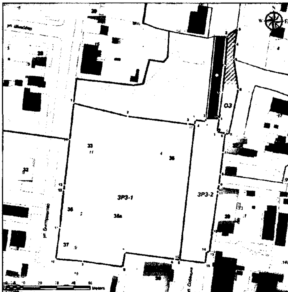
Схема границ зон охраны объекта культурного наследия регионального значения «Мост деревянный на ряхах через овраг Култычный»