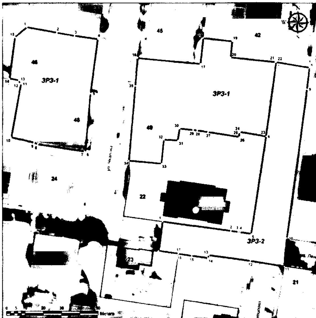
Схема границ охранной зоны и зоны регулирования застройки и хозяйственной деятельности объекта культурного наследия регионального значения «Церковно-приходская школа»