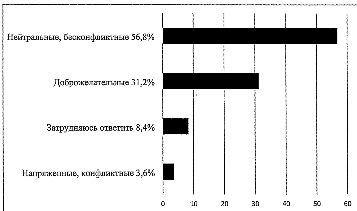
Рисунок 1. Результаты анализа ответов на вопрос «Каковы, на Ваш взгляд, отношения между людьми различных национальностей в населенном пункте, в котором Вы проживаете?»

Более половины опрошенных (56,8 процента) отмечает, что отношения между людьми различных национальностей нейтральные, бесконфликтные; 31,2 процента считает отношения доброжелательными; 3,6 процента считает отношения напряженными, конфликтными.