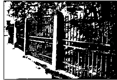
Северно-западный участок ограды.

ворота на двух гранитных столбах в виде стилизованных обелисков.