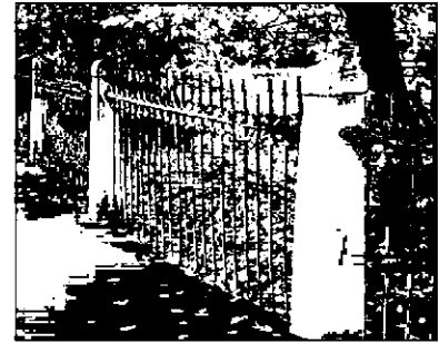
Фрагмент северного участка ограды.