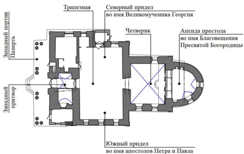
Схема второго яруса