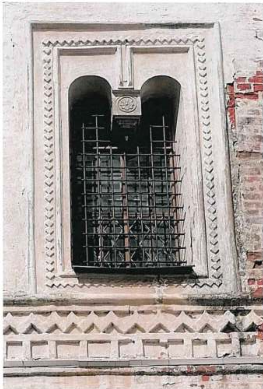
Вид 1. Окно второго этажа

- характер архитектурно-художественного оформления южного, восточного и западного фасадов (восстановленных при реставрации 1880-х гг.), в том числе широкие угловые лопатки и лопатка, делящая южный фасад на два неравных прясла, отделяющий цоколь, раскрепованный пояс-полка из ряда фигурного кирпича на южном и восточном фасадах, широкий междуэтажный фриз в виде поясов ширинок и бегунца, обрамленный поясами-полками из ряда фигурного кирпича; уступчатый венчающий карниз, завершенный поясом бегунца, прерванный лопатками и раскрепованным поясом-полкой из ряда фигурного кирпича; оформление оконных проемов второго этажа прямоугольными «рамочными» наличниками с двойными арками и подвесками, имитирующими белокаменные гирьки (восстановленные при реставрации 1880-х гг.) (вид 1);