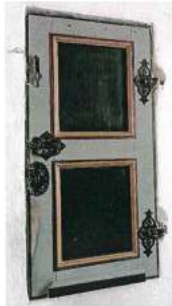
Вид 4. Дверь печуры

столярными заполнениями конца XIX в. с ковanej фурнитурой в древнерусской стилистике (вид 4);