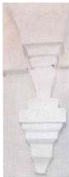
Вид 5. Консоль

- характер архитектурно-художественного оформления конца XIX в. интерьера Белой палаты, включая вытянутые декоративные профилированные консоли в завершении распалубок (вид 5); оформление дверных порталов поясом чередующихся прямоугольных выемок треугольного сечения; сохранившийся фрагмент мелкопрофилированного лепного убранства простенка северной угловой части западной стены; барельеф памятной доски с поясом растительного орнамента по периметру и два примыкающих к центральному столбу технических элемента-четырехгранника с усеченными углами и латунными дверцами;