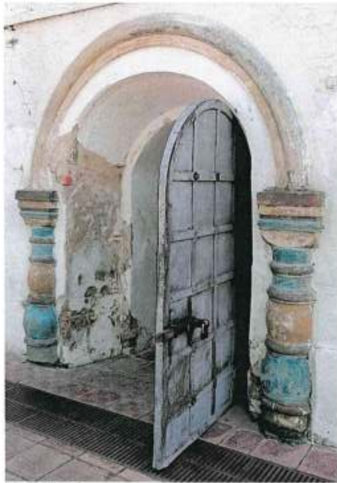
Вид 2. Портал входа на северном фасаде

- характер архитектурно-художественного оформления северного фасада (восстановленного при реставрации 1880-х гг.), в том числе пояс бегунца в подкарнизной части; оформление оконного проема прямоугольным «рамочным» наличником с двойной аркой и подвеской, имитирующей белокаменную гирьку; оформление портала входного проема профилированным архивольтом с наборными полуколоннами с дыньками и перехватами-полуваликами (вид 2); небольшая ниша с лучковой перемычкой справа от входного проема;