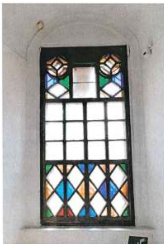
Вид 3. Окно второго этажа

- характер столярных заполнений окон второго этажа конца XIX в. с трехчастным делением по горизонтали и различным оформлением каждой из частей с использованием цветных стекол (вид 3);