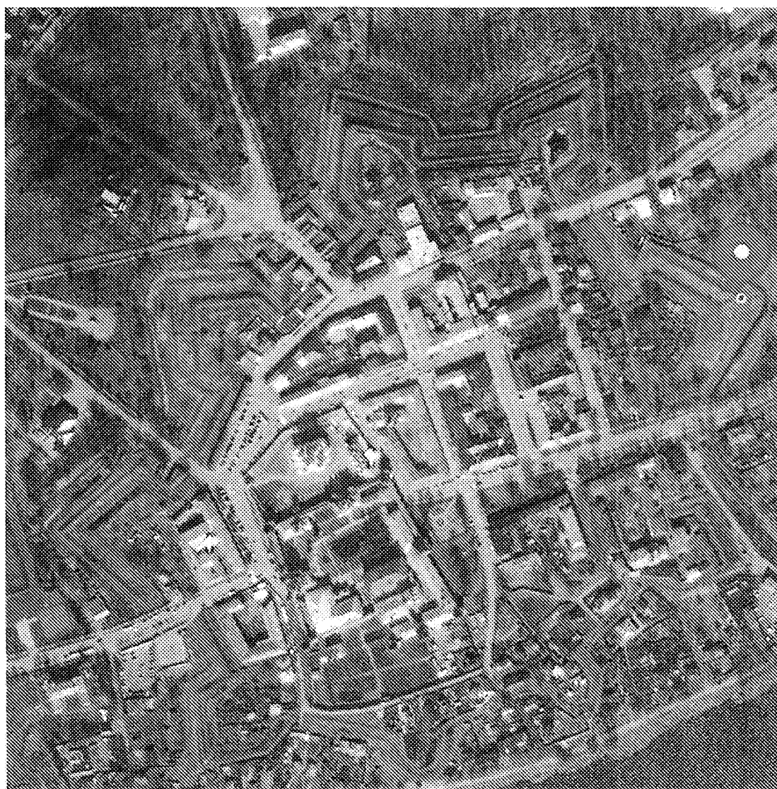
СХЕМА предмета охраны объекта культурного наследия федерального значения «Городские валы», XVII в. (Ярославская область, г. Ростов)