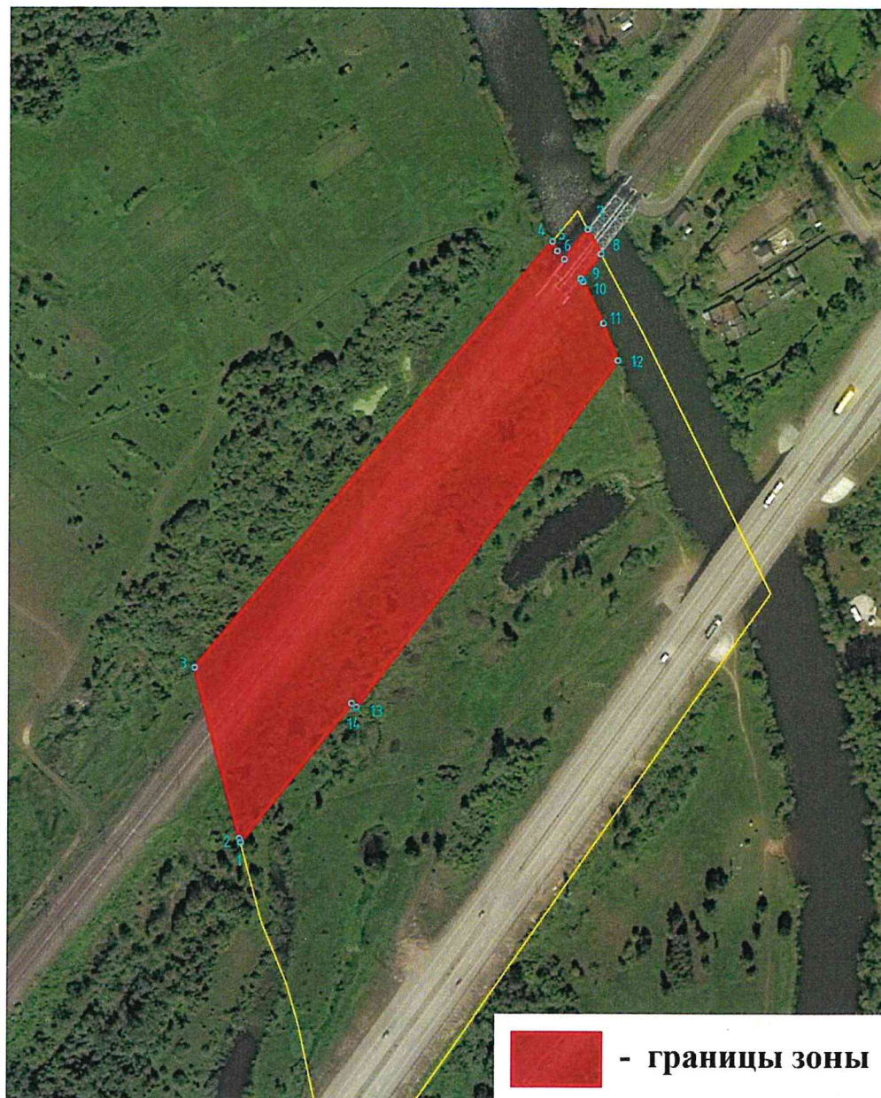
Схема границ зоны