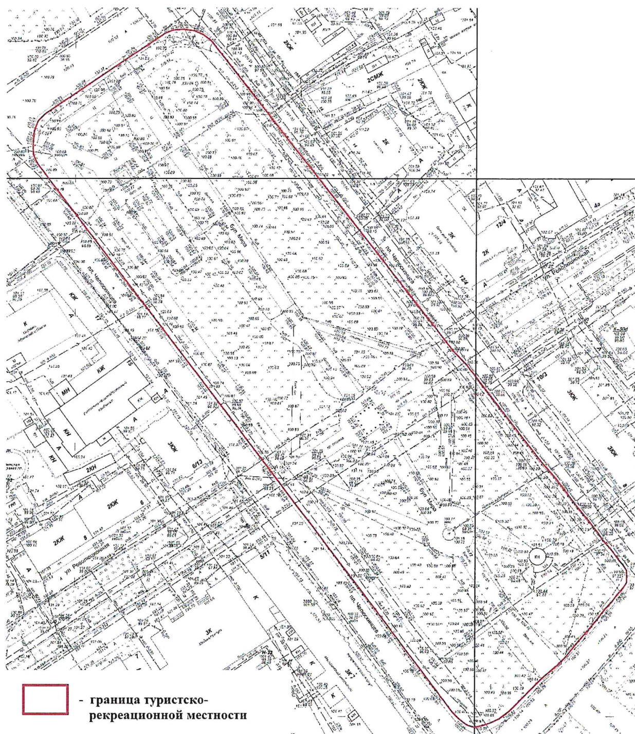
СХЕМА границ туристско-рекреационной местности «Демидовский сквер»