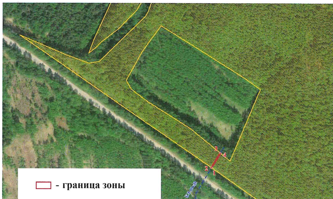
Схема границ зоны