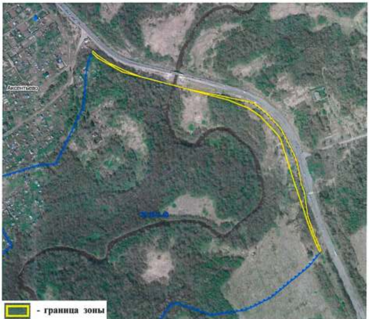
Схема границ зоны