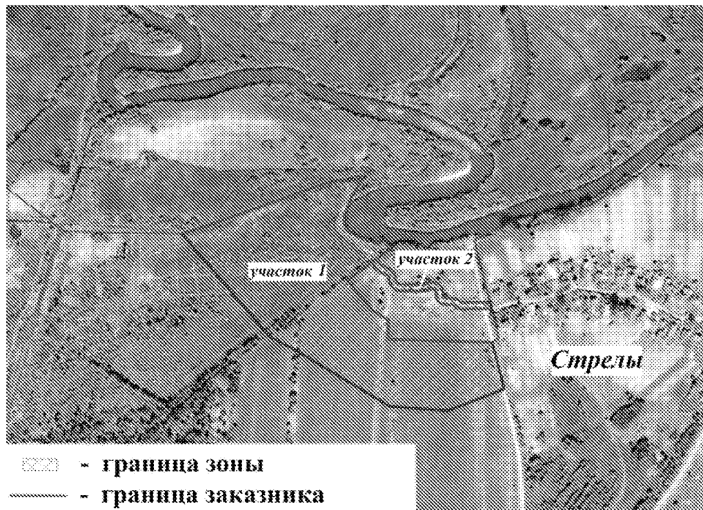
Схема границ зоны