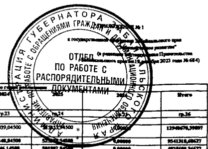
Основные мероприятия, мероприятия, показатели и объемы финансирования государственной программы Зabaykalsкого края "Экономическое развитие"