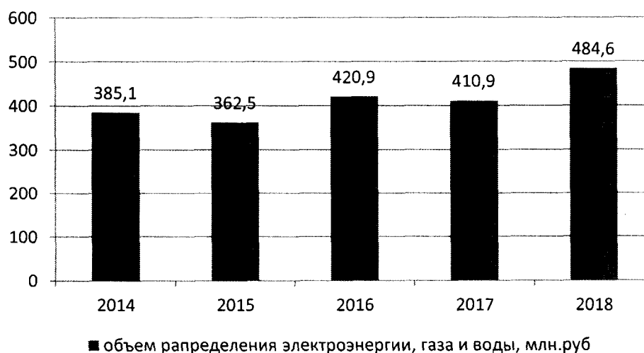
Диаграмма 1.3. Динамика распределения энергии, газа и воды (млн. рублей/год)

Протяженность электрических сетей напряженностью 110 кВ по округу составляет 438 км. Суммарная установленная мощность трансформаторов разных классов напряжения в 2018 году составила 273,6 мВА, в 2017 году - 274,3 мВА, в 2016 году - 274,7 мВА. Износ основных фондов электросетевого хозяйства в 2018 году в среднем составил 46 %, в том числе износ по магистральным сетям - 40 %, по распределительным сетям – 51 %.