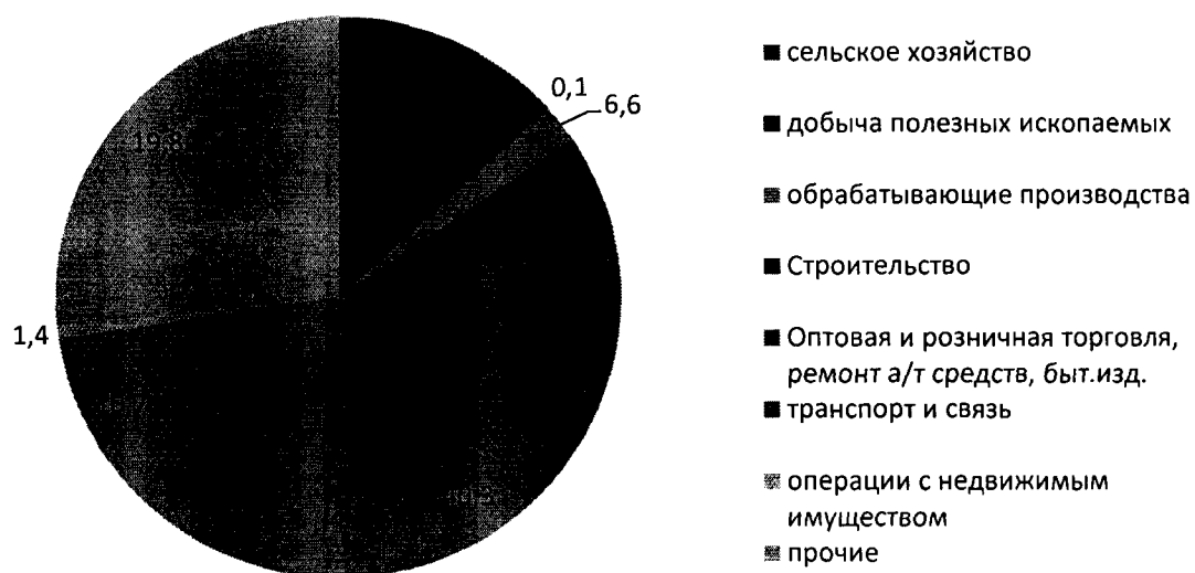
Диаграмма 1.4. Структура малого и среднего предпринимательства по видам экономической деятельности в процентах к итогу за 2018 год

Бизнес в сфере туризма характеризуется стабильной положительной динамикой, выражающейся в увеличении туристического потока на территорию округа с 27 тыс. в 2007 году до 34 тыс. человек в год в 2018 году, увеличении различных видов услуг, ростом объема платных услуг в 2 раза, ростом занятых в туристической отрасли до 150 человек в год.