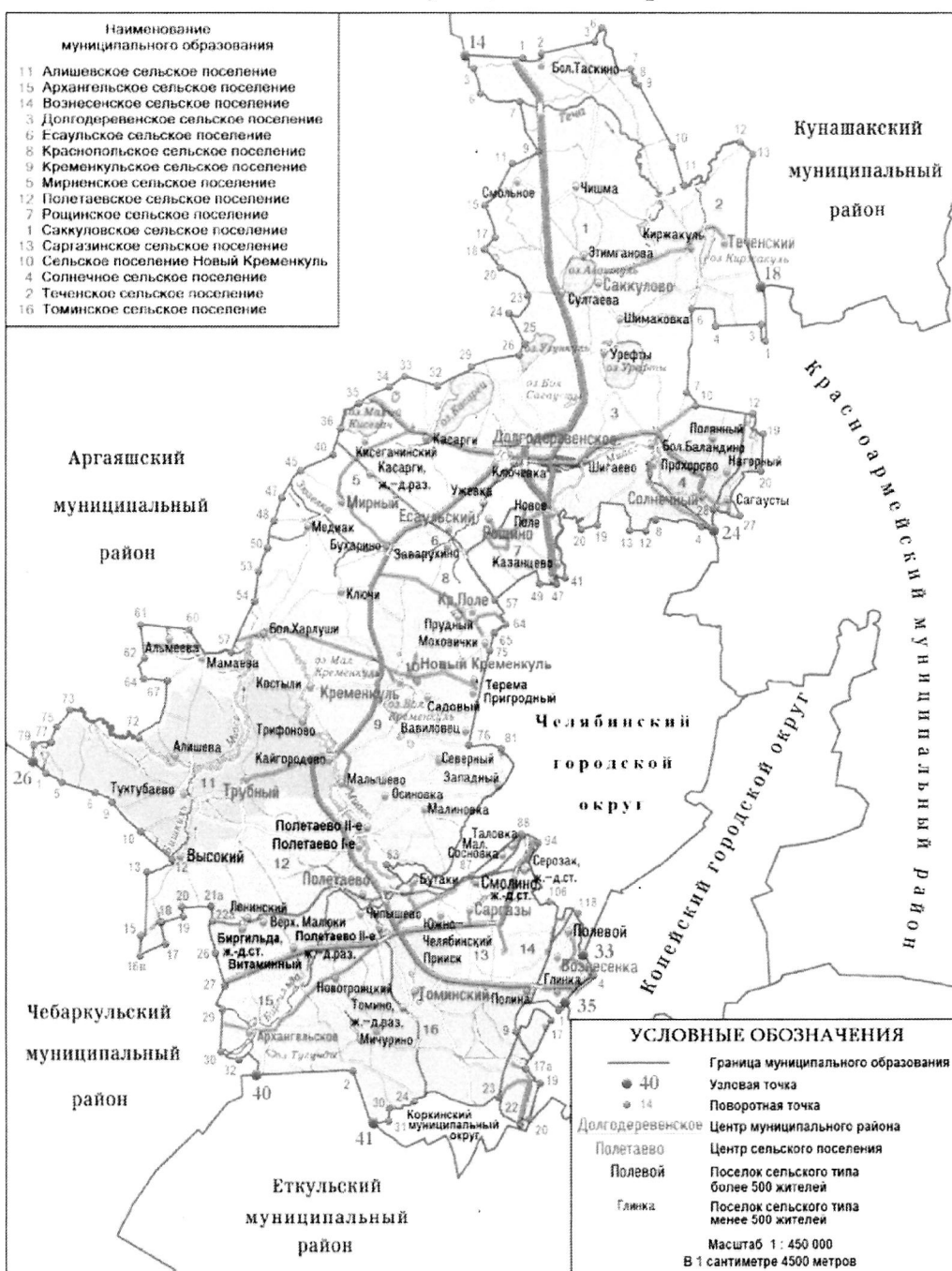
СХЕМА ГРАНИЦ Сосновского муниципального района

«Приложение 2 к Закону Челябинской области «О статусе и границах Сосновского муниципального района и сельских поселений в его составе»