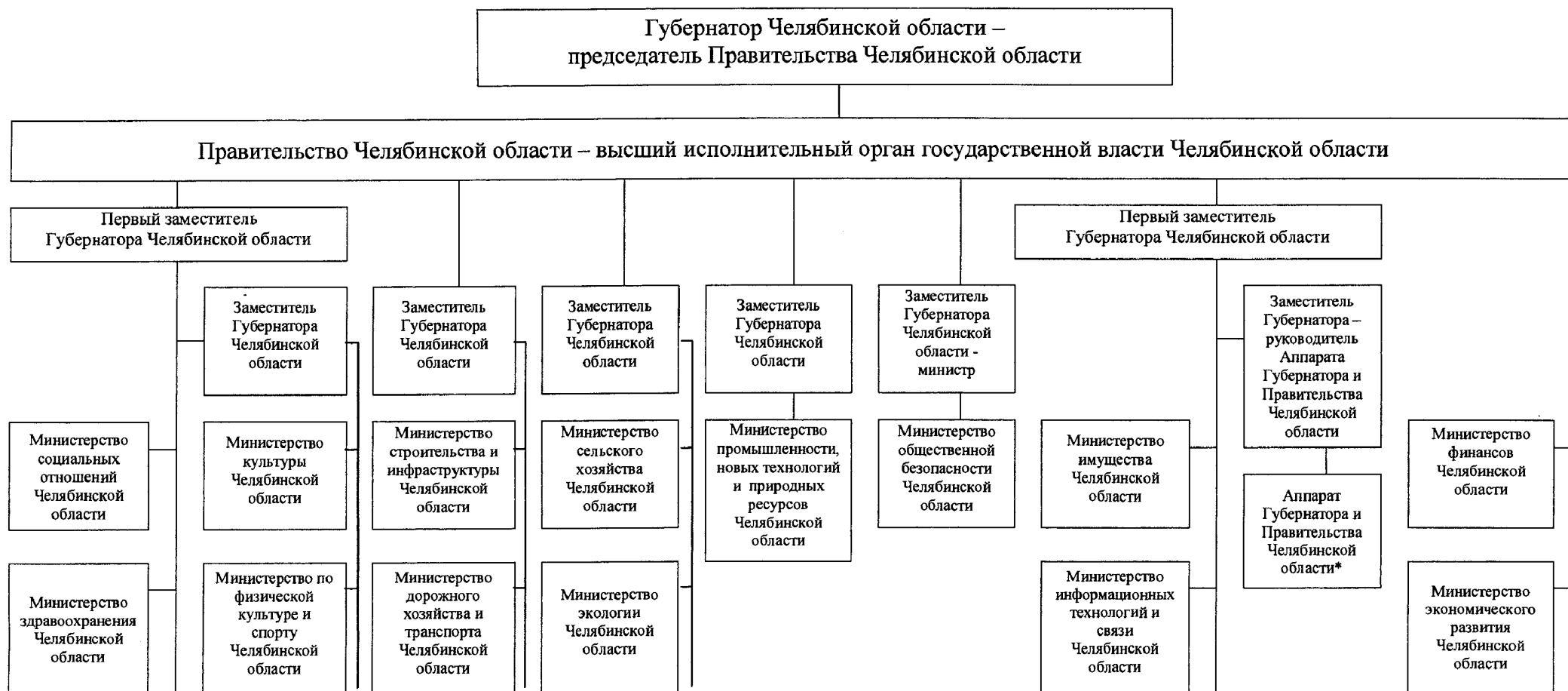
Схема исполнительной власти Челябинской области