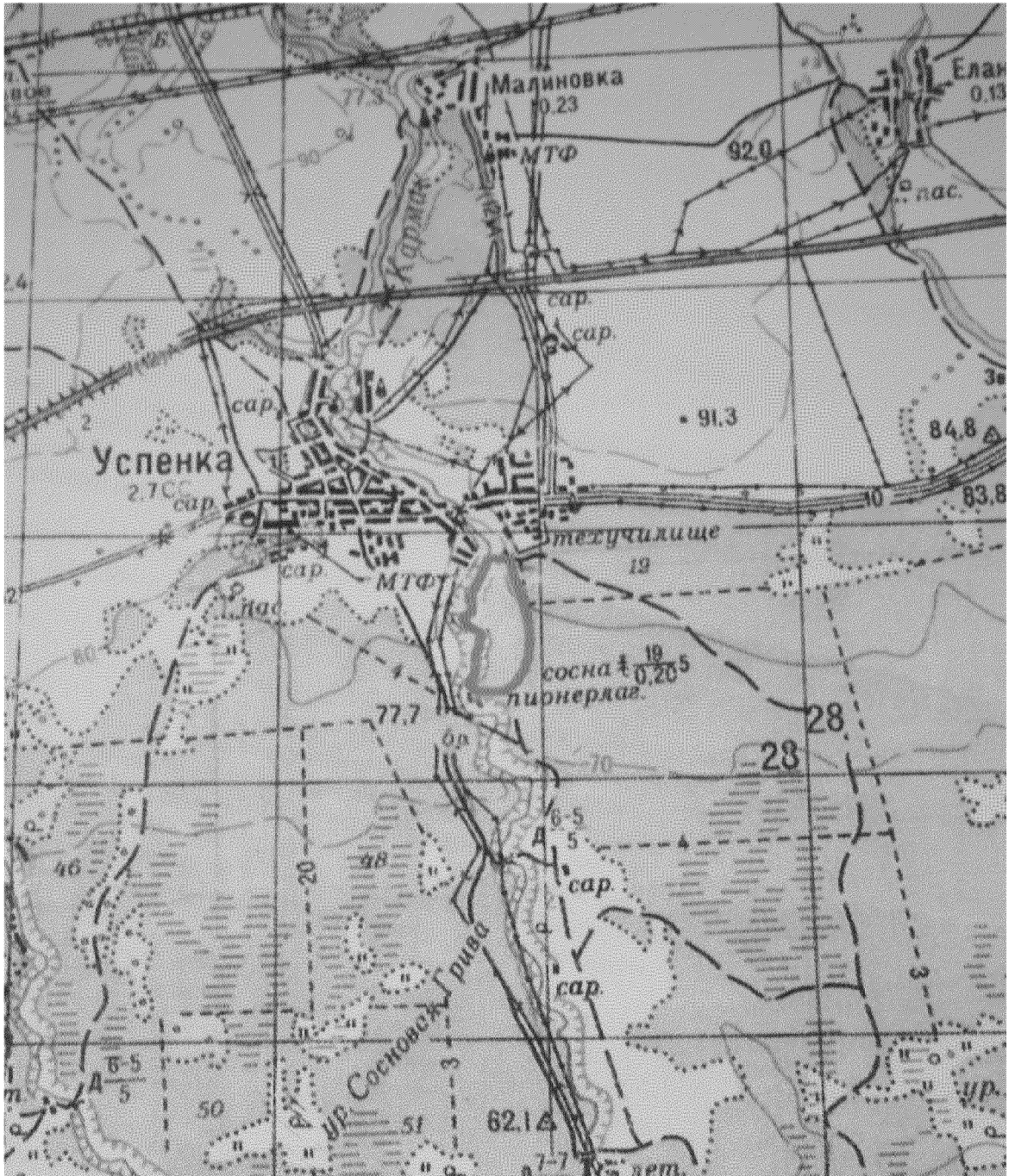
ОБЗОРНАЯ КАРТА ПАМЯТНИКА ПРИРОДЫ РЕГИОНАЛЬНОГО ЗНАЧЕНИЯ «УСПЕНСКИЙ-2» М 1:50 000