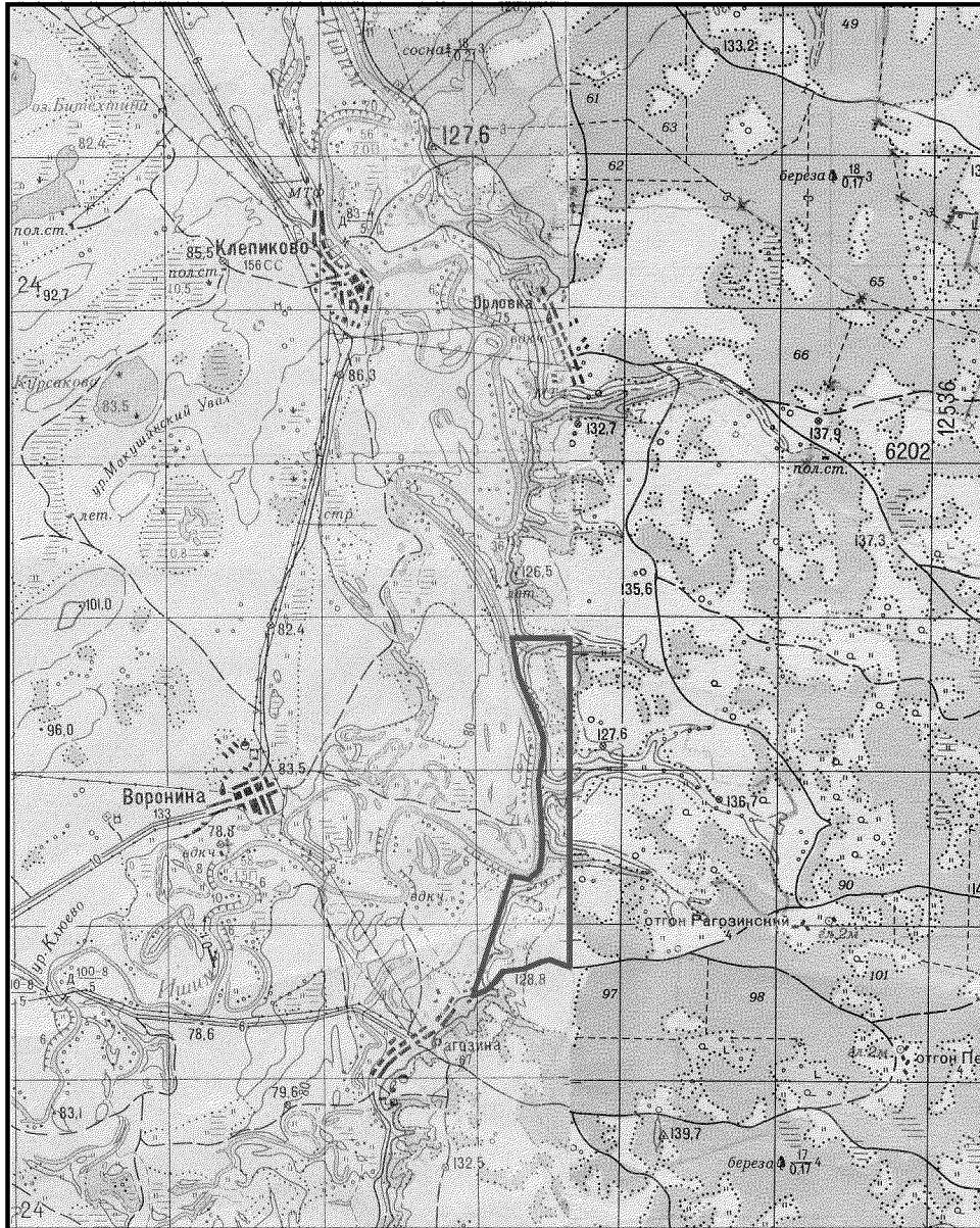
ОБЗОРНАЯ КАРТА ПАМЯТНИКА ПРИРОДЫ «ИШИМСКИЕ БУГРЫ – КУЧУМОВА ГОРА» М 1:100 000