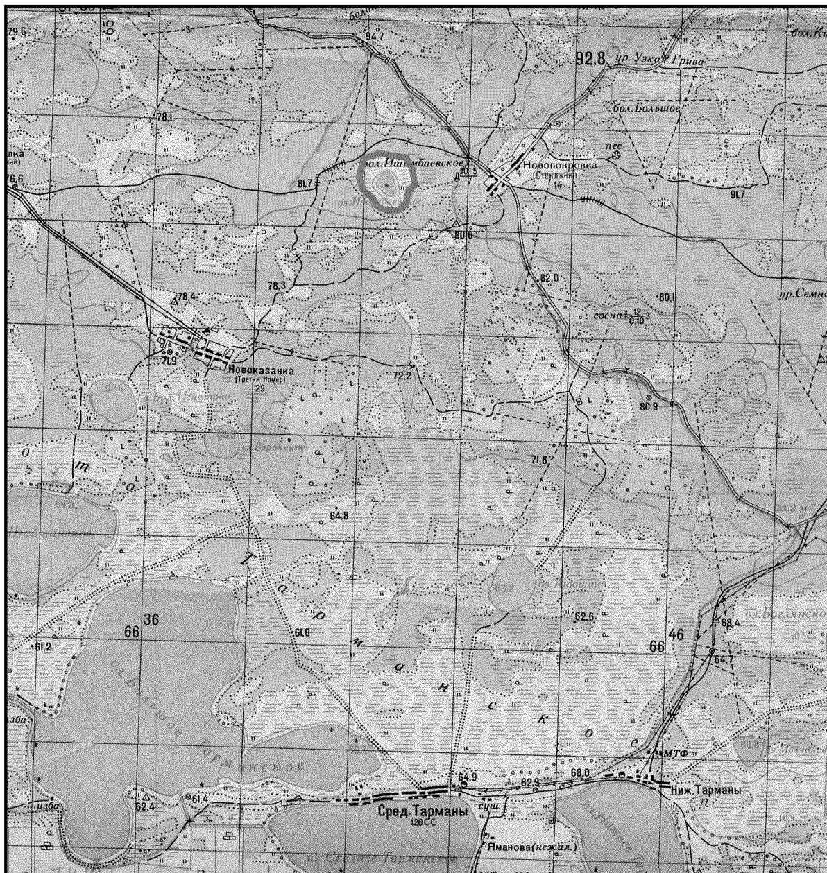
ОБЗОРНАЯ КАРТА ПАМЯТНИКА ПРИРОДЫ РЕГИОНАЛЬНОГО ЗНАЧЕНИЯ «ОЗЕРНО-БОЛОТНЫЙ КОМПЛЕКС ИШИМБАЙ» М 1:100 000