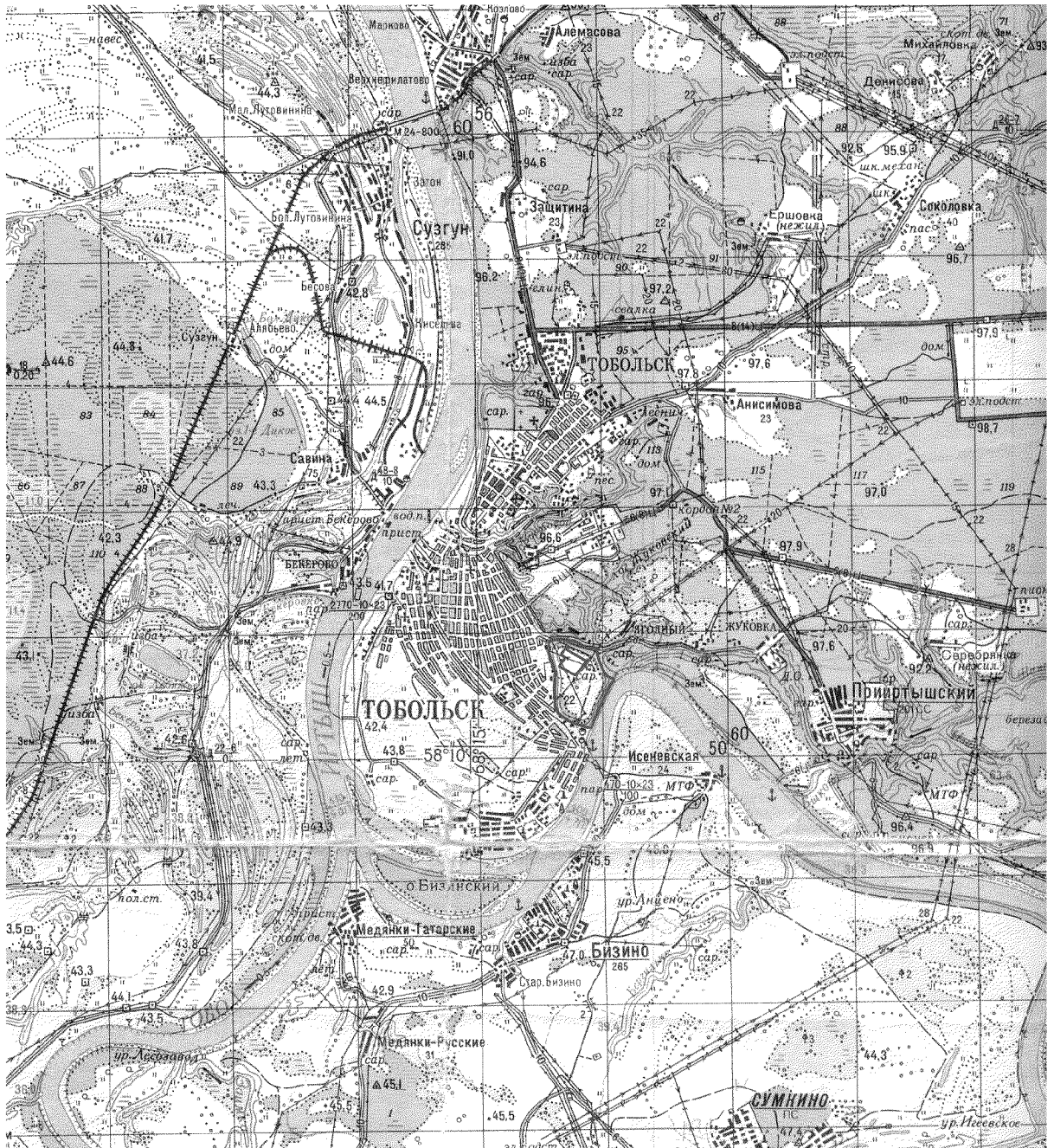
Обзорная карта памятника природы регионального значения "Киселевская гора с Чувашским мысом" М 1:100 000