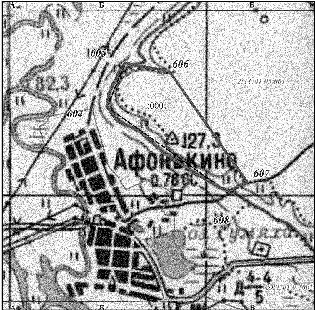
КАРТА-СХЕМА ПАМЯТНИКА ПРИРОДЫ «ИШИМСКИЕ БУГРЫ – АФОНЬКИНСКИЙ» М 1:25 000