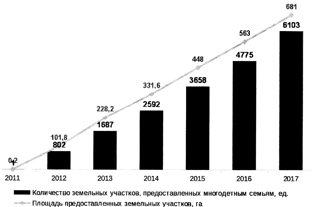
Рисунок № 1 — Предоставление земельных участков многодетным семьям в Тюменской области (ежегодно, нарастающим итогом)

За период действия Закона № 64 по состоянию на 01.01.2018 в Тюменской области многодетным семьям предоставлено 6 103 земельных участка общей площадью 681 га.