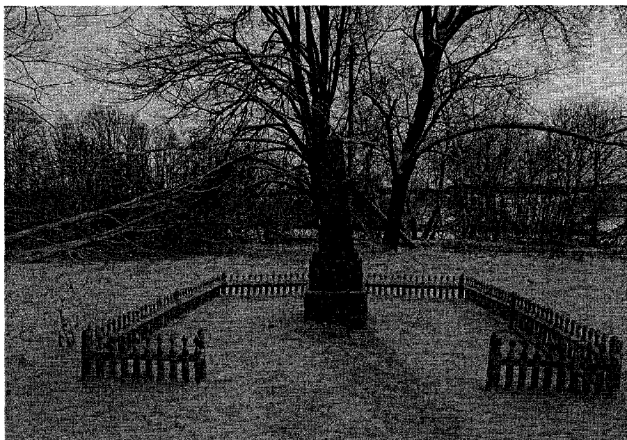
Фото 1. Главный фасад памятника.

Фотографическое (иное графическое) изображение объекта культурного наследия (на момент утверждения охранного обязательства) объект культурного наследия федерального значения «Памятник Даргомыжскому Александру Сергеевичу, установленный на родине композитора», Тульская область, Арсеньевский район, деревня Дарогомыжка