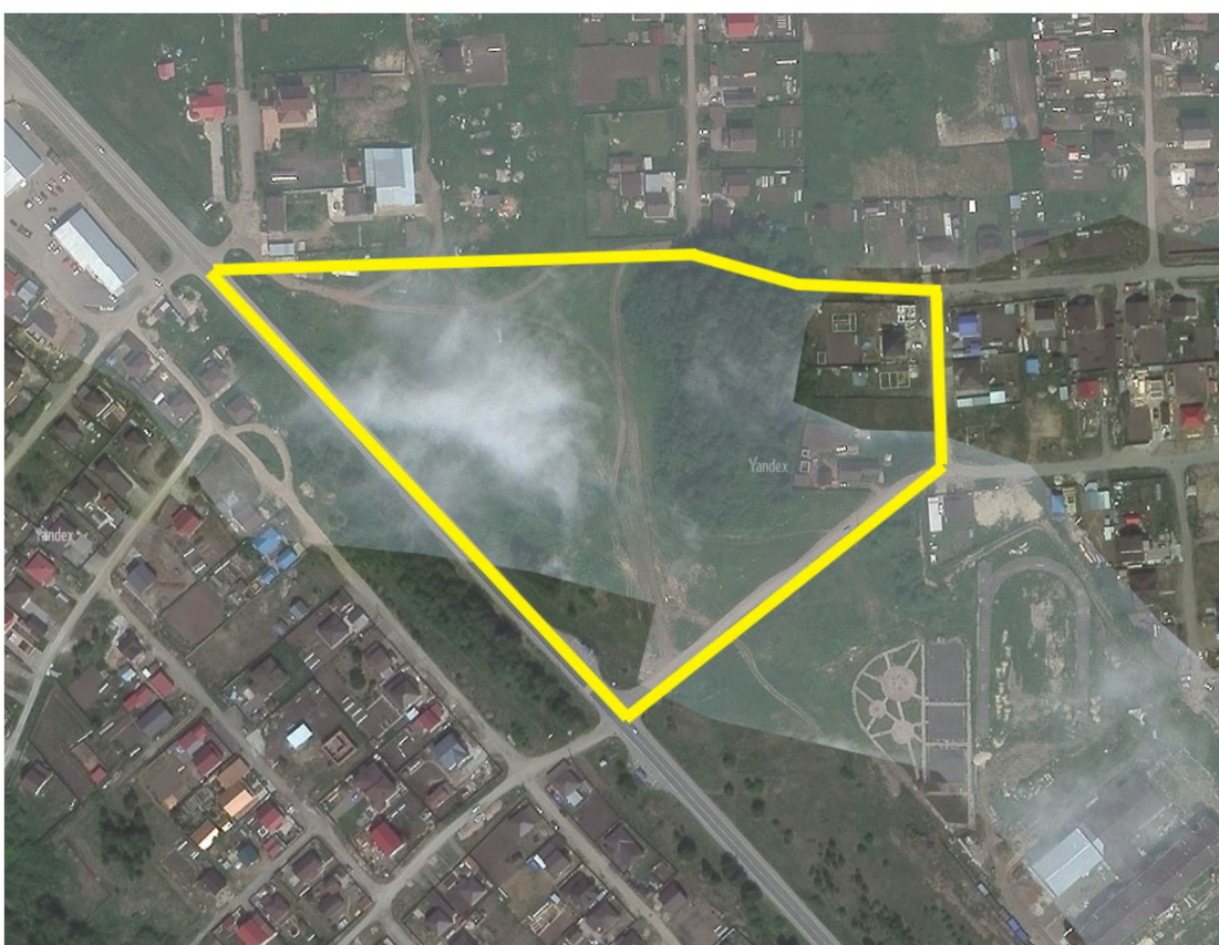
Схема границ территории, в отношении которой предусмотрена отмена документации по планировке территории населенного пункта с. Корнилово (проект планировки территории и I этап проекта межевания территории), утвержденной постановлением Администрации Корниловского сельского поселения от 21.01.2019 № 12 в части