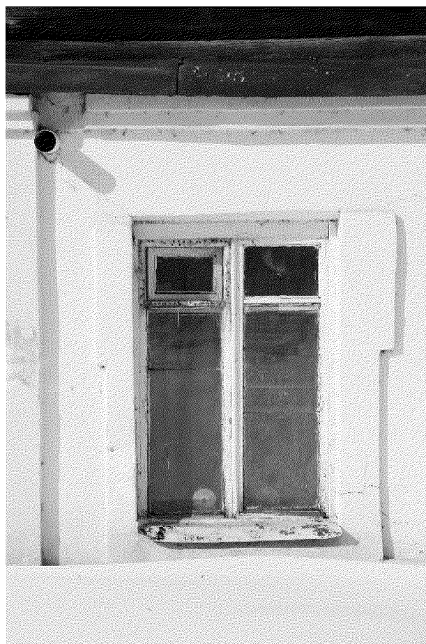
Видовая точка № 7. Окно 1-го этажа восточного фасада