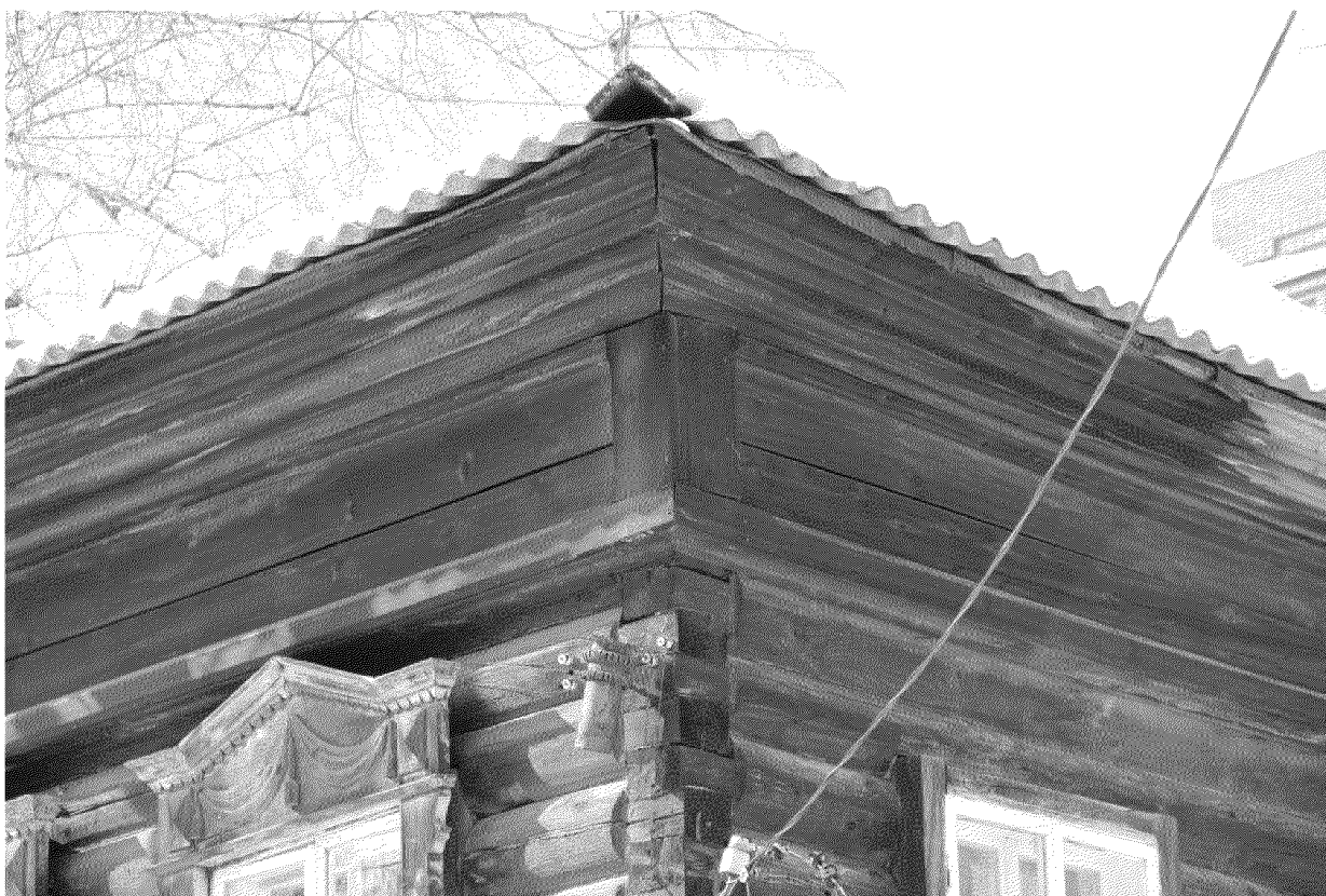
Видовая точка № 5. Фрагмент профильного карниза с фризом