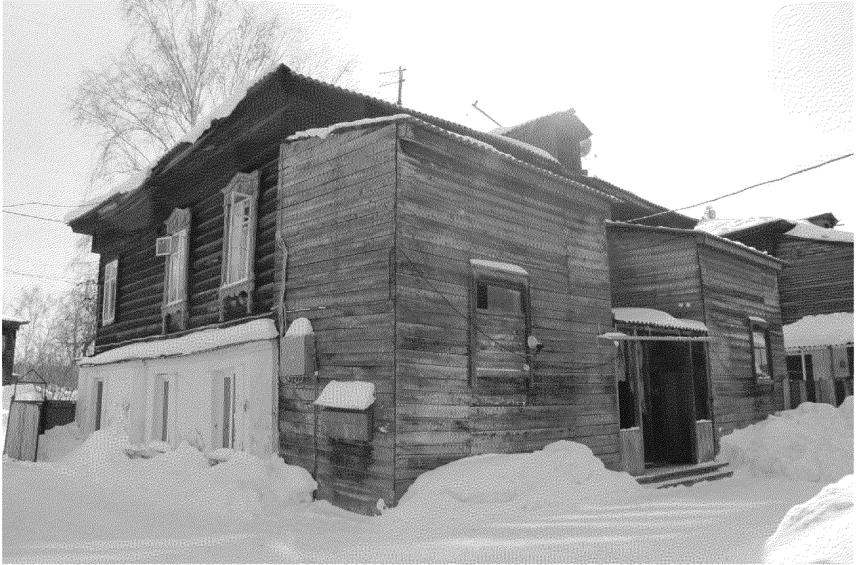
Видовая точка № 8.

Общий вид здания с северо-западной стороны (с территории двора)