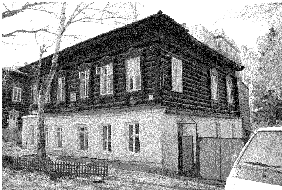
Видовая точка № 4. Общий вид здания с северо-восточной стороны (Рыжикова А.Ю., 2017 г.)