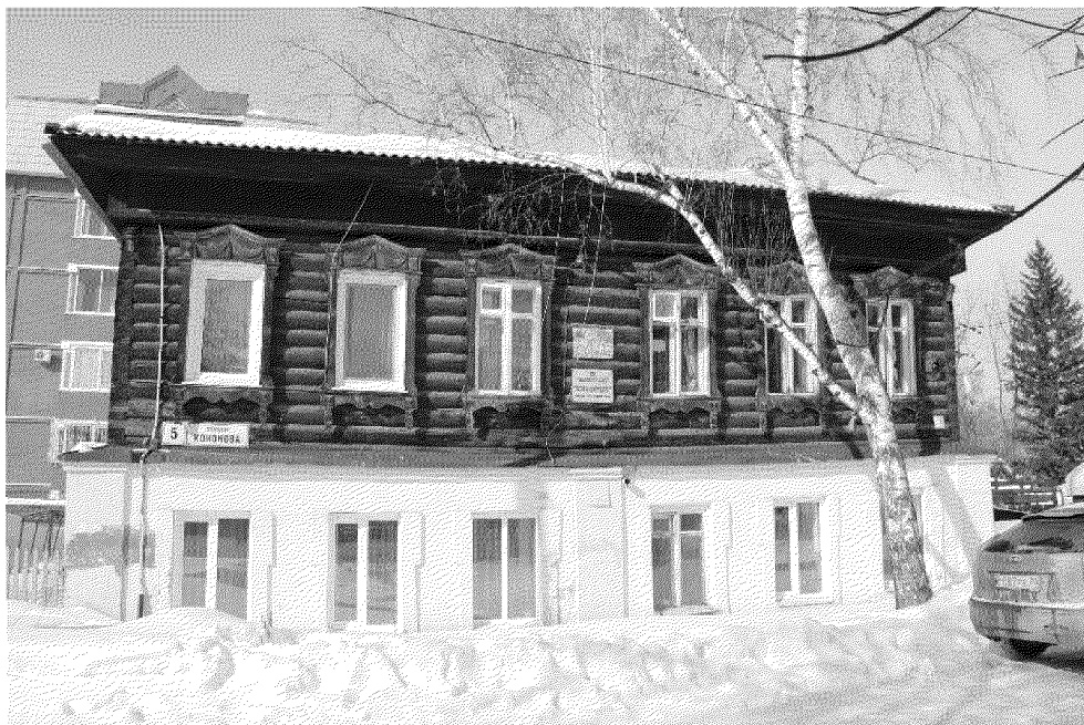
Видовая точка № 2. Главный (восточный) фасад здания