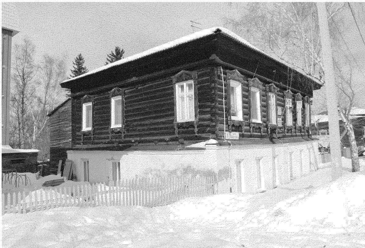
Видовая точка № 3. Общий вид здания с юго-восточной стороны