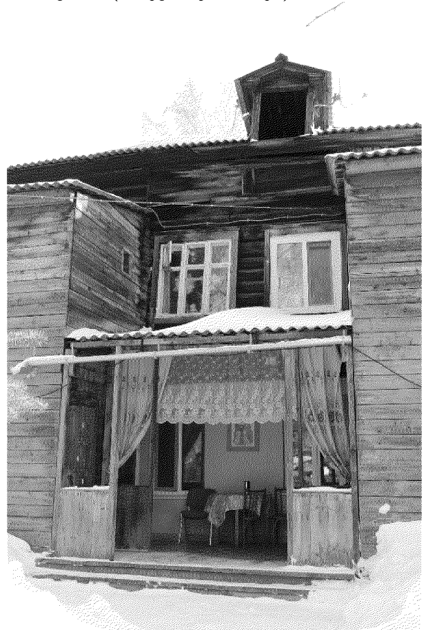
Видовая точка № 10. Фрагмент дворового (западного) фасада