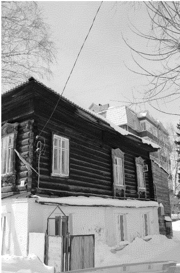
Видовая точка № 9. Северный фасад здания

Общий вид здания с северо-западной стороны (с территории двора)