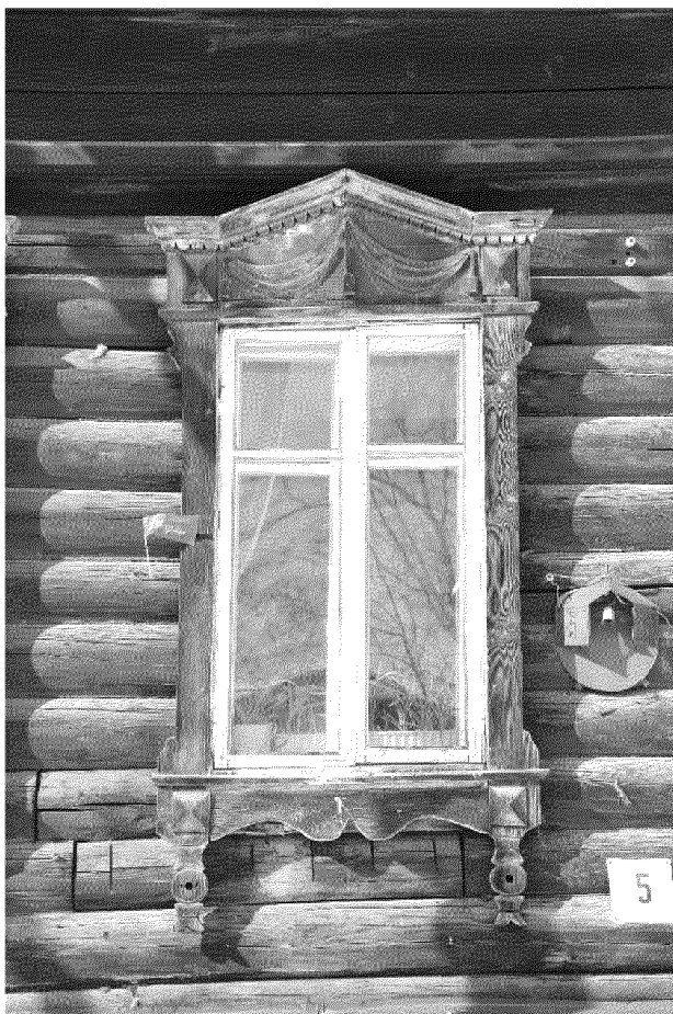
Видовая точка № 6. Окно 2-го этажа восточного фасада