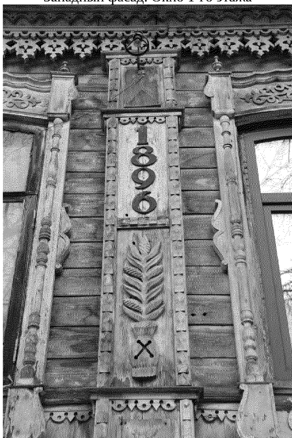
Видовая точка № 10 Южный фасад. Центральная лопатка. Элементы декора лопаток – накладная объемная, ажурная, пропиленная резьба