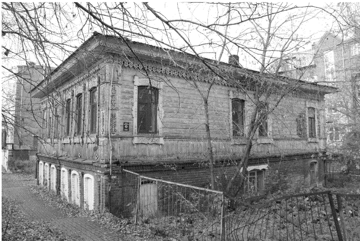
Видовая точка № 3.

Восточный фасад здания. В центре по 1-му этажу, трехчастное окно с фигурной перемычкой (автор снимка: Яблонская М.А., дата съемки: 17.10.2017 г.)