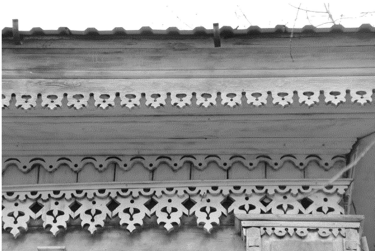
Видовая точка № 4.

Восточный фасад здания. В центре по 1-му этажу, трехчастное окно с фигурной перемычкой (дата съемки: 17.10.2017 г.)