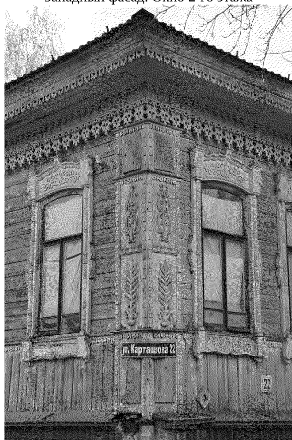
Видовая точка № 11 Южный фасад. Боковые лопатки. Элементы декора лопаток – накладная объемная, ажурная, пропиленная резьба