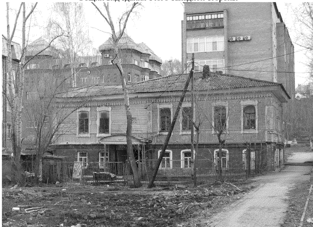
Видовая точка № 2.

Западный фасад здания (Яблонская М.А., 17.10.2017 г.)