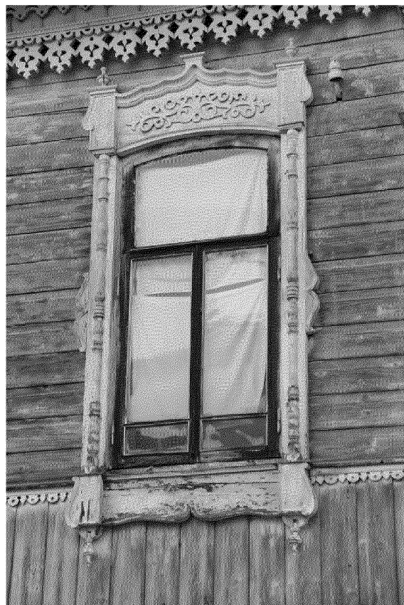
Видовая точка № 9 Западный фасад. Окно 2-го этажа