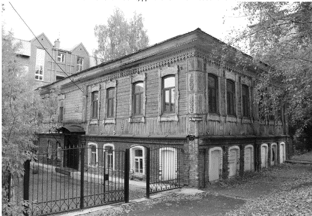
Видовая точка № 1.

Рачковская О.Н., дата съемки: 11.09.2019 г.