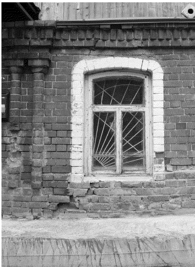
Видовая точка № 8 Западный фасад. Окно 1-го этажа