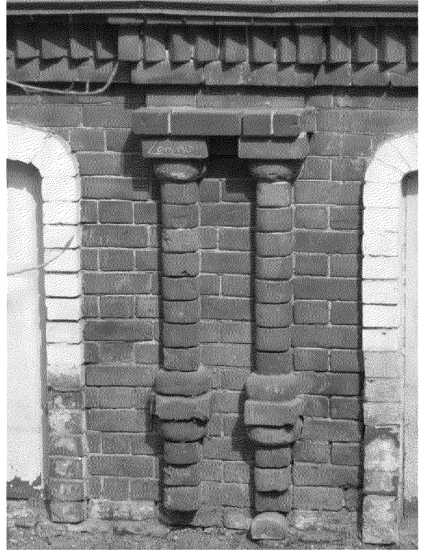
Видовая точка № 13 Фрагмент южного фасада. Декоративные элементы кирпичной части здания в виде парных фигурных полуколоннок