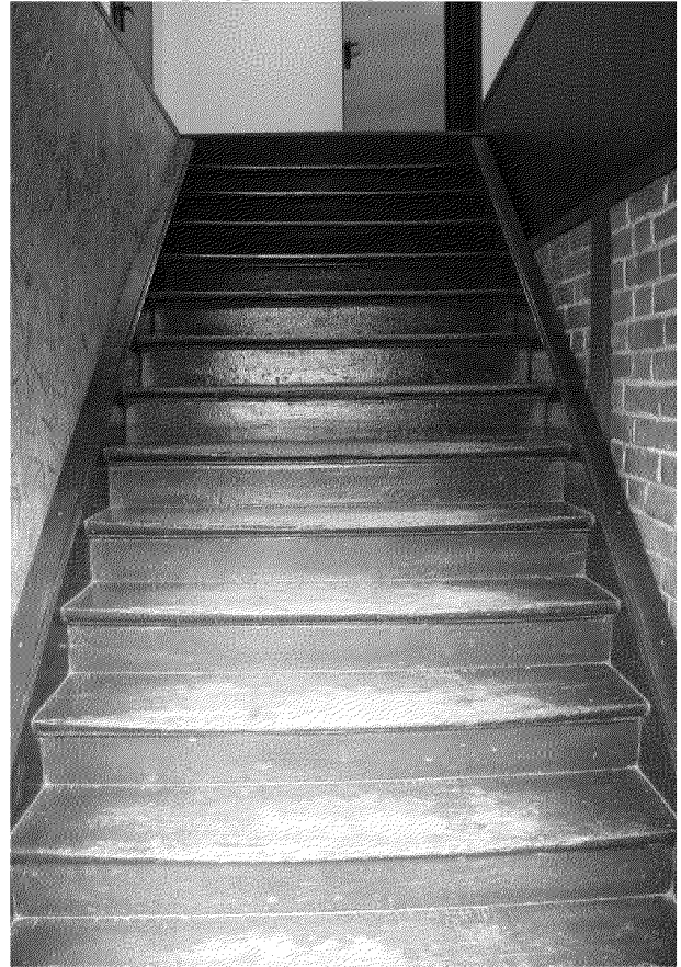
Видовая точка № 15 Деревянная одномаршевая лестница на 2-й этаж