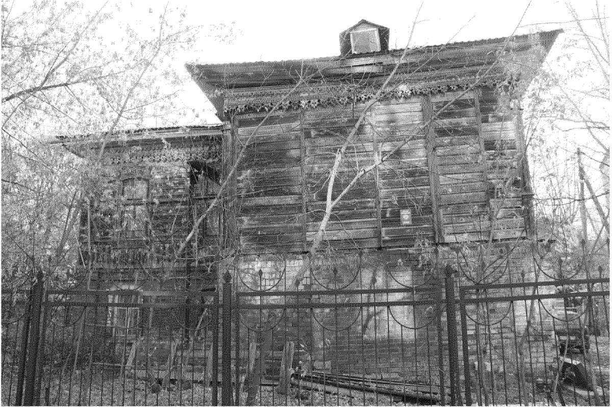
Видовая точка № 5. Северный (дворовый) фасад здания