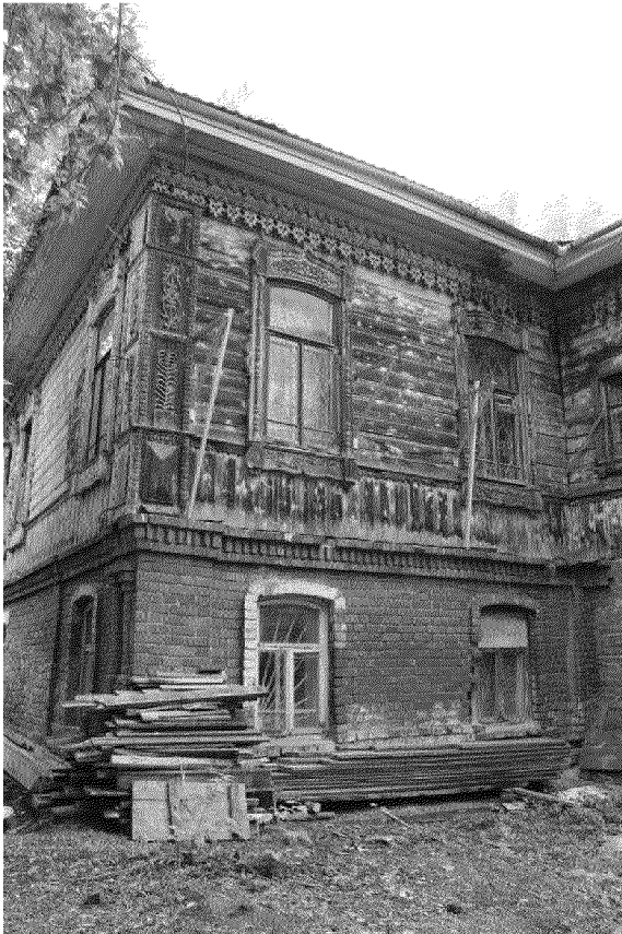
Видовая точка № 6 Фрагмент северного фасада