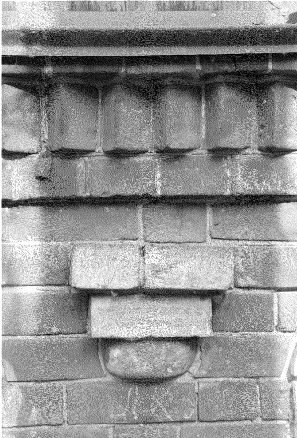
Видовая точка № 14 Фрагмент декора главного фасада