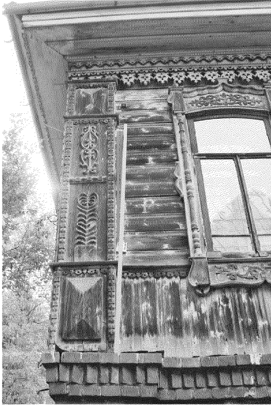
Видовая точка № 12 Фрагмент северного фасада. Угловые лопатки. Элементы декора лопаток – накладная объемная, ажурная, пропильная резьба