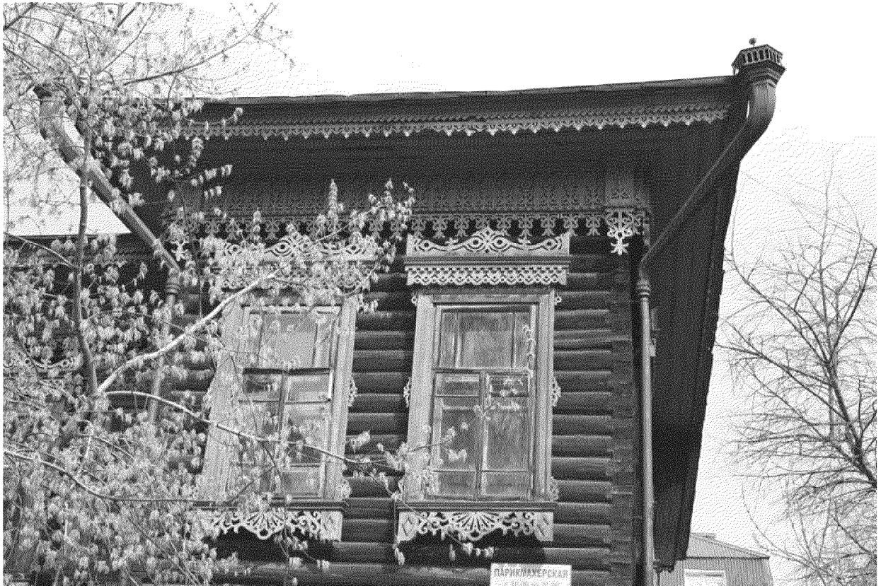
Видовая точка № 10.

Фрагмент ризалита южного фасада (до проведения ремонтных работ).