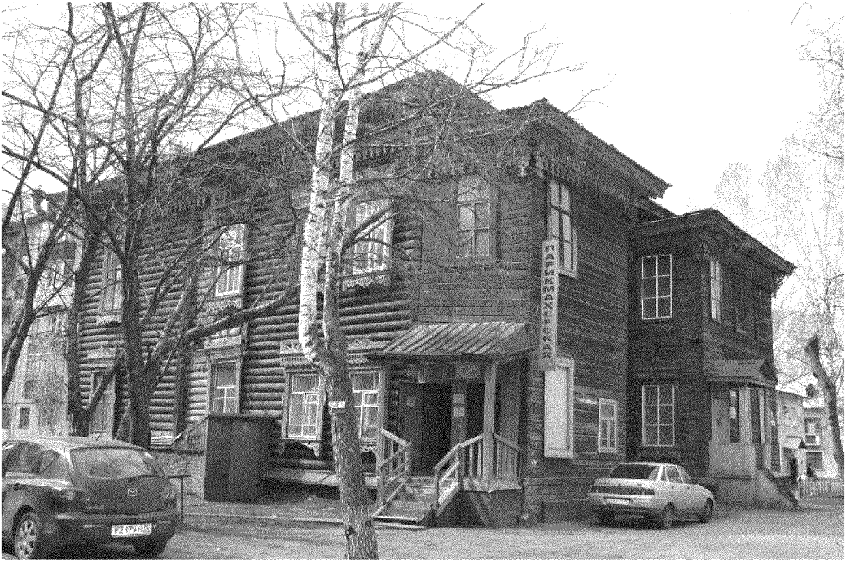
Видовая точка № 12.

Общий вид здания с северо-восточной стороны (до проведения ремонтных работ)