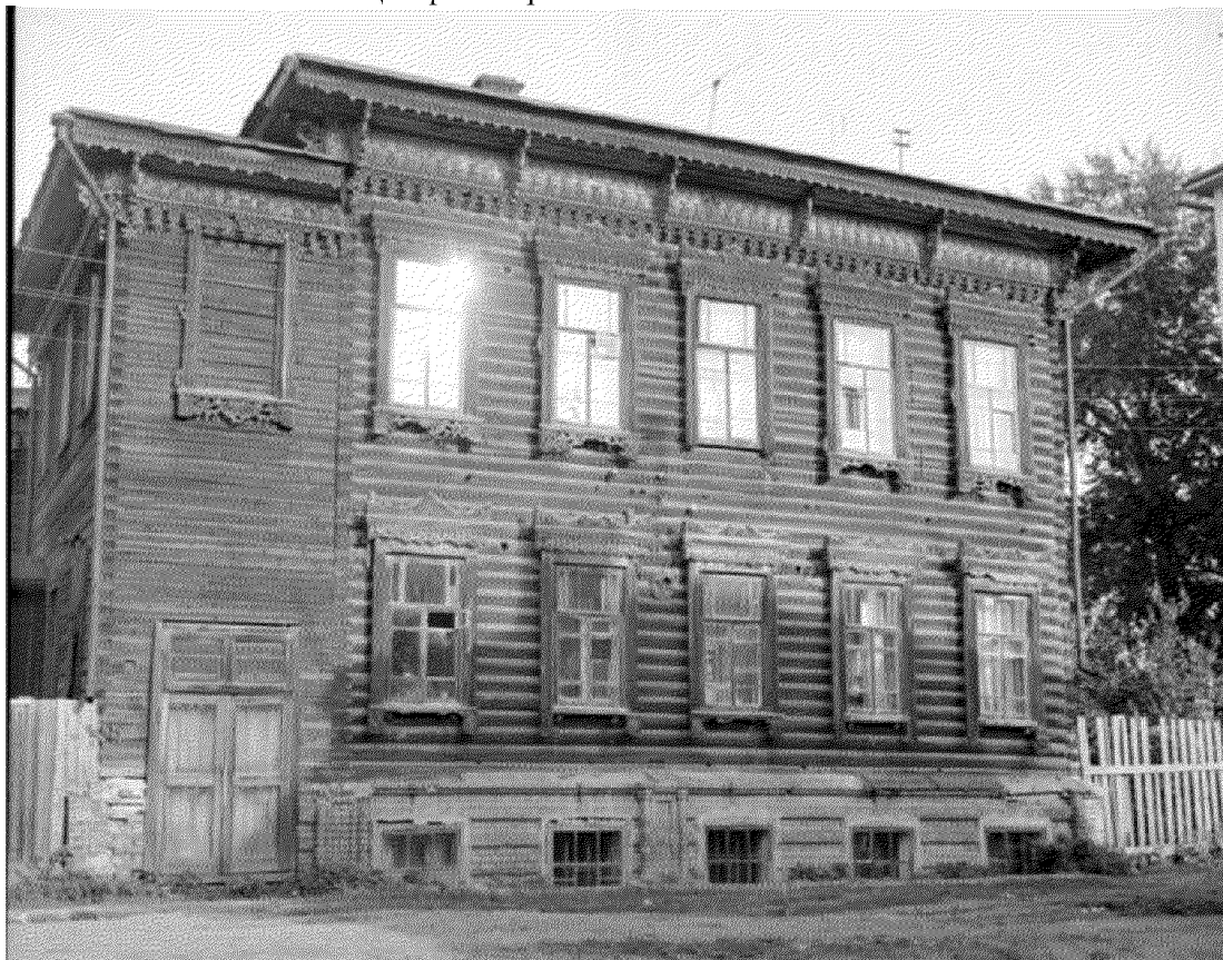
Видовая точка № 1. Вид здания по состоянию на 1970-е гг. (автор снимка: Коханенко П.Н.)

Автор снимков: начальник отдела научного учета ОКН (памятников истории и культуры) ОГАУК "Центр по охране памятников" Яблонская М.А.