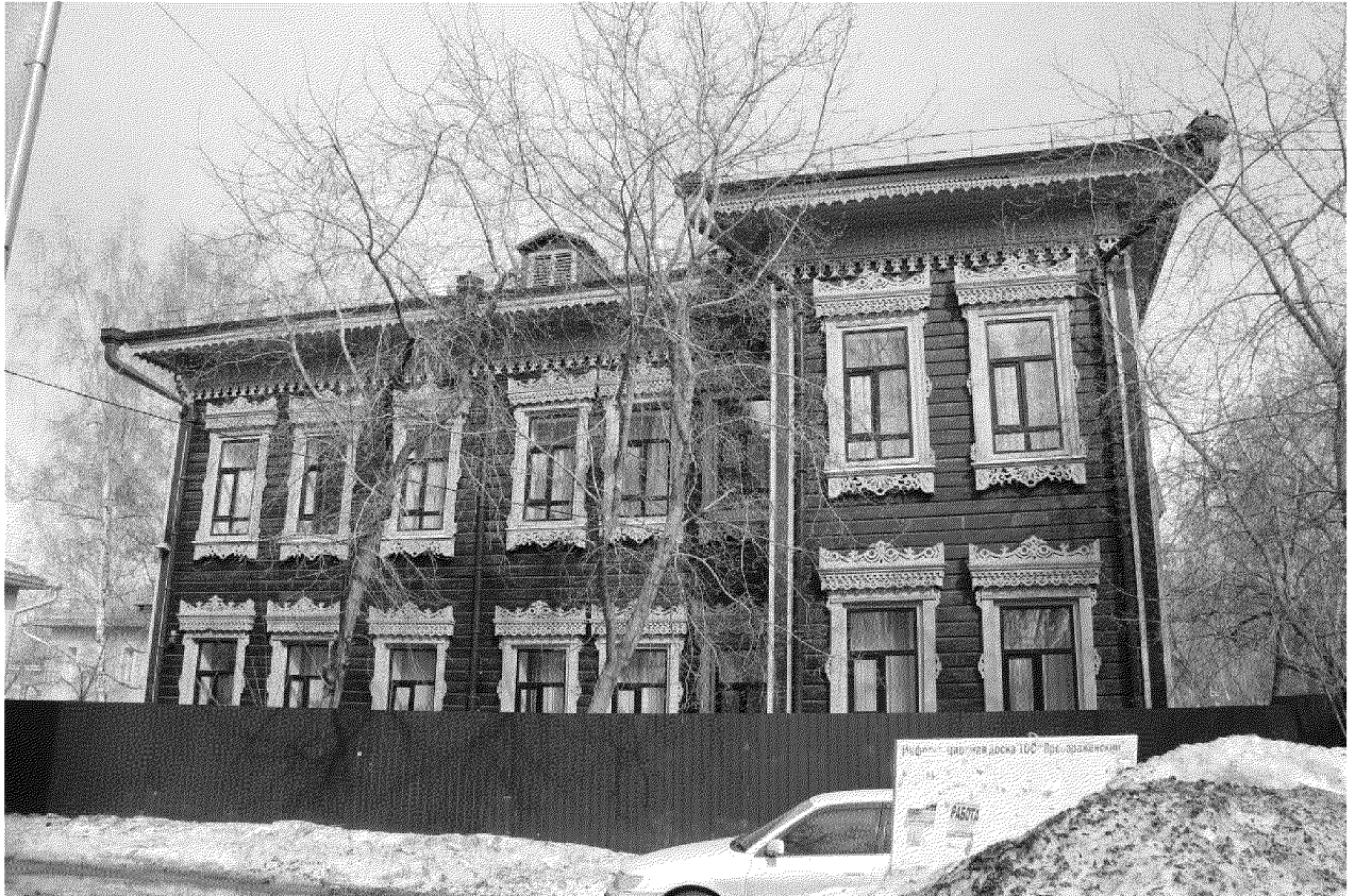
Видовая точка № 5. Южный фасад здания (дата съемки: 08.04.2020 г.)