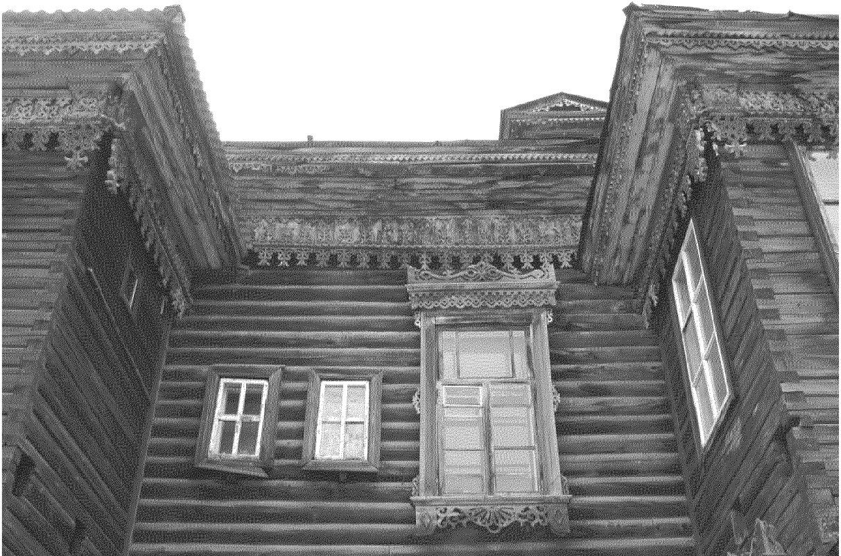
Видовая точка № 13.

Общий вид здания с северо-восточной стороны (до проведения ремонтных работ)