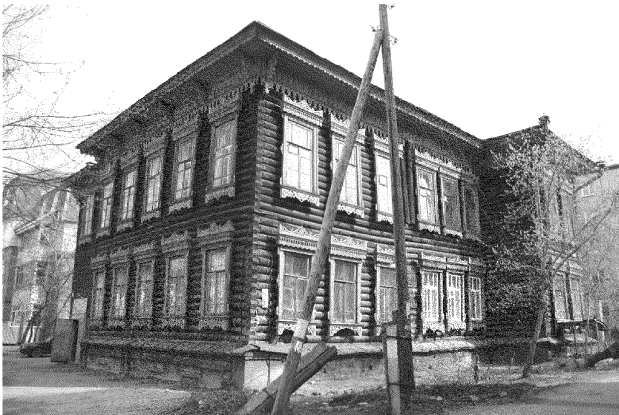
Видовая точка № 8. Общий вид здания с юго-западной стороны (до проведения ремонтных работ)