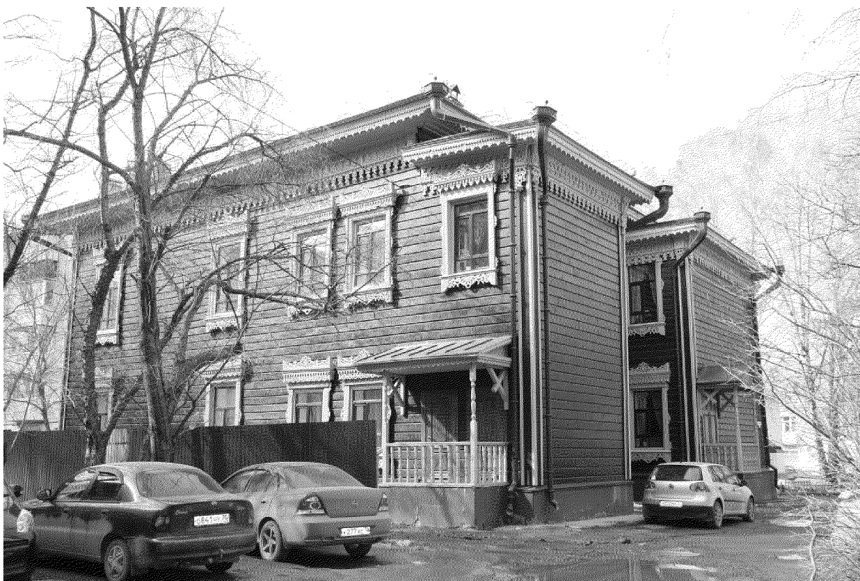
Видовая точка № 4. Общий вид здания с северо-восточной стороны (дата съемки: 08.04.2020 г.)