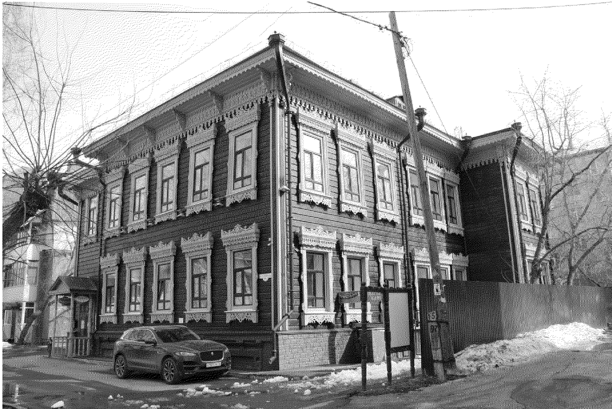
Видовая точка № 3. Общий вид здания с юго-западной стороны (дата съемки: 08.14.2020 г.)