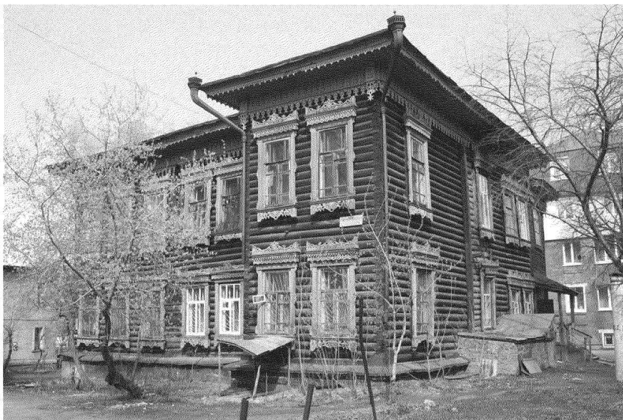
Видовая точка № 9. Общий вид здания с юго-восточной стороны (до проведения ремонтных работ)