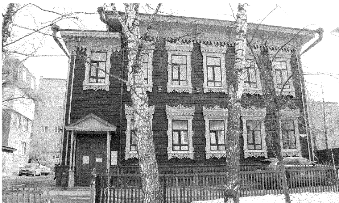
Видовая точка № 2. Главный (западный) фасад здания (08.04.2020 г.)