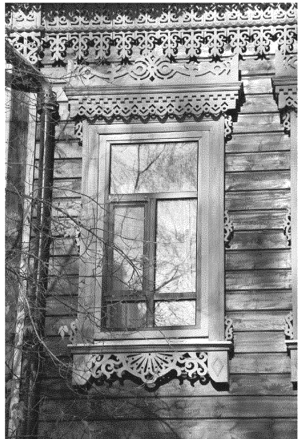
Видовая точка № 7. Окно 2-го этажа ризалита (после ремонта, дата съемки: 12.10.2018 г.)