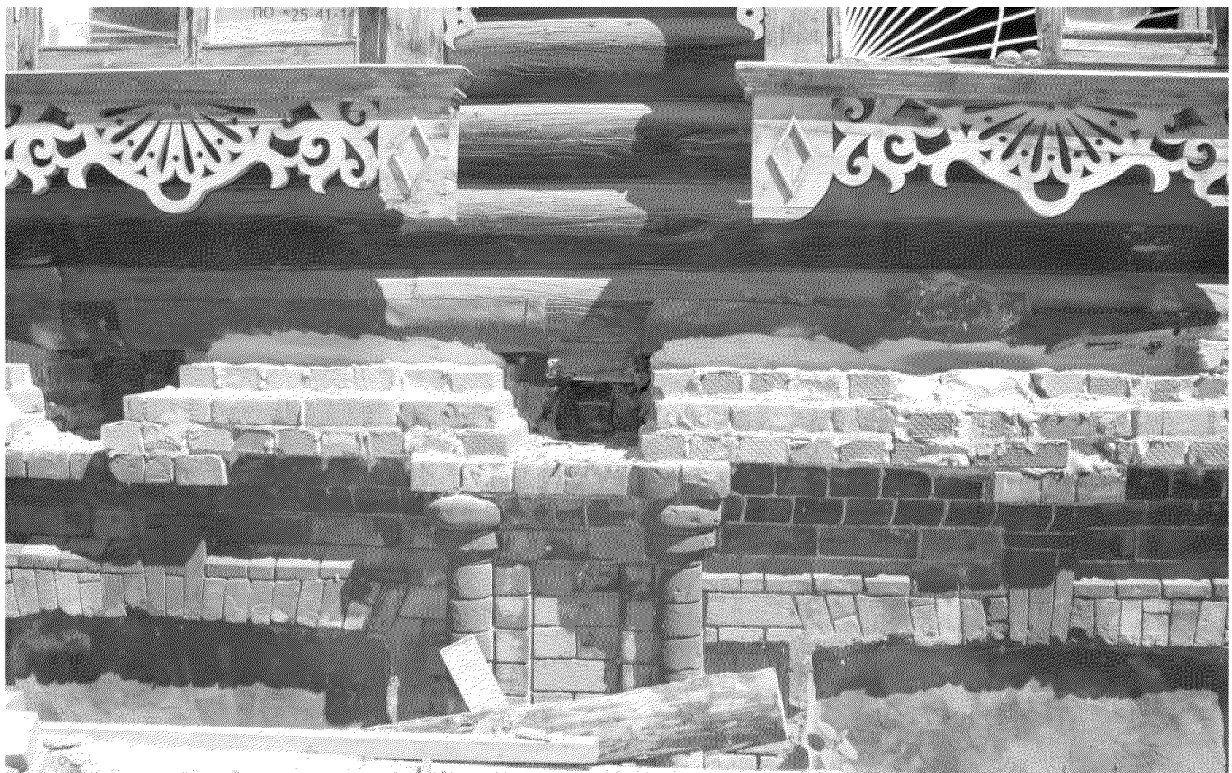
Видовая точка № 11.

Фрагмент ризалита южного фасада (до проведения ремонтных работ).