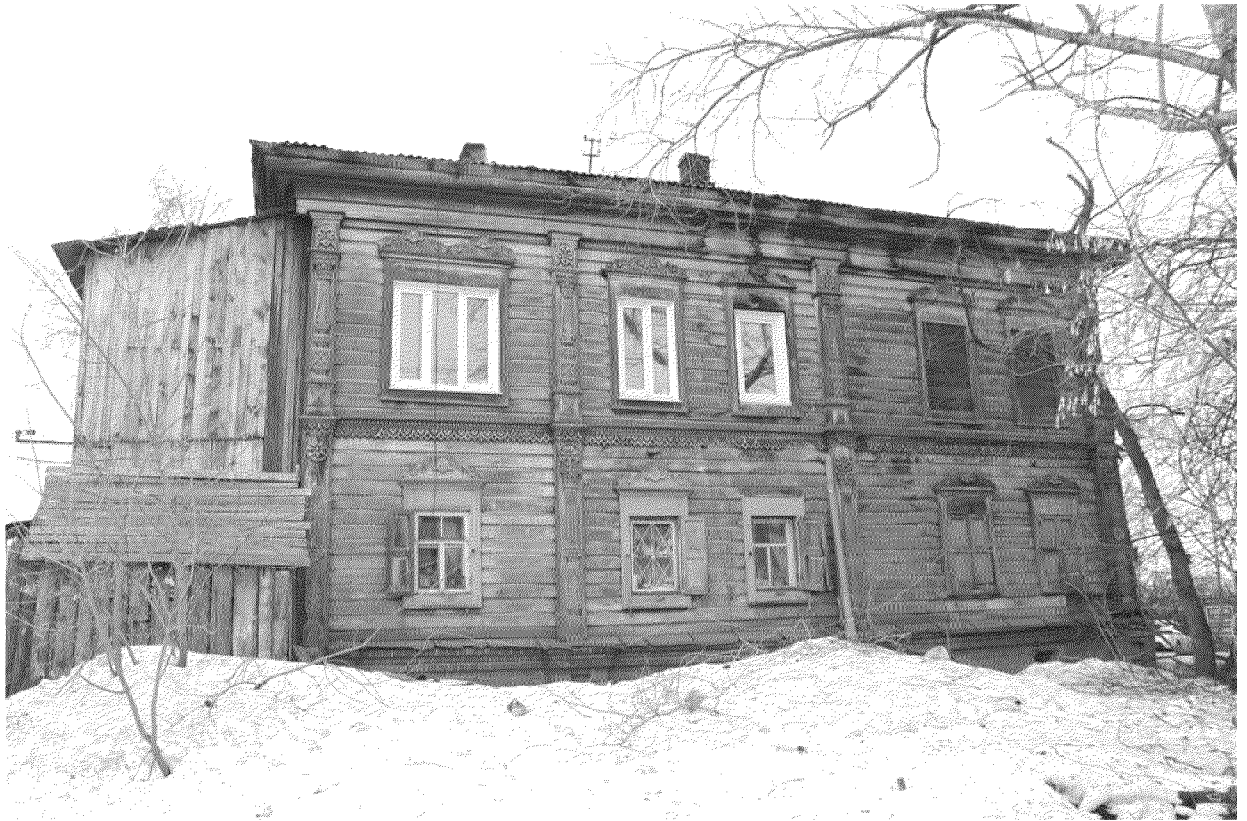
Видовая точка № 9. Северный фасад здания, вид с пер. Заозерного (08.04.2020 г.)