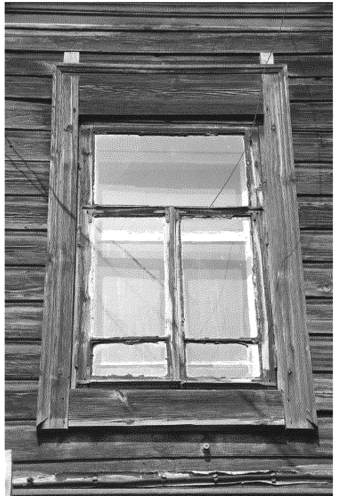
Видовая точка № 4. Деревянные рамы окна 2-го этажа