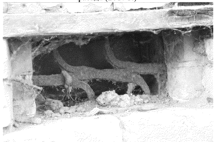
Видовая точка № 12 Вентиляционный продух подвала. Кованая решетка