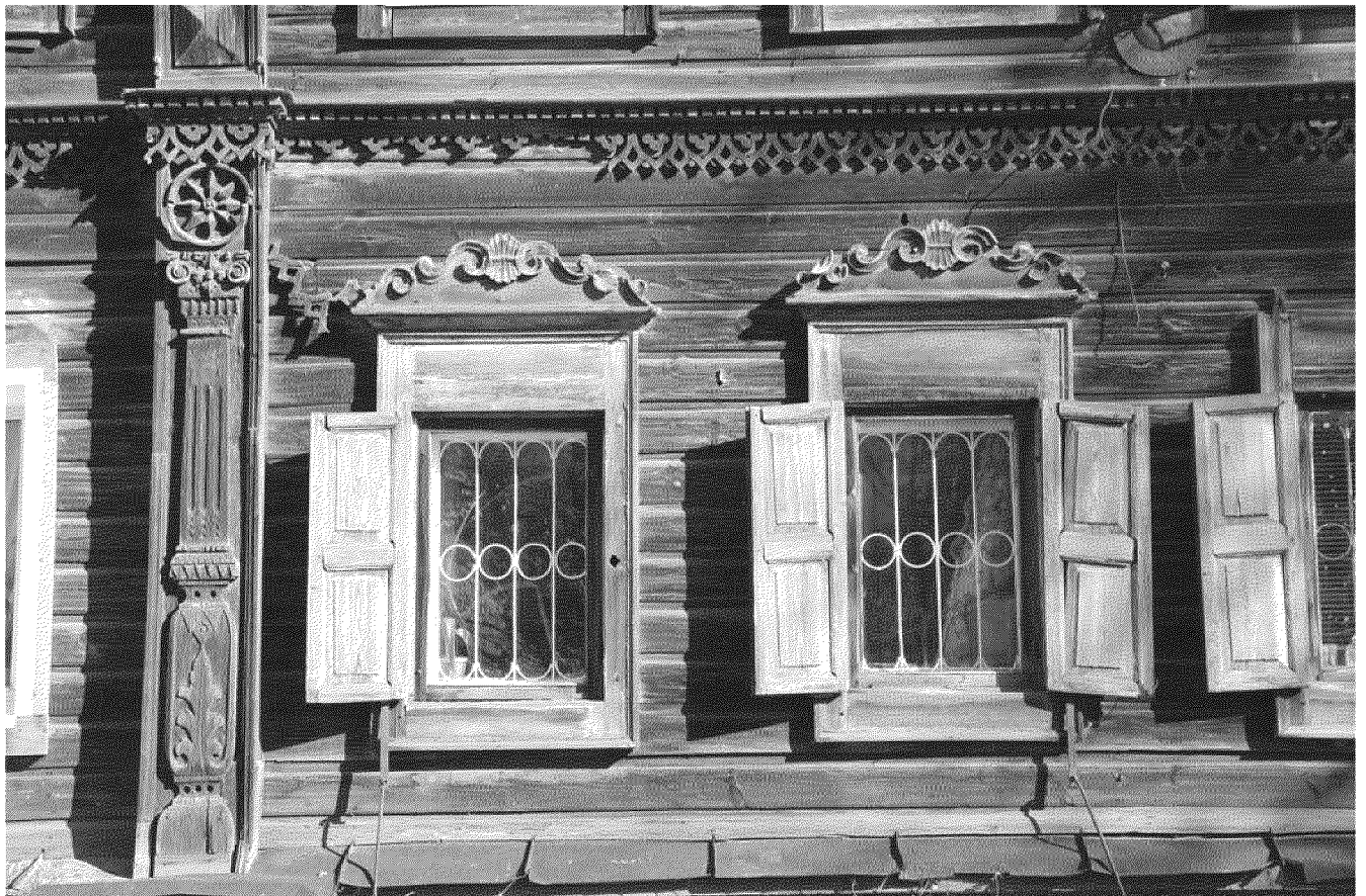
Видовая точка № 5. Окна 1-го этажа со ставнями. Фрагмент фасадного декора