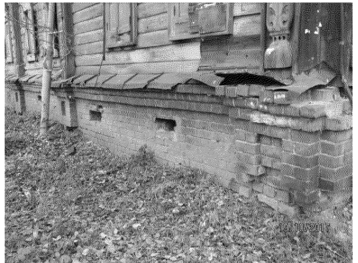
Видовая точка № 11 Цоколь с вентиляционными отверстиями северного фасада (2017 г.)