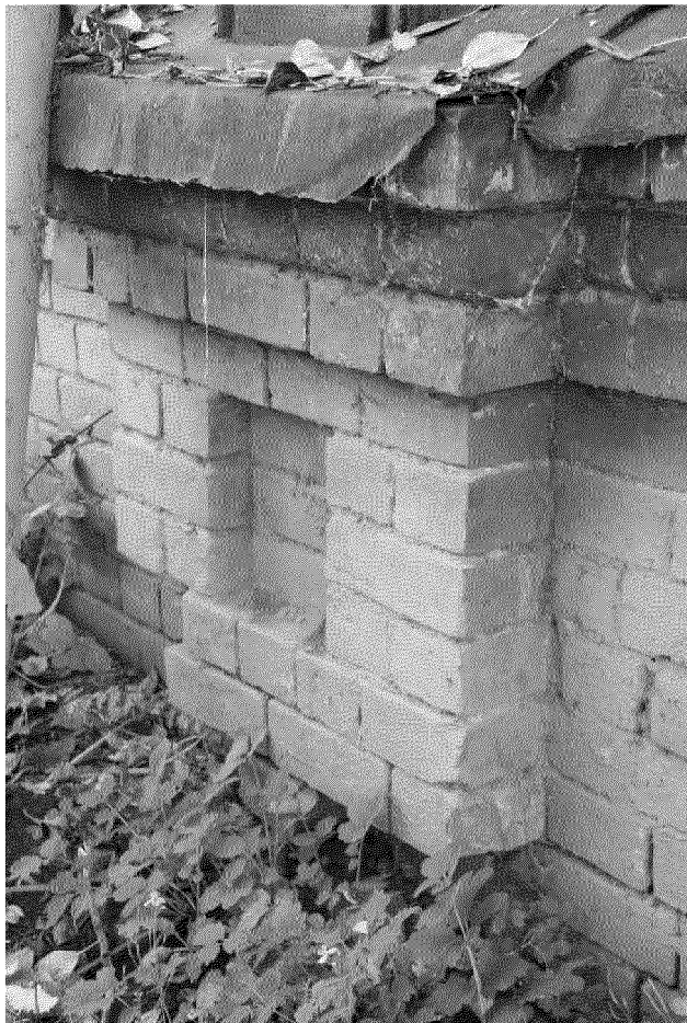
Видовая точка № 10 Фрагмент декора цоколя (2017 г.)