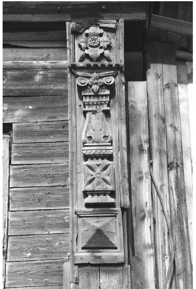
Видовая точка № 7. Декор лопатки южного фасада (2 этаж)