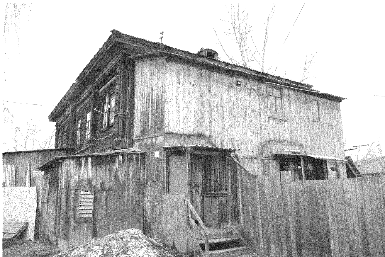
Видовая точка № 14 Общий вид здания с территории двора. Дворовый (восточный) фасад (08.04.2020 г.)