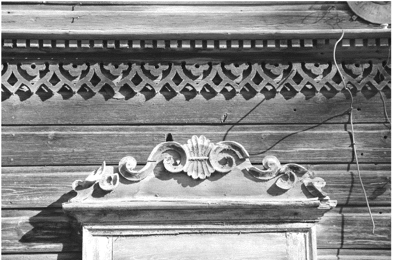
Видовая точка № 8. Фрагмент главного (западного) фасада. Междуэтажный пояс Валютообразное навершие наличника окна 1-го этажа