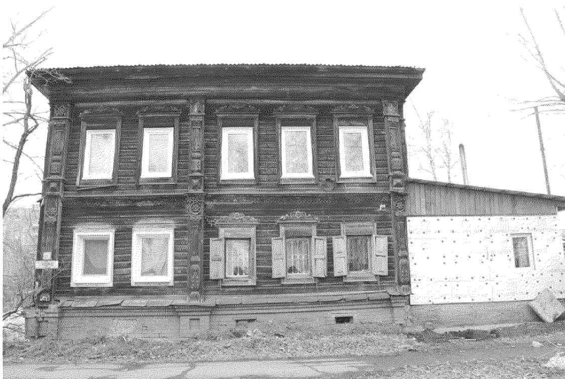
Видовая точка № 2. Главный западный фасад здания (08.04.2020 г.).