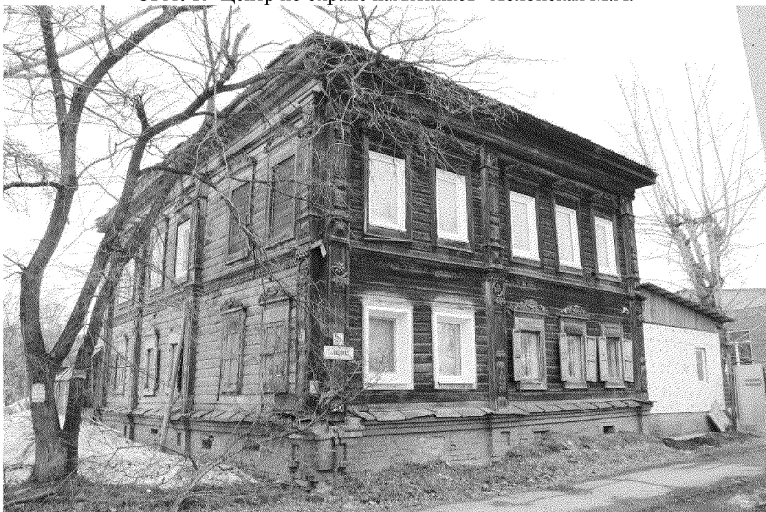
Видовая точка № 1. Общий вид здания с ул. Войкова (08.04.2020 г.)