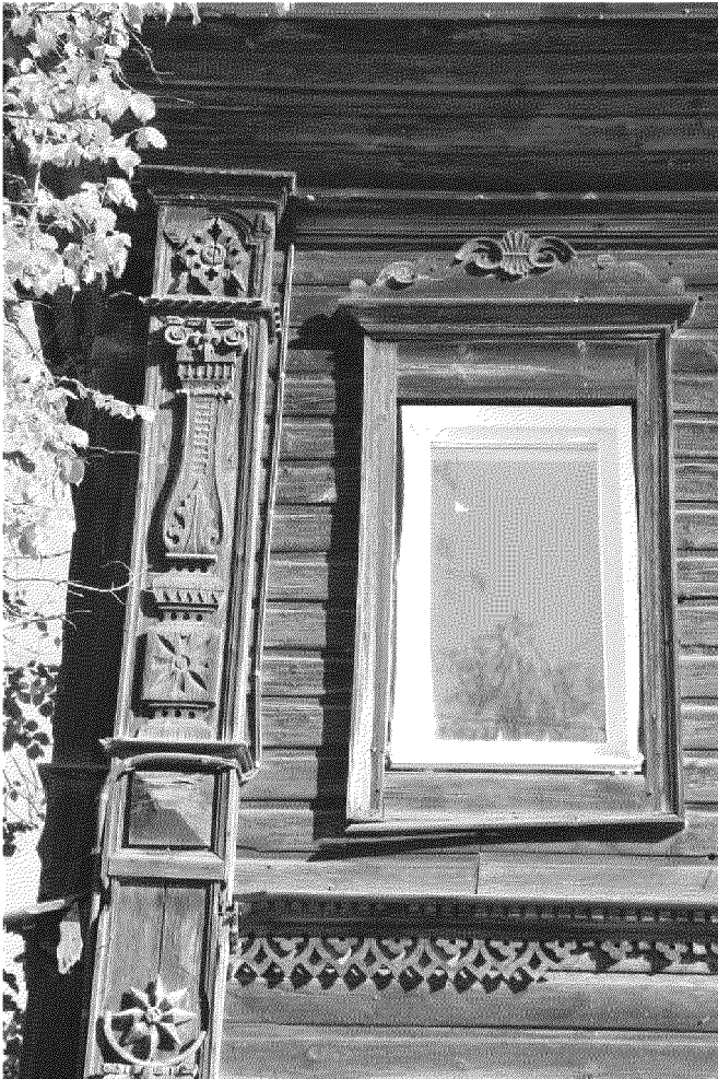
Видовая точка № 3. Наличник окна 2-го этажа. Фрагмент пилястры