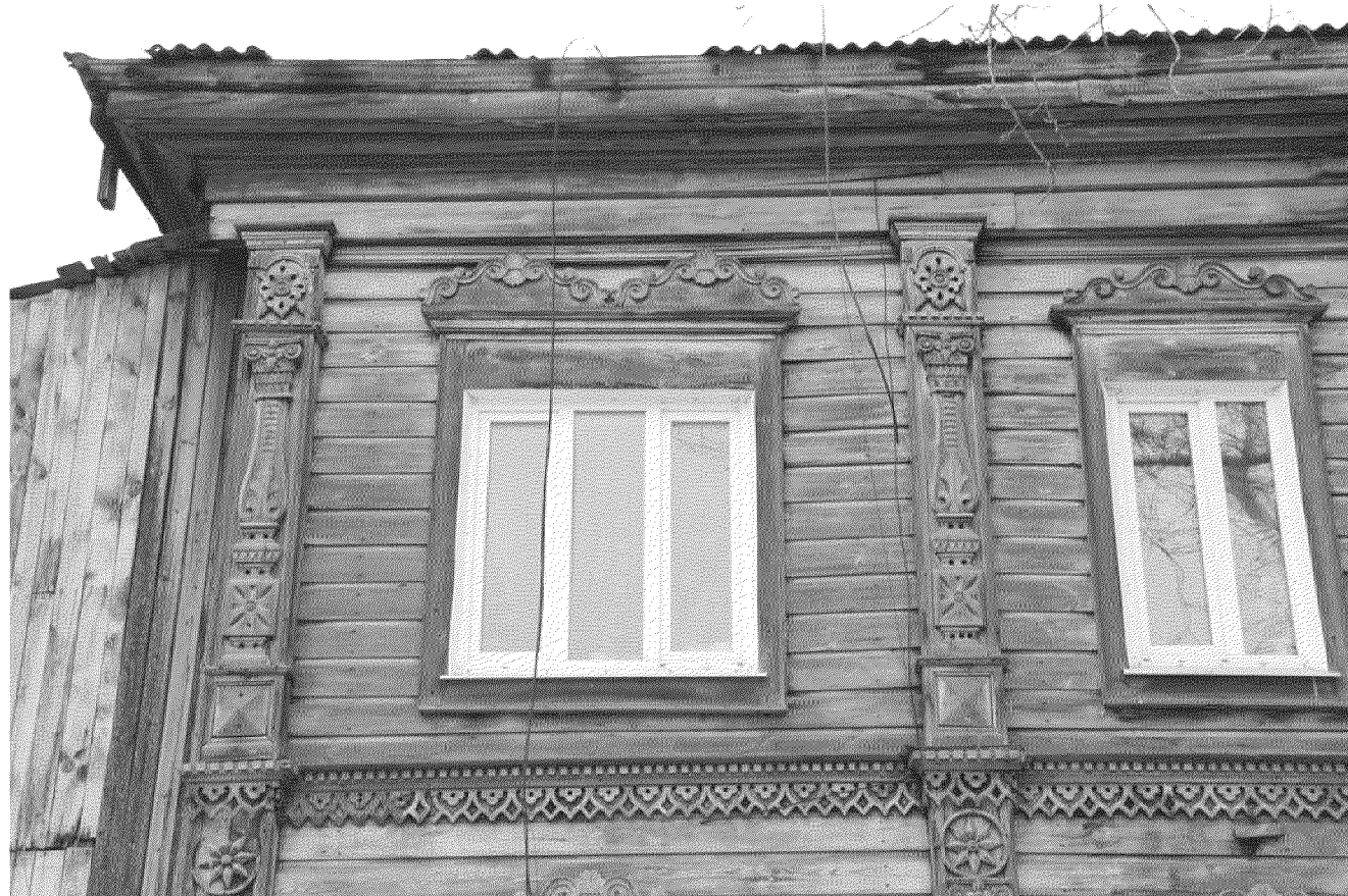
Видовая точка № 13 Фрагмент декора северного фасада. Сдвоенное окно 2-го этажа (08.04.2020 г.)