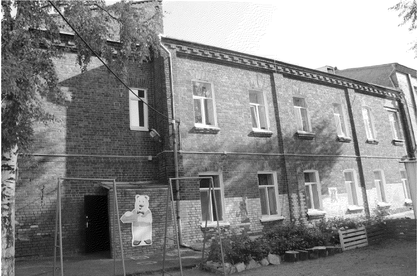
Видовая точка № 9. Дворовый (западный) фасад