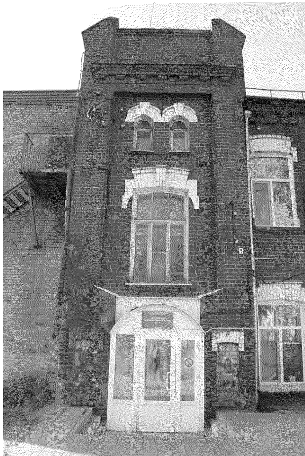
Видовая точка № 3 Фрагмент главного фасада. Левый ризалит