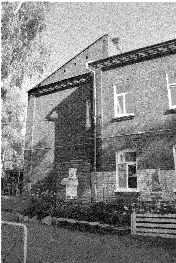
Видовая точка № 10 Фрагмент дворового (западного) фасада