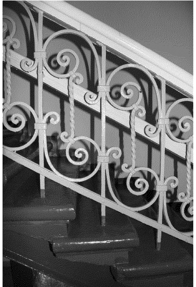
Видовая точка № 13 Кованое ограждение парадной лестницы