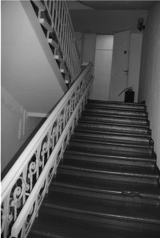
Видовая точка № 12 Лестница парадного входа (песчаник)