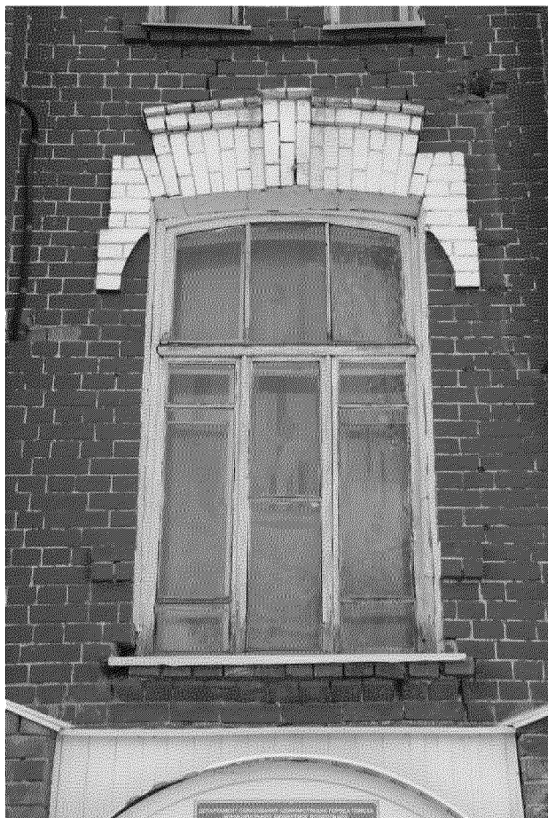
Видовая точка № 5 Окно левого ризалита главного фасада