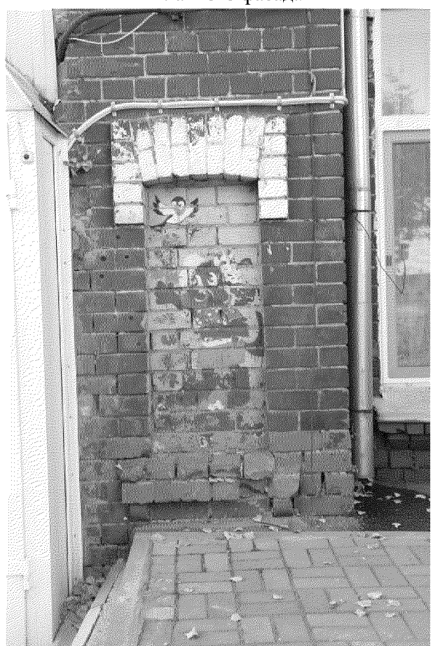
Видовая точка № 6 Боковые окна парадного входа левого ризалита