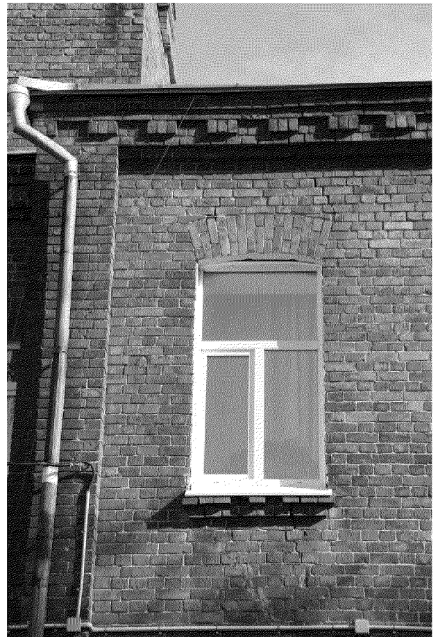
Видовая точка № 11 Фрагмент дворового (западного) фасада