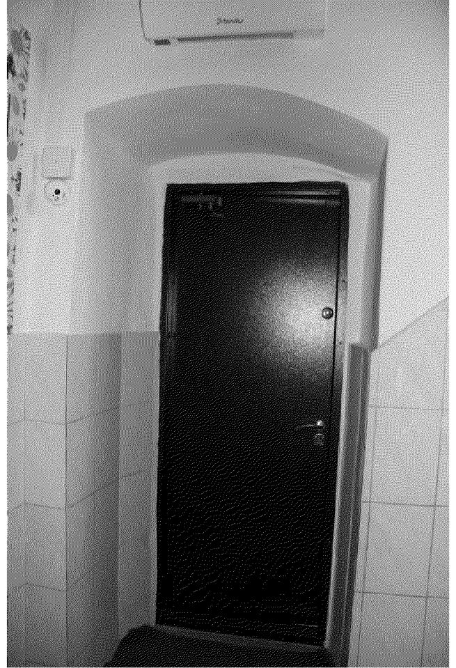
Видовая точка № 17 Дверной проем с лучковой перемычкой