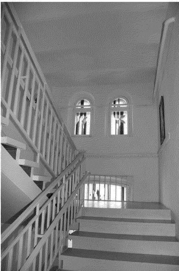
Видовая точка № 14 Лестница на уровень 3-го этажа