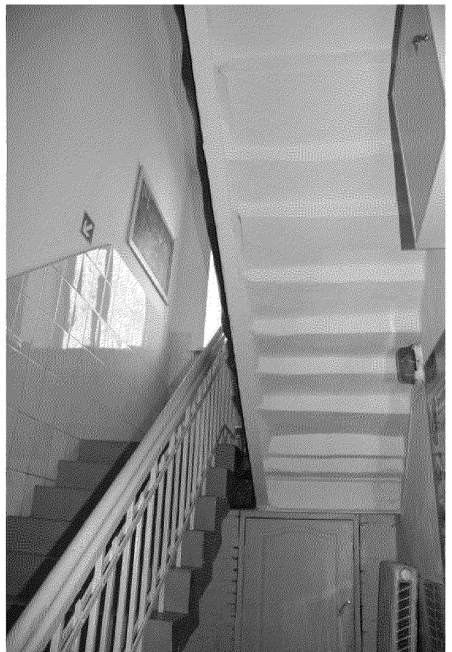
Видовая точка № 15 Лестница северо-западной части здания