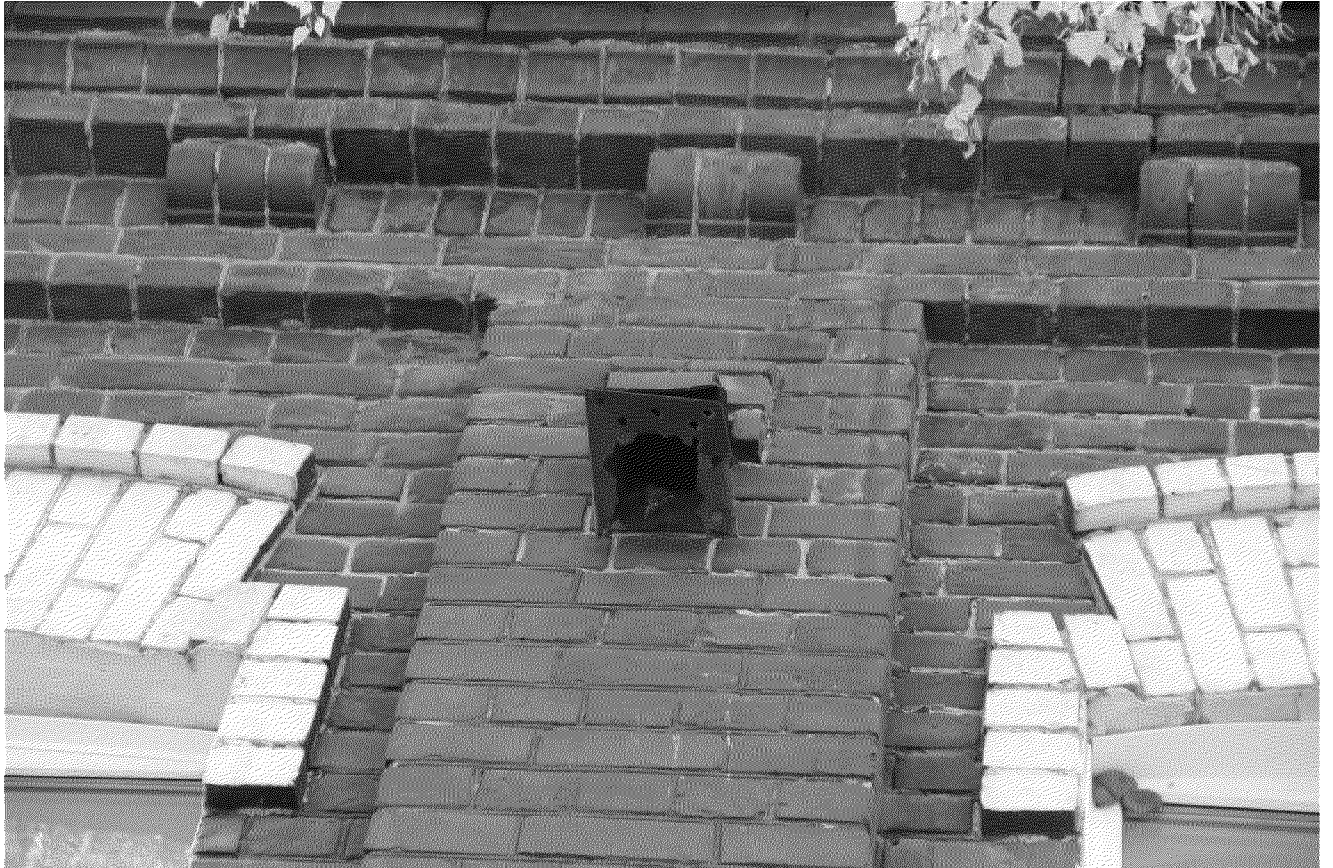
Видовая точка № 7. Фрагмент главного фасада здания. Вентиляционный проход