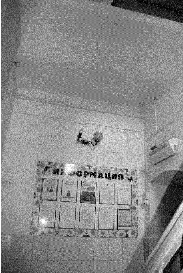
Видовая точка № 16 Фрагмент лестницы: кирпичные своды лестничной площадки, лучковый дверной проем