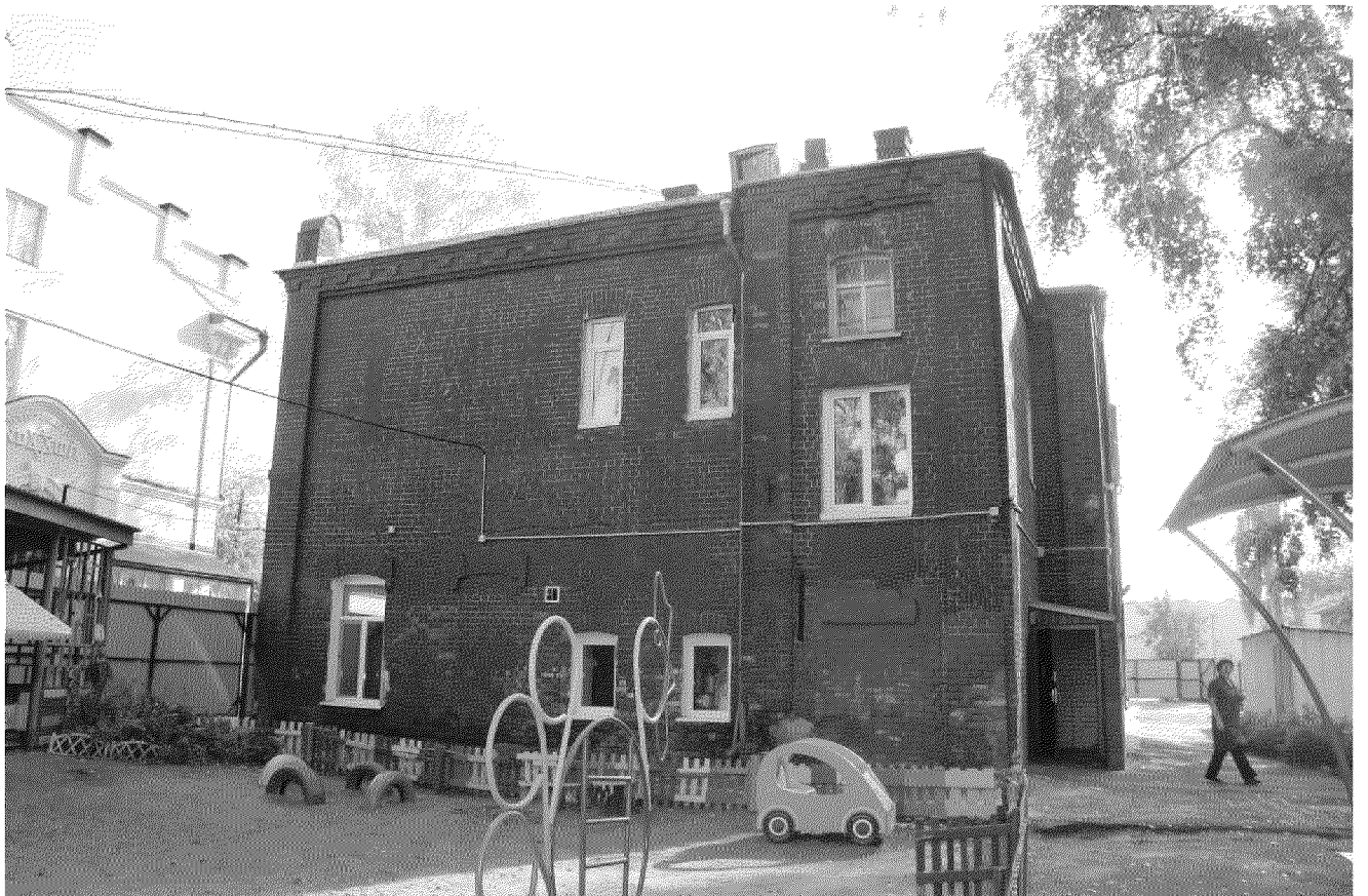
Видовая точка № 8. Торцевой (северный) фасад. Вид с территории двора