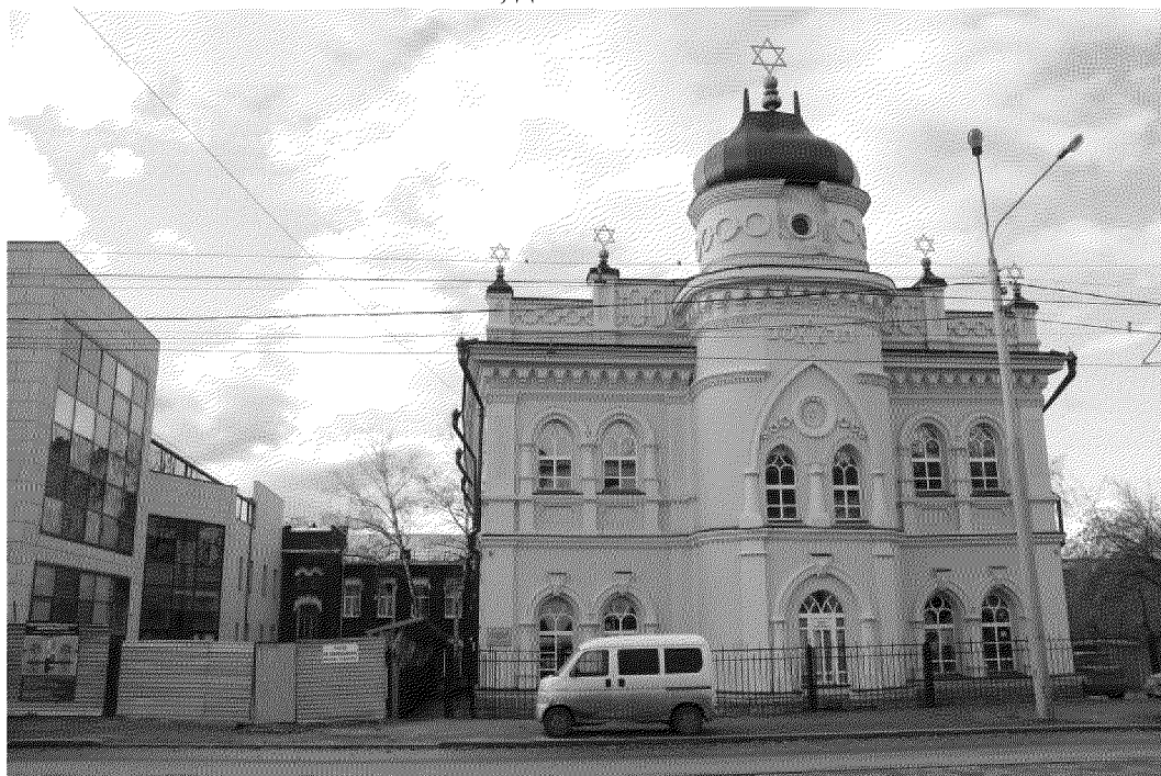
Видовая точка №1 Вид здания со стороны ул. Р.Люксембург

Фотографические изображения предмета охраны объекта культурного наследия регионального значения «Дом призрения престарелых евреев, построенный Исааком Самуиловичем Быховским на усадьбе каменной синагоги», 1910 г., расположенного по адресу: Томская область, г. Томск, Розы Люксембург улица, 38/2 дата съемки: 28.09.2016 г.