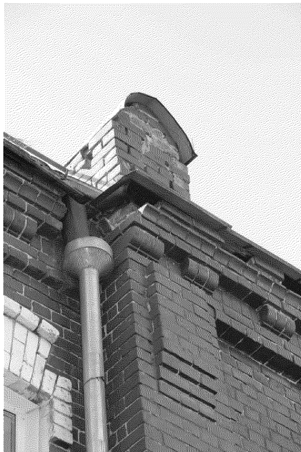
Видовая точка № 4 Фрагмент карниза правого ризалита главного фасада