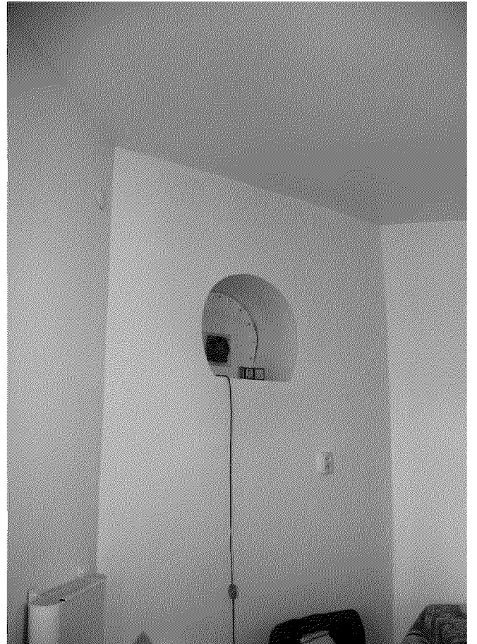
Видовая точка № 12. Фрагмент окна 2-го этажа