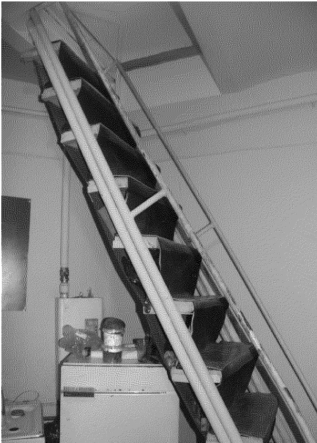
Видовая точка № 11. Лестница на 2-ой этаж