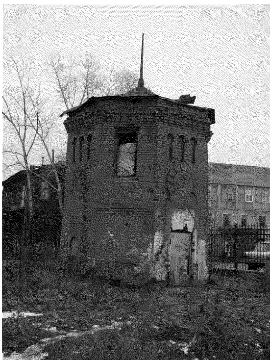
Видовая точка № 2. Вид будки с северо-западной стороны (2002 г.)

Общий вид с ул. Войкова (Яблонская М.А., 2002 г.)