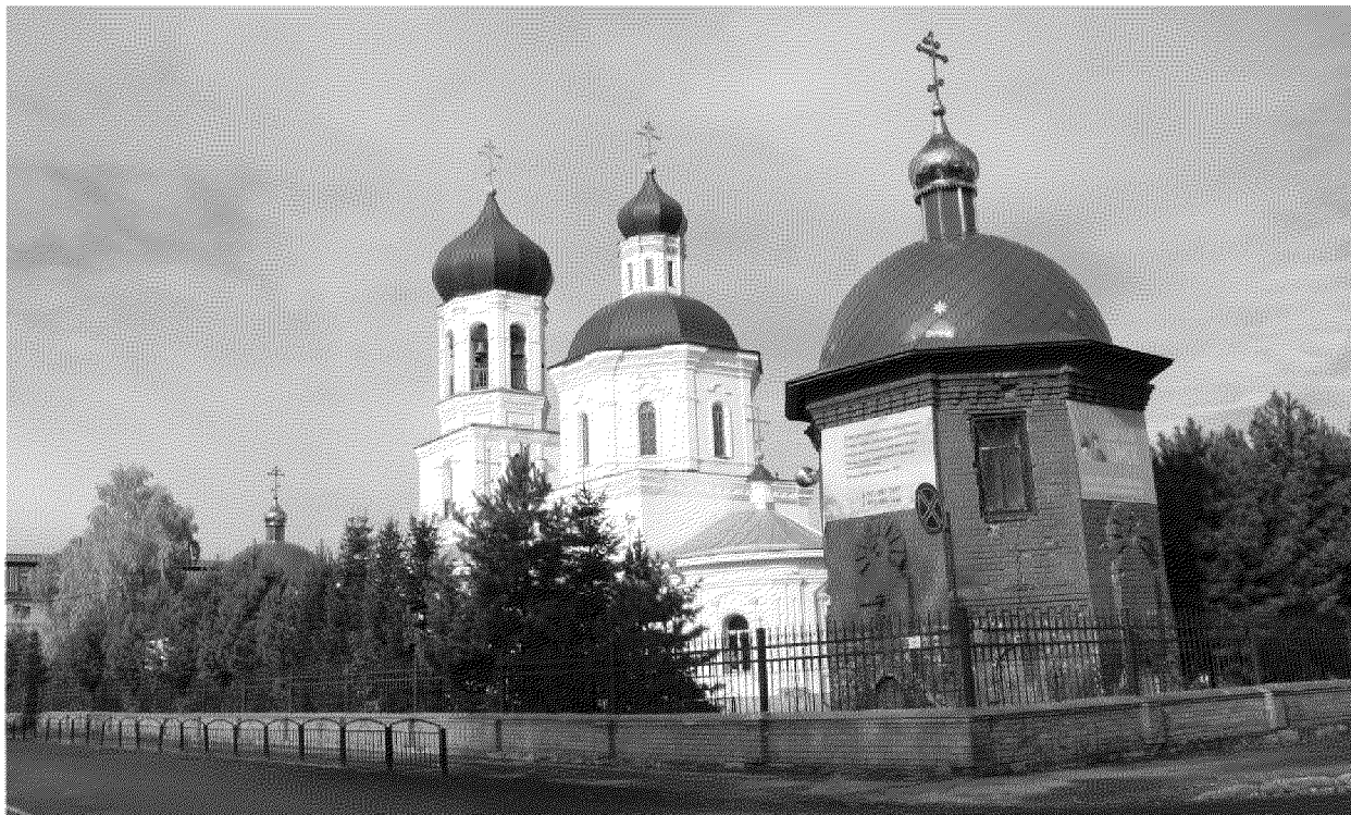
Видовая точка № 4. Общий вид водоразборной будки с ул. Войкова