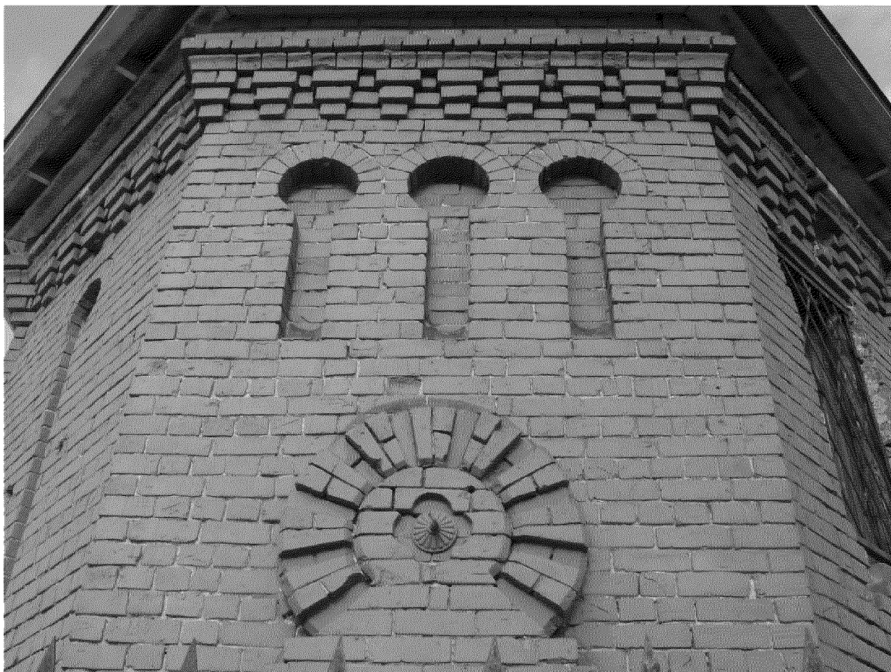
Видовая точка № 5. Фрагмент восточного фасада (2011 г.).