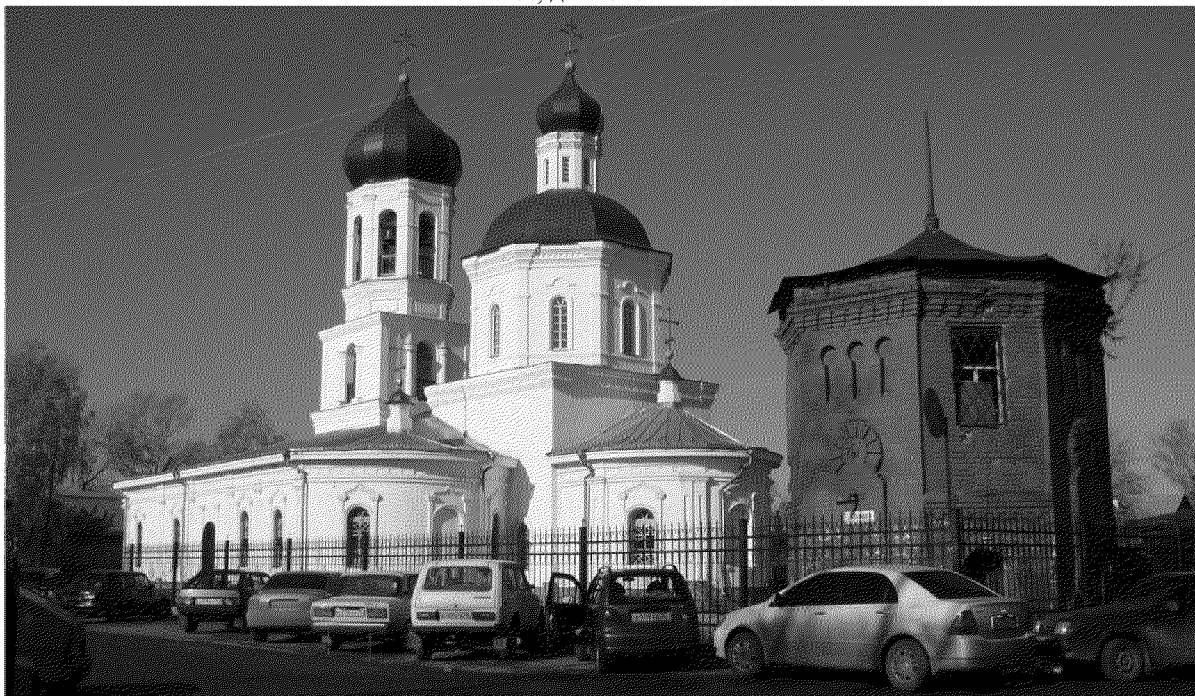
Видовая точка № 1.

Рыжикова А.Ю., дата съемки: 27.12.2016 г.