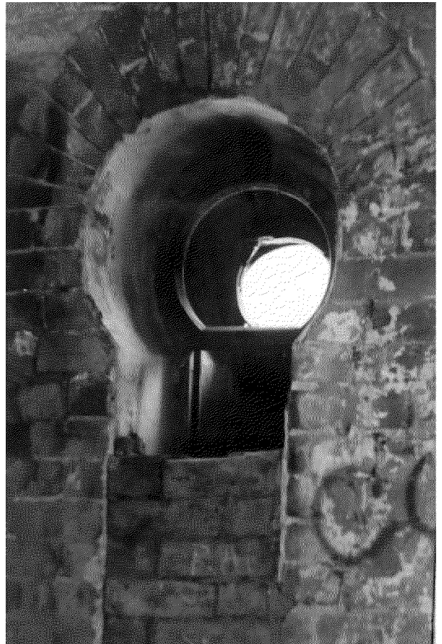
Видовая точка № 7. Фигурное окно 2-го этажа, вид изнутри помещения (1990-е гг.)