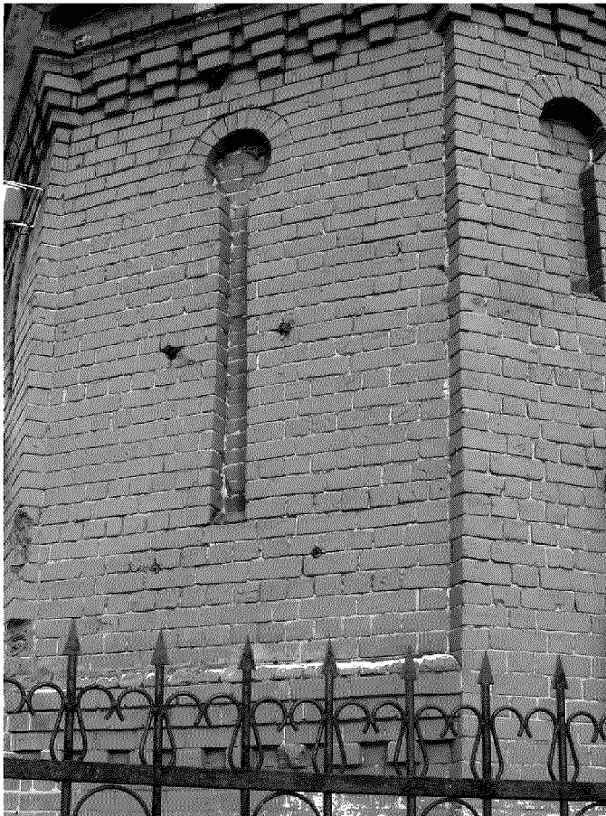
Видовая точка № 6. Фигурное окно 2-го этажа юго-восточного фасада.