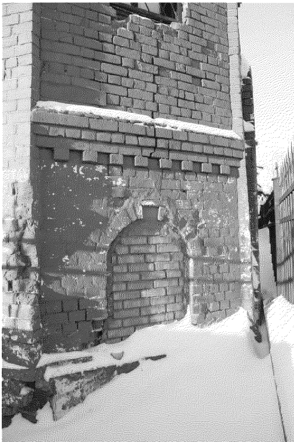
Видовая точка № 8. Арочное окно юго-восточного фасада.