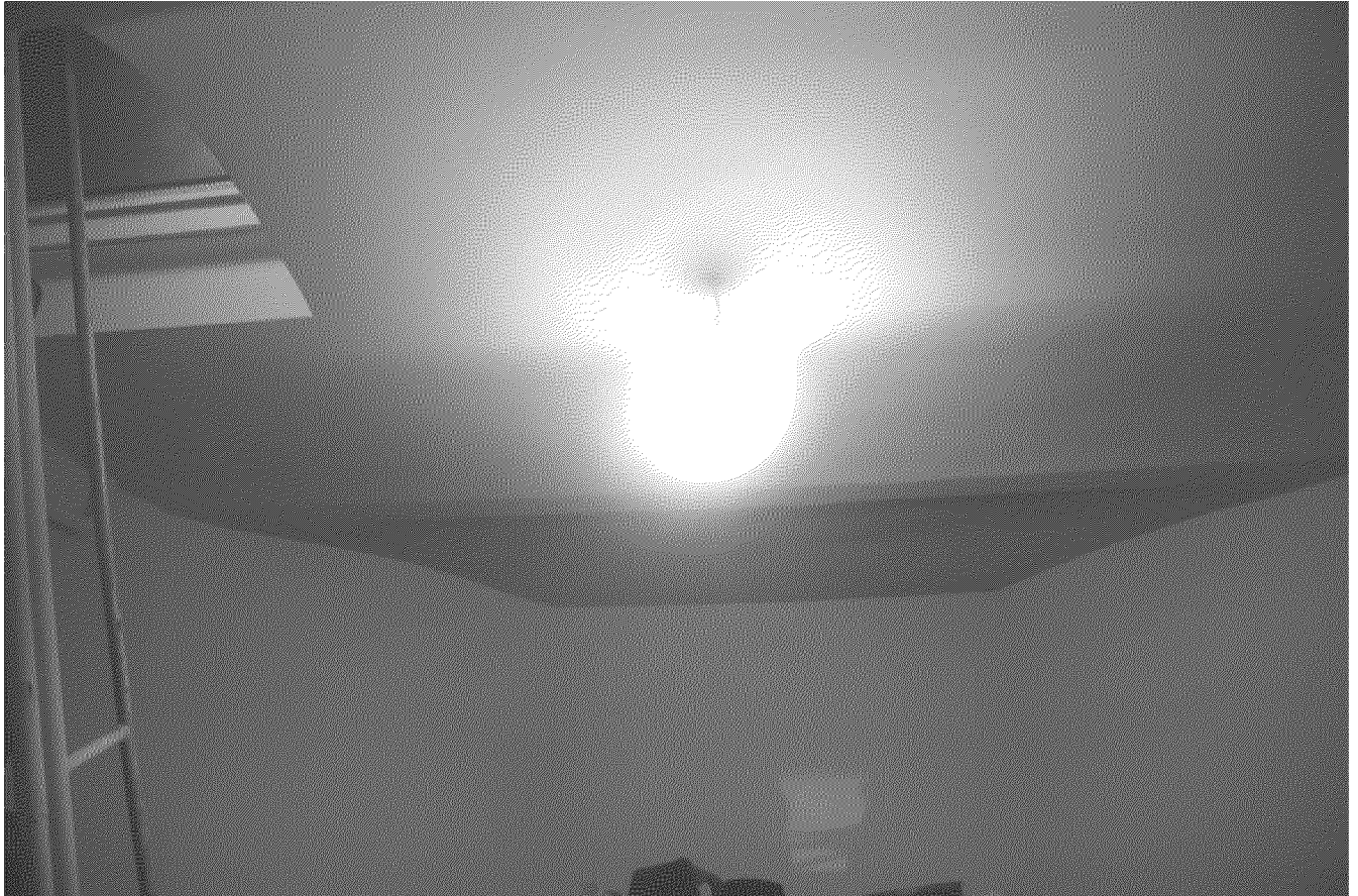
Видовая точка № 10. Фрагмент междуэтажного перекрытия (кирпичные своды по металлическим балкам)