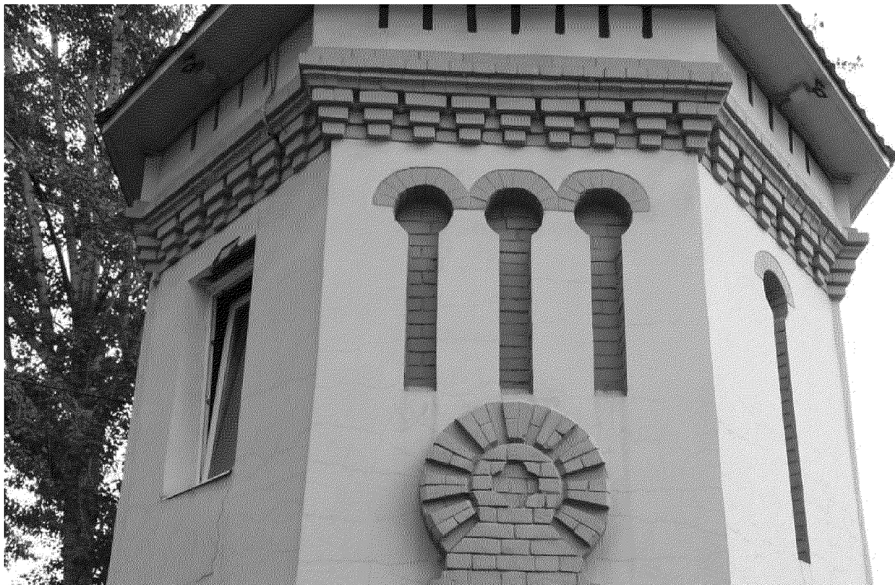
Видовая точка № 6. Фрагмент южного фасада. Окна (ниши) 2-го этажа, профильный междуэтажный карниз с «сухариками».