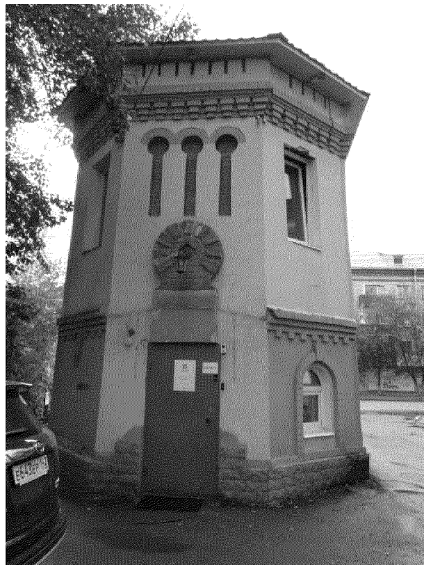
Видовая точка № 4. Вид башни с восточной стороны