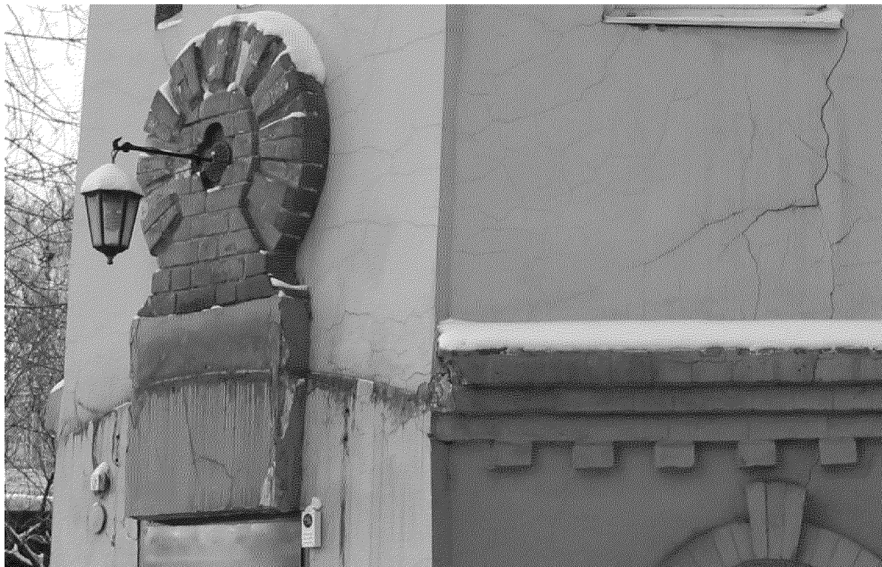
Видовая точка № 5. Элементы фасадного декора: междуэтажный пояс, фрагмент декоративного элемента с рустованным обрамлением. (фото 2016 г.)