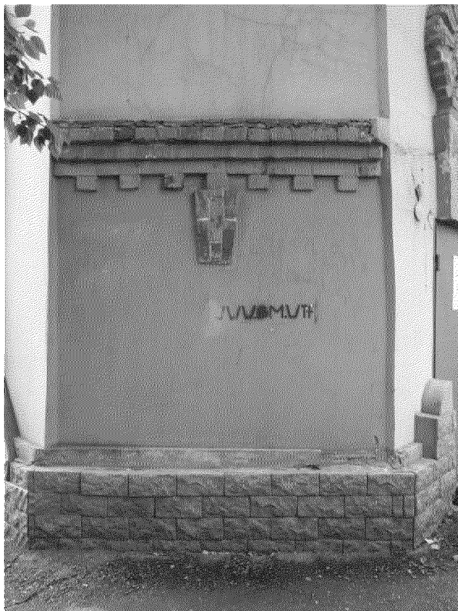
Видовая точка № 7. Профильный междуэтажный карниз с «сухариками»