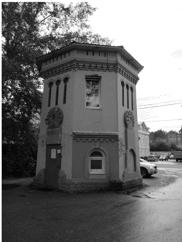
Видовая точка № 3. Вид башни с северо-восточной стороны