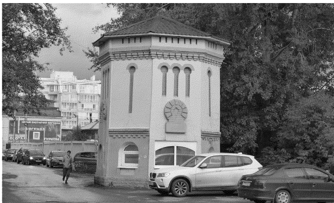
Видовая точка № 2.

Общий вид башни с пр. Ленина