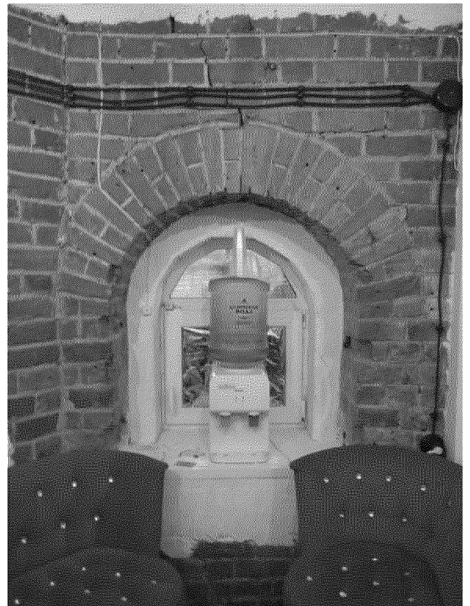
Видовая точка № 11.

Фрагмент интерьера помещения 1-го этажа. Арочный оконный проект