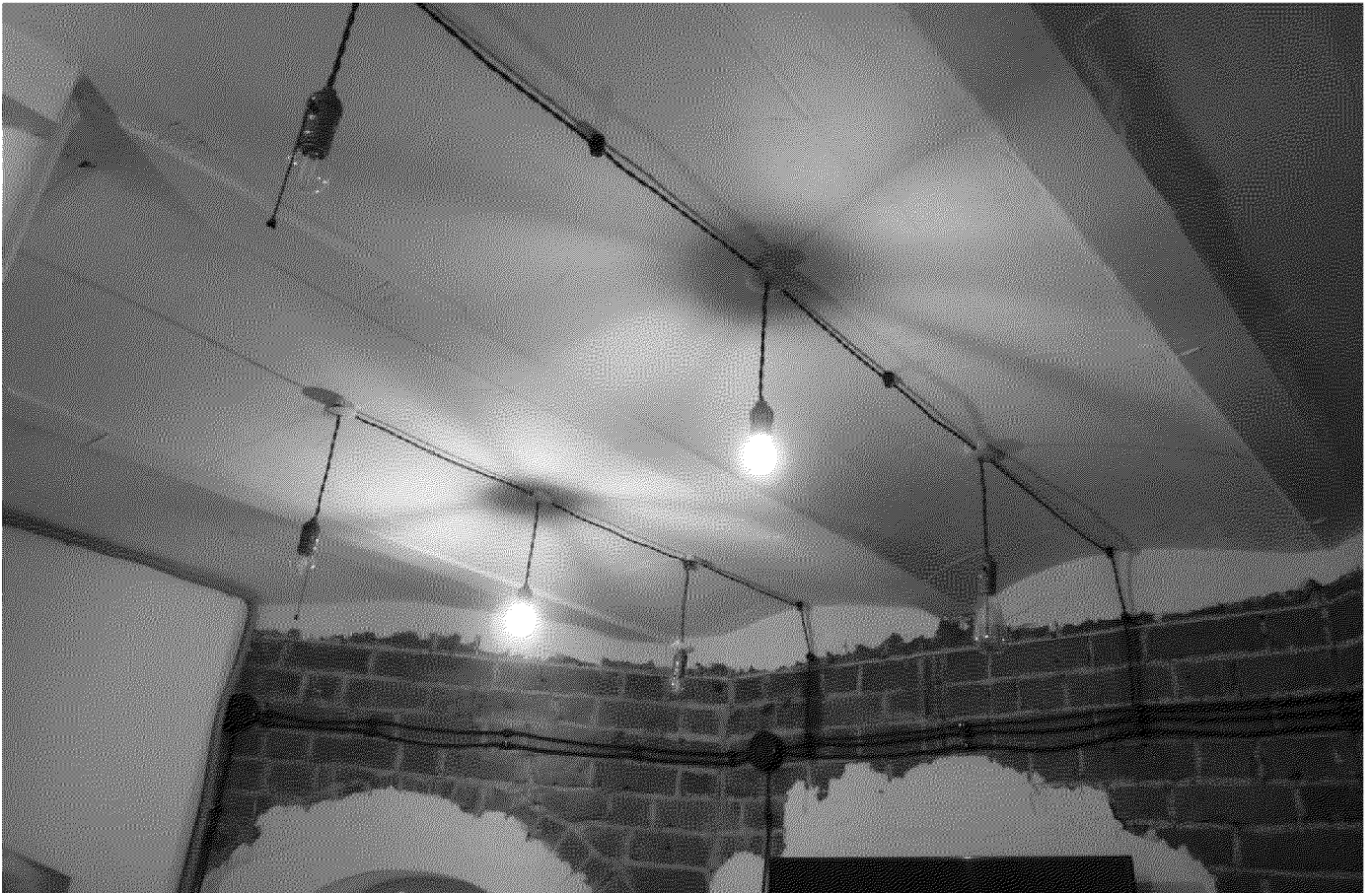
Видовая точка № 9.

Фрагмент междуэтажного перекрытия (кирпичные своды по металлическим балкам)