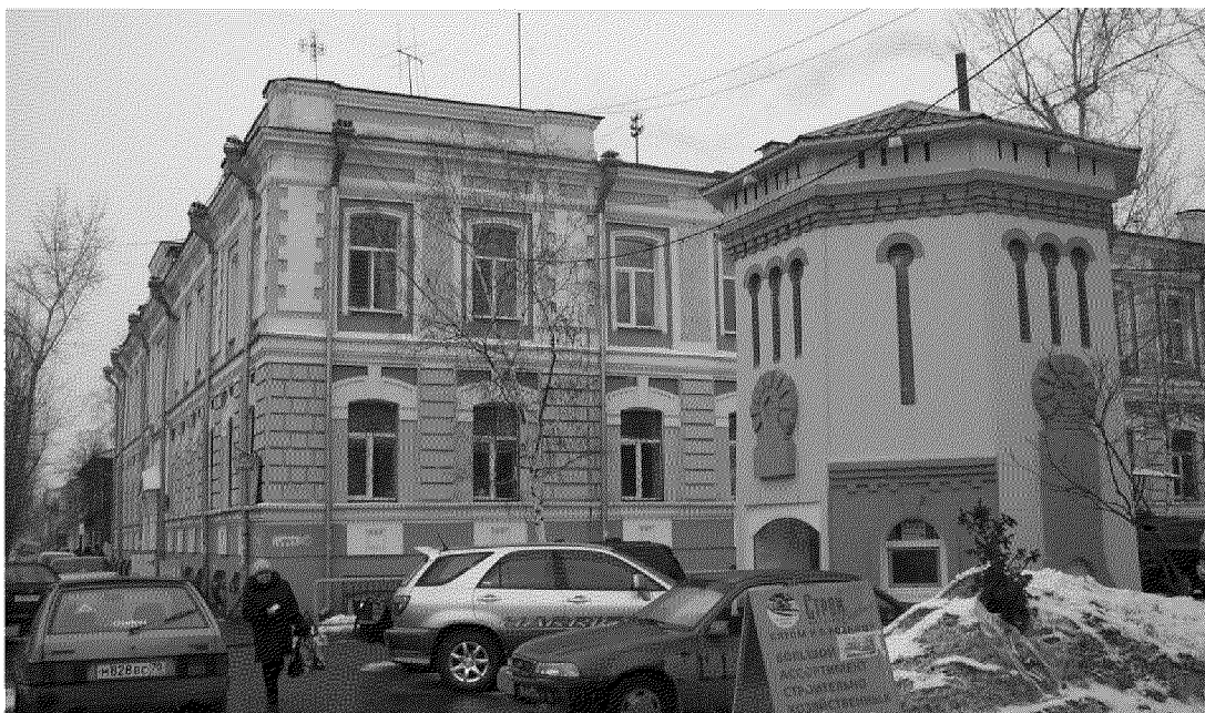
Видовая точка № 1.

дата съемки: 01.07.2019 г.