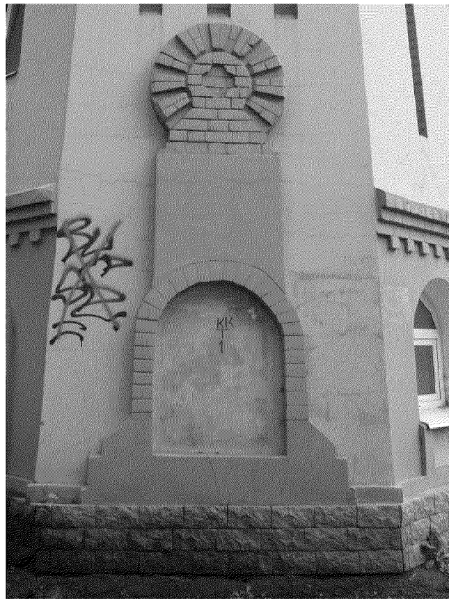
Видовая точка № 8. Выступающий фигурный элемент фасадного декора с арочным окном (ниша)