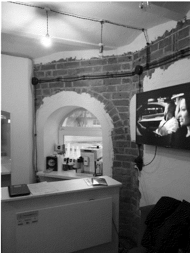
Видовая точка № 10.

Фрагмент междуэтажного перекрытия (кирпичные своды по металлическим балкам)