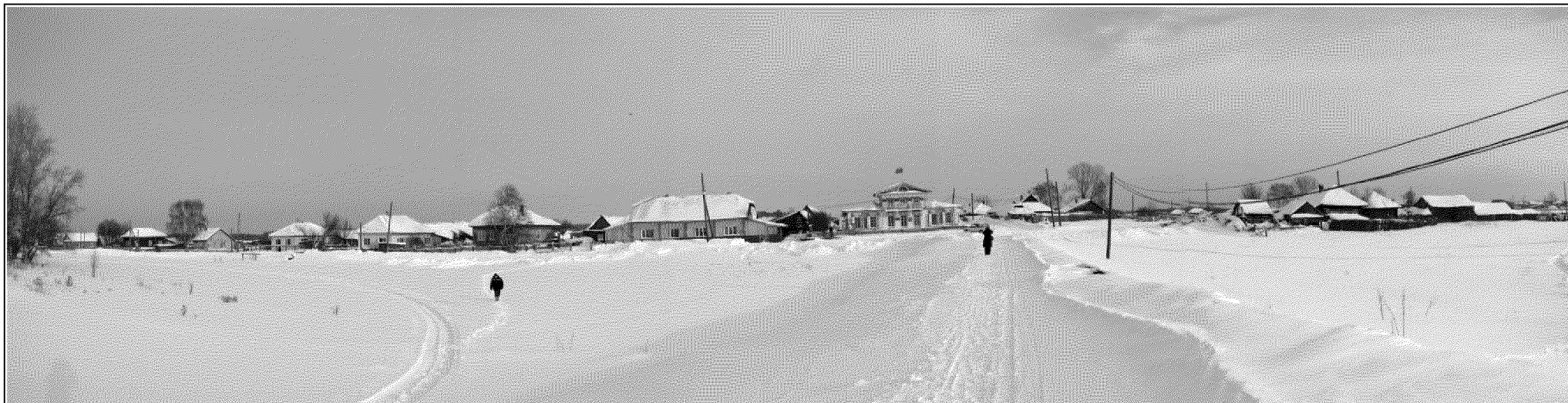
Рис. 3. Нарым, ул. Сибирская, д. 3. Панорама застройки с пер. Почтового.