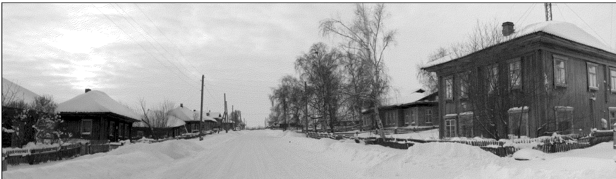
Рис. 8. Нарым, ул. Куйбышева, д. 18. Перспектива ул. Куйбышева.