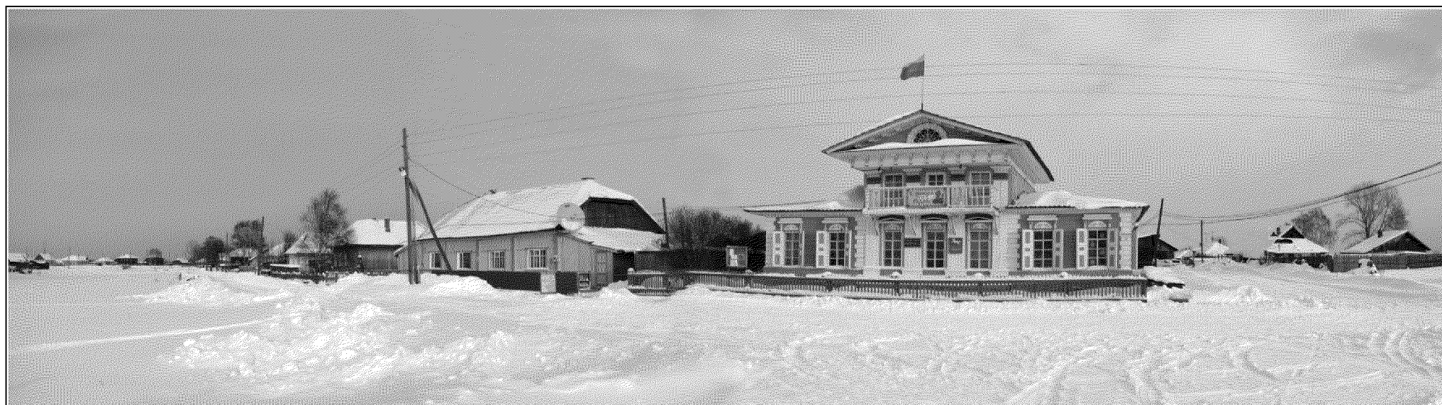
Рис. 4. Нарым, ул. Сибирская, д. 3.