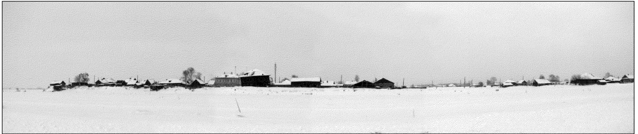
Рис. 1. Нарым. Панорама северного берега Кетской протоки.