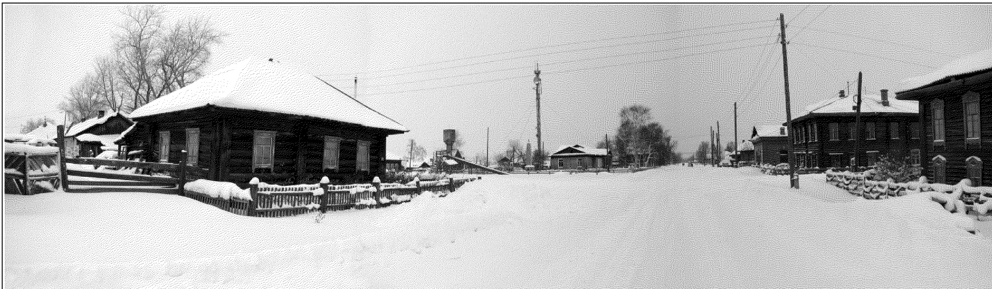
Рис. 5. Нарым, ул. Куйбышева, д. 12. Перспектива застройки ул. Куйбышева.