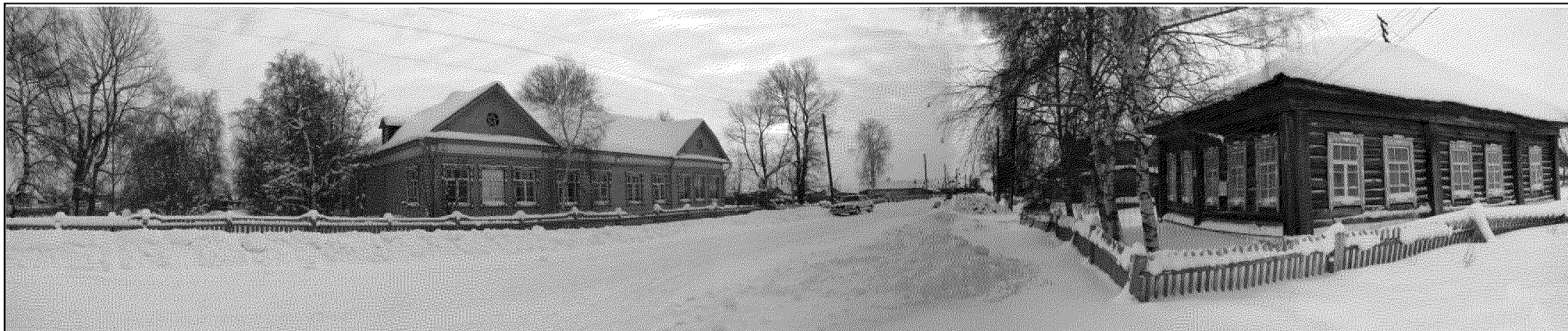
Рис. 7. Нарым, ул. Куйбышева, д. 26. Перспектива ул. Куйбышева.