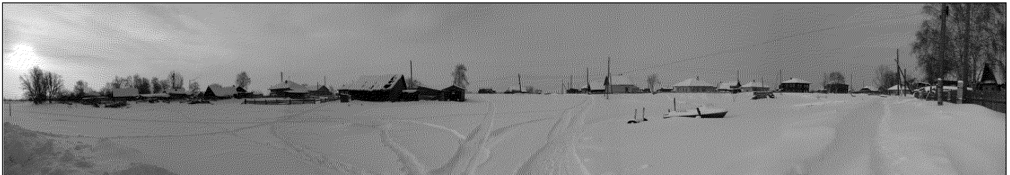
Рис. 2. Нарым. Панорама застройки западного берега озера Полой. Вид с ул. Сибирской.