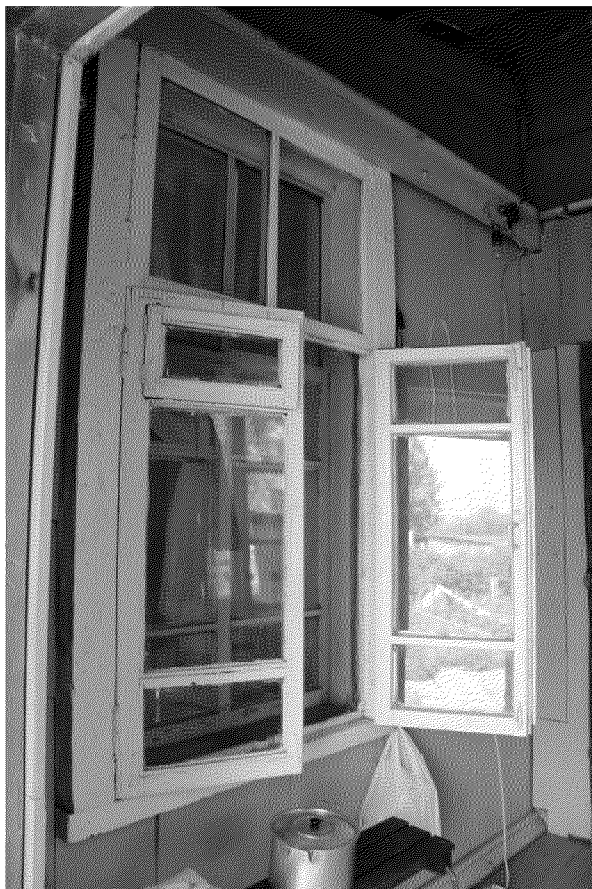
Видовая точка № 9 Окно дворового фасада.