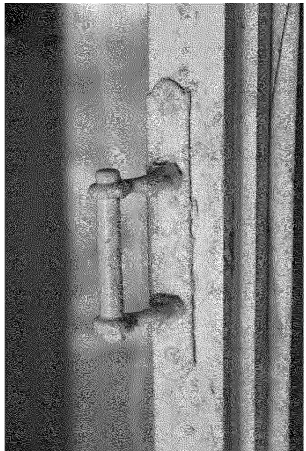
Видовая точка № 10 Скобяная оконная фурнитура (ручка).