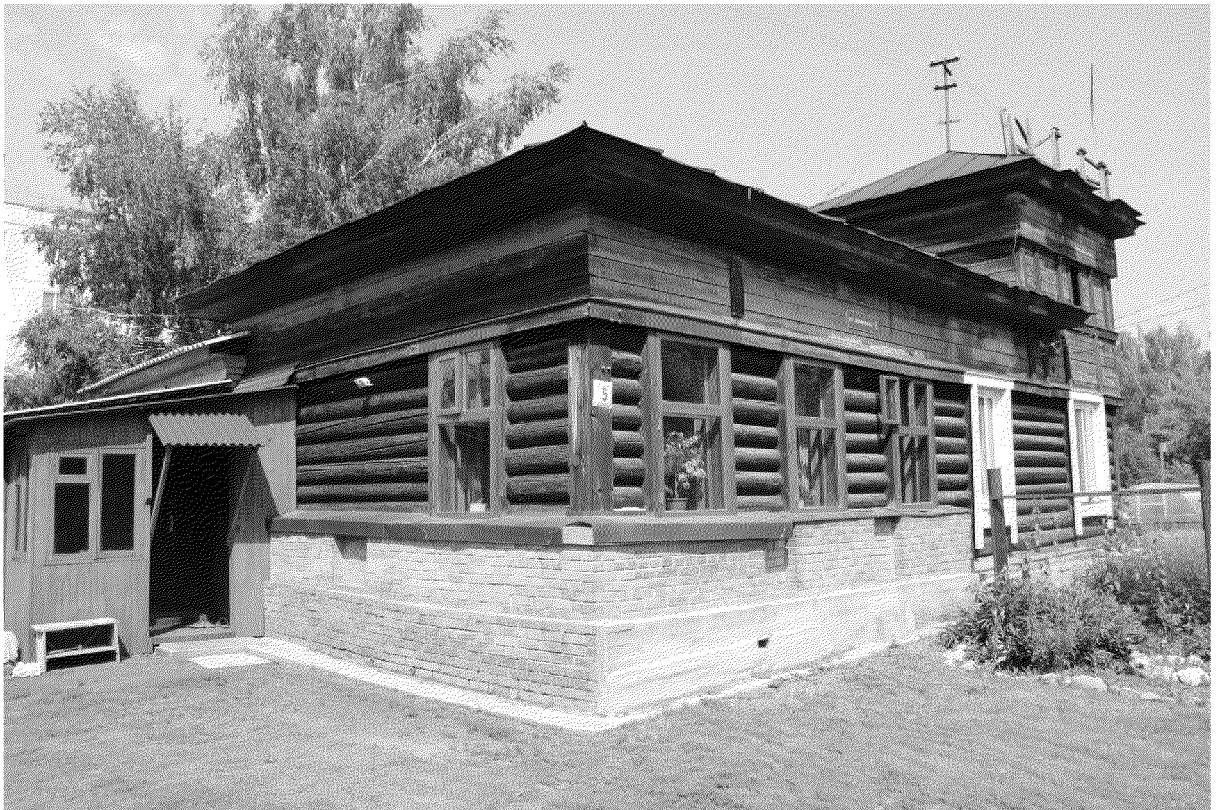
Видовая точка № 4. Общий вид здания с юго-восточной стороны.