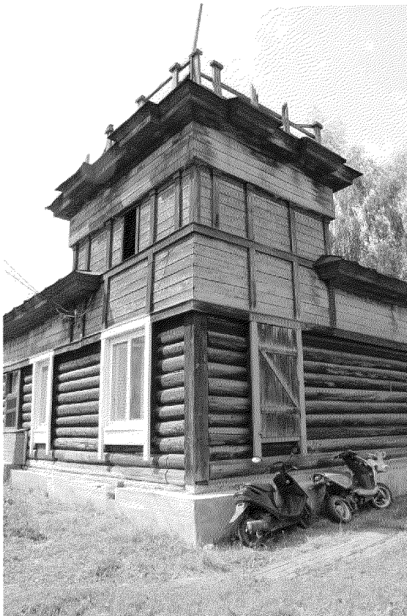
Видовая точка № 6 Северо-восточный угол здания. Угловая башня.