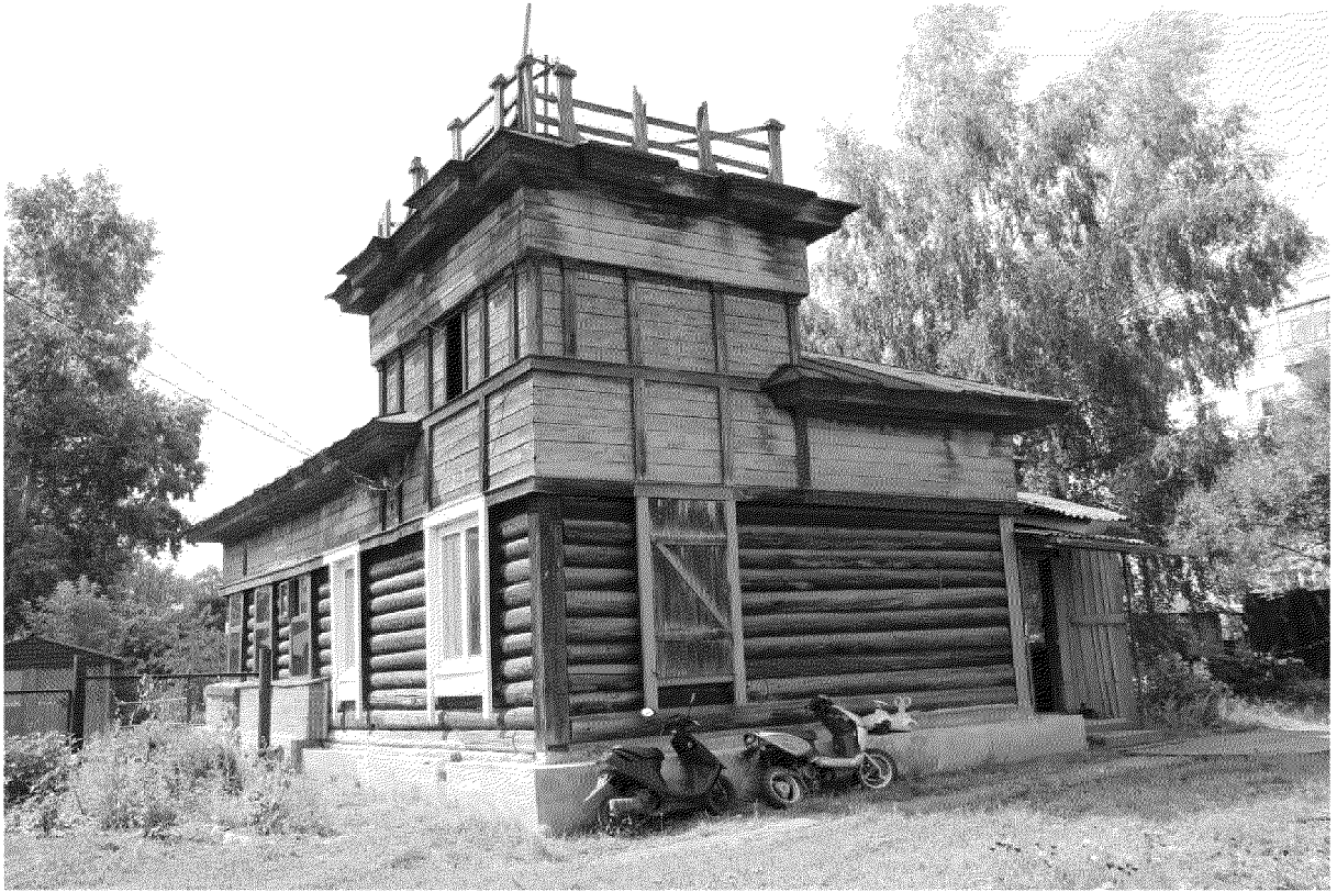
Видовая точка № 3. Общий вид здания с северо-восточной стороны.