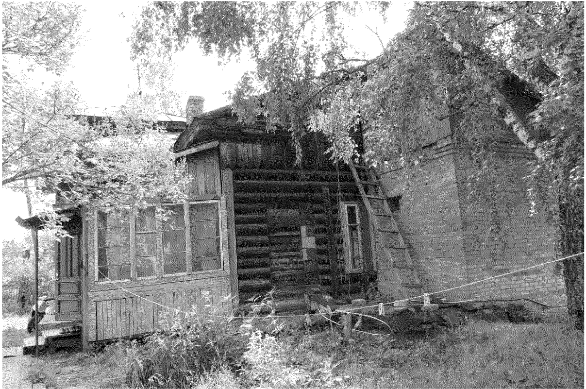
Видовая точка № 8 Западный (дворовый) фасад. Вид на центральный ризалит.