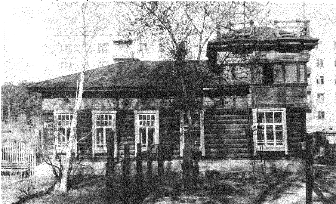
Видовая точка № 1.

дата съемки: 14.07.2015 г.