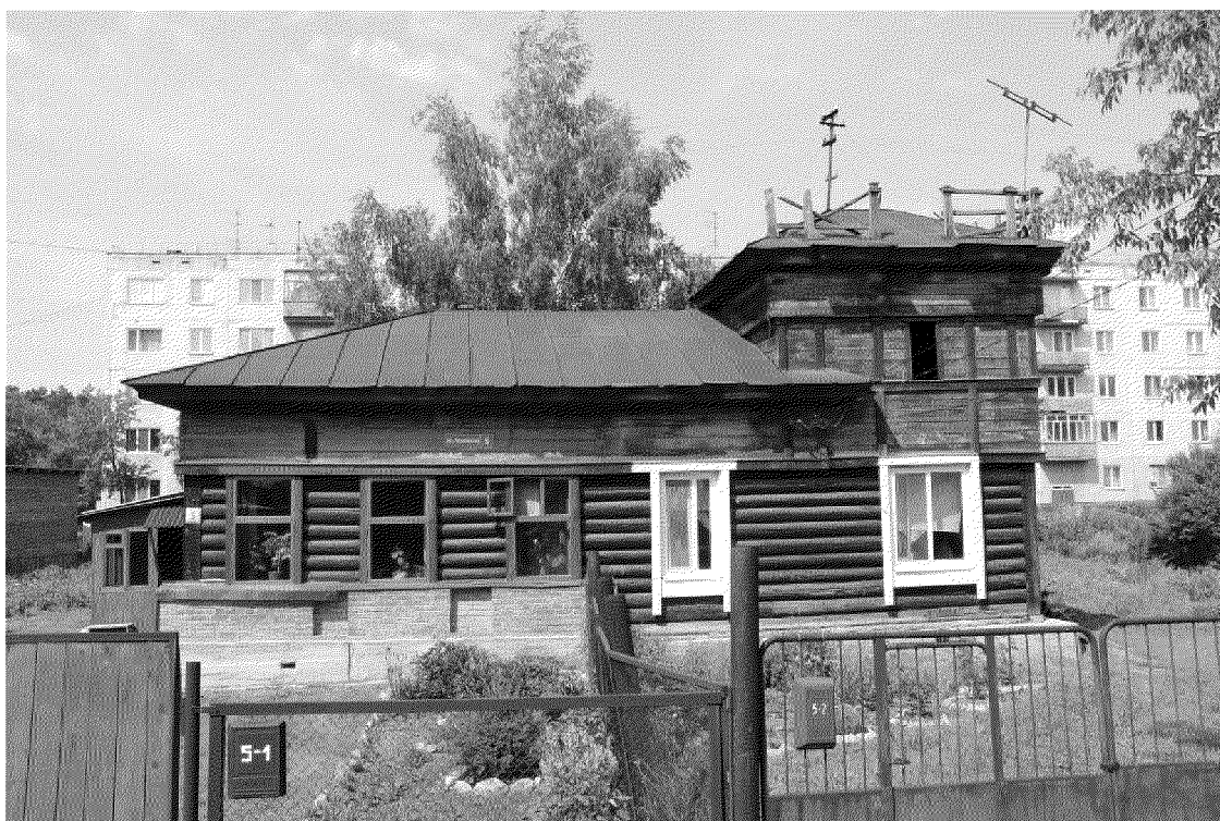
Видовая точка № 2.

Главный (восточный) фасад здания. (Фото: 2000 г.).