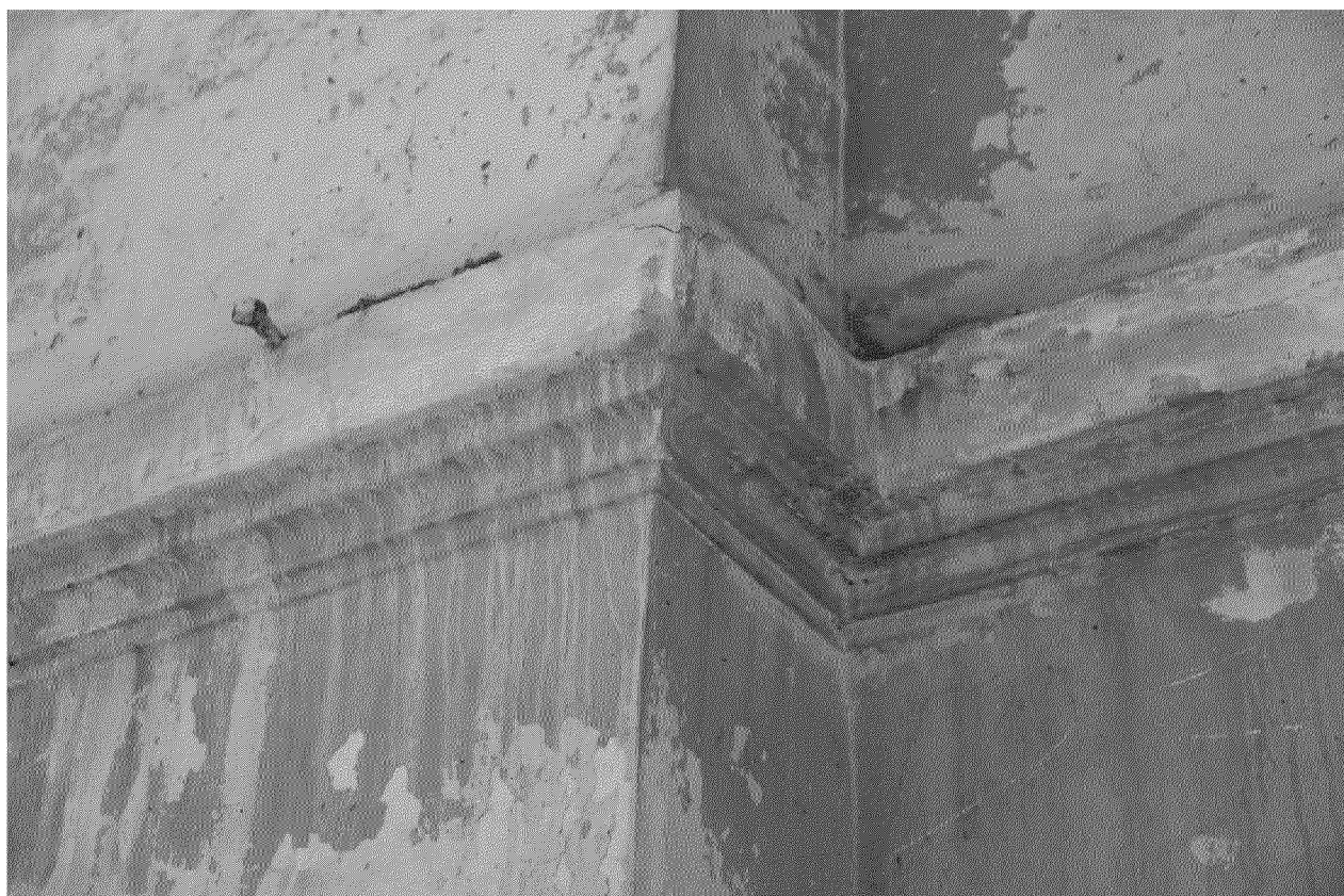
Видовая точка № 5 Фрагмент главного (восточного) фасада. Междуэтажный пояс