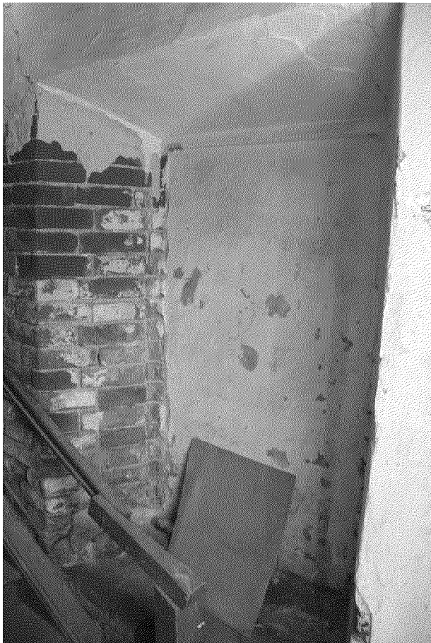
Видовая точка № 10 Оконный проем лестничного блока (вид из помещения)