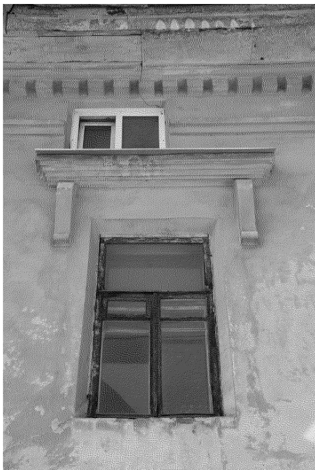
Видовая точка № 3 Окно 2-го этажа главного фасада