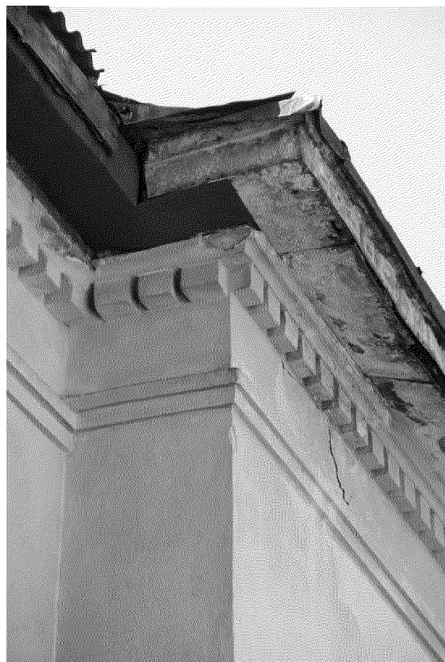
Видовая точка № 4 Фрагмент карниза ризалита северного фасада