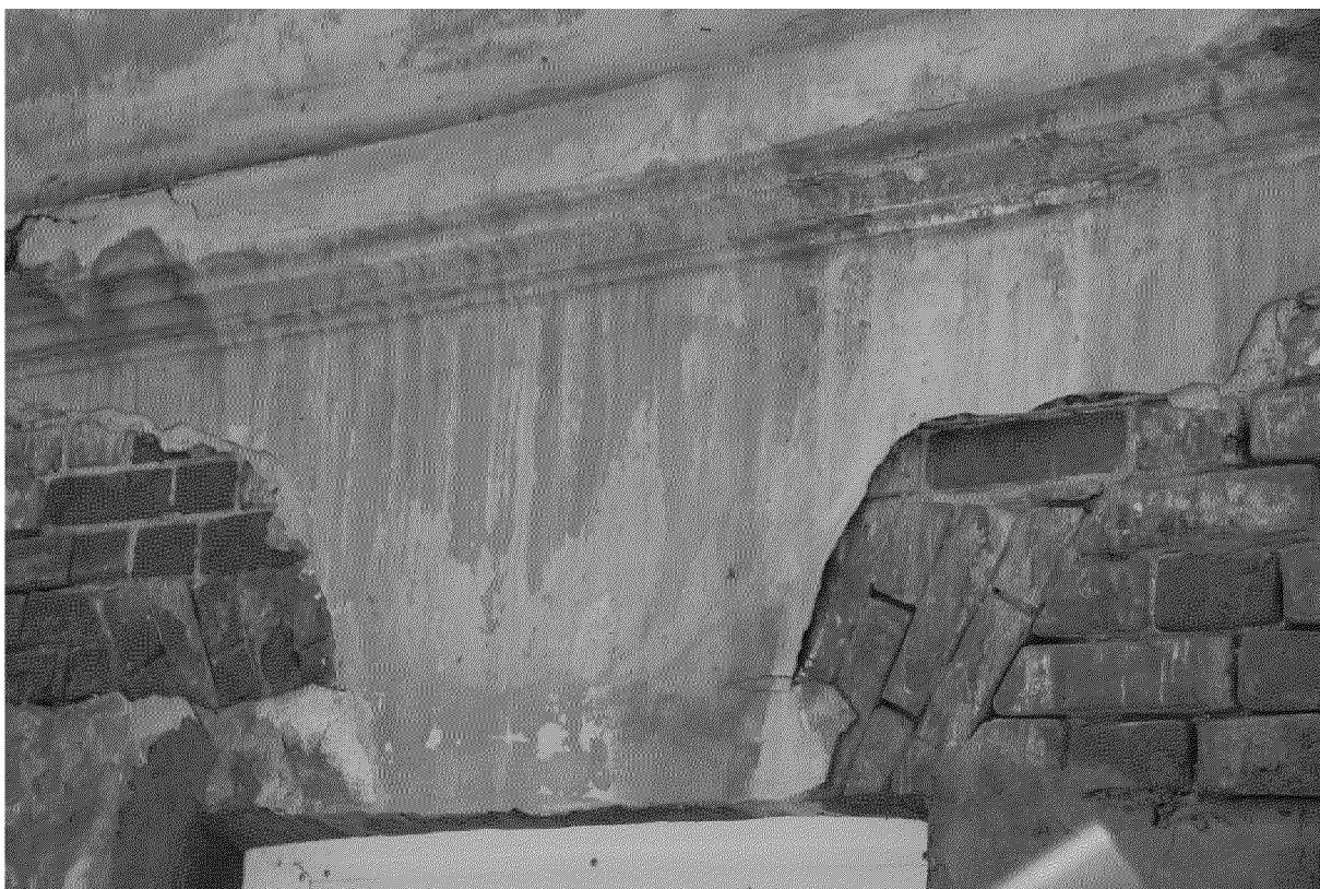
Видовая точка № 12 Фрагмент штукатурного декора главного фасада. Кирпичная перемычка оконного проема