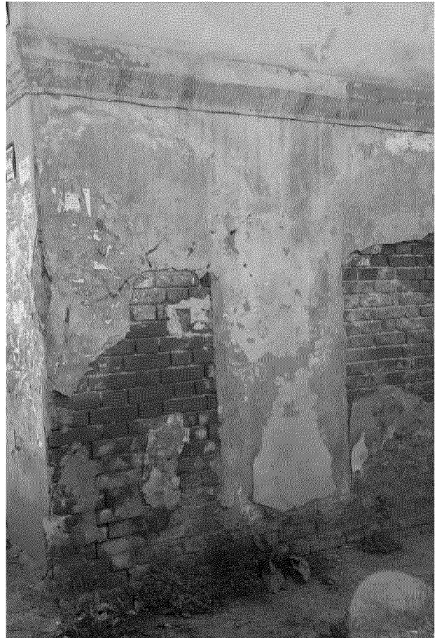
Видовая точка № 11 Оконный проем лестничного блока (на северном фасаде)