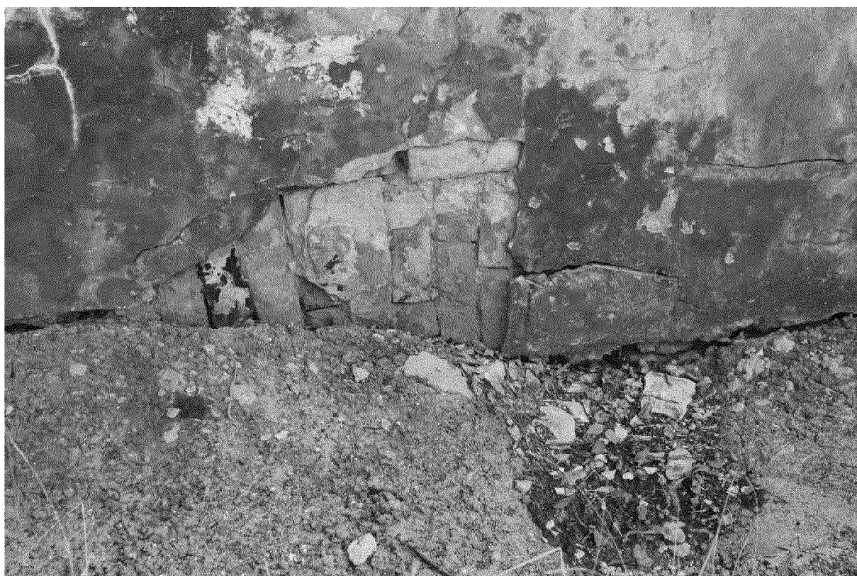
Видовая точка № 7 Западный фасад здания. Перемычка оконного проема подвала