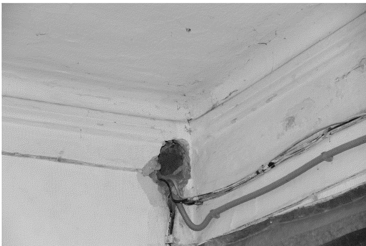
Видовая точка № 13 Фрагмент помещения 1-го этажа северной части здания. Профильные потолочно-стеновые штукатурные тяги