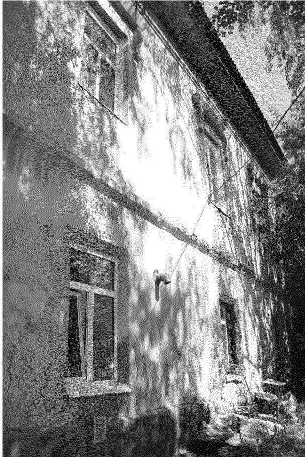
Видовая точка № 8 Южный фасад здания