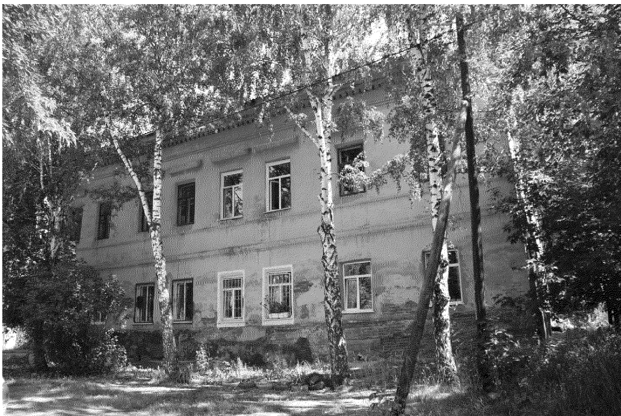
Видовая точка № 6 Западный фасад здания. Вид с территории двора