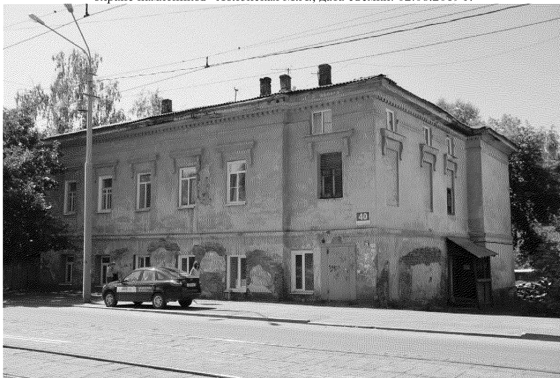
Видовая точка № 1 Общий вид здания с северо-восточной стороны (по ул. Р. Люксембург)

Фотографические изображения предмета охраны объекта культурного наследия регионального значения «Второй Сенной полицейский участок», сер. XIX в., расположенного по адресу: Томская обл., г. Томск, Розы Люксембург улица, 40 дата съемки: 02.08.2019 г.