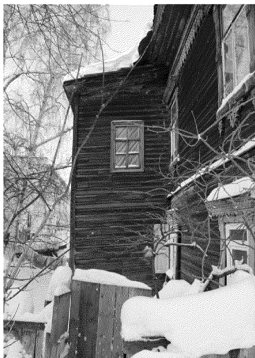
Видовая точка № 2 Восточный фасад дворовой пристройки.