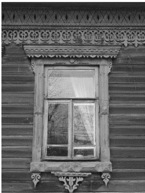
Видовая точка № 7. Окно 2-го этажа. Наличник.