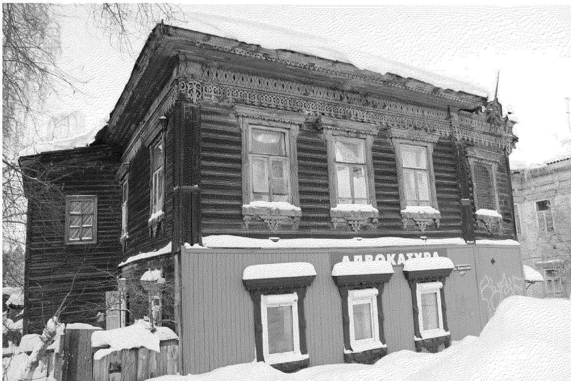
Видовая точка № 6. Главный восточный фасад здания (вид с ул. Советской).