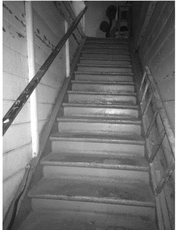
Видовая точка № 11. Лестница пристройки северного фасада