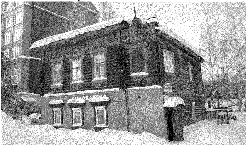
Видовая точка № 1. Главный восточный фасад здания (вид с ул. Советской).

дата съемки: 03.12.2018 г.