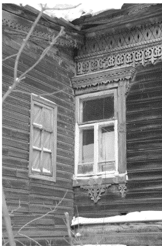
Видовая точка № 8. Деревянные рамы окон 2-го этажа,