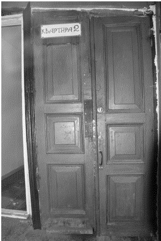
Видовая точка № 10. Дверь парадного входа (на лестницу).