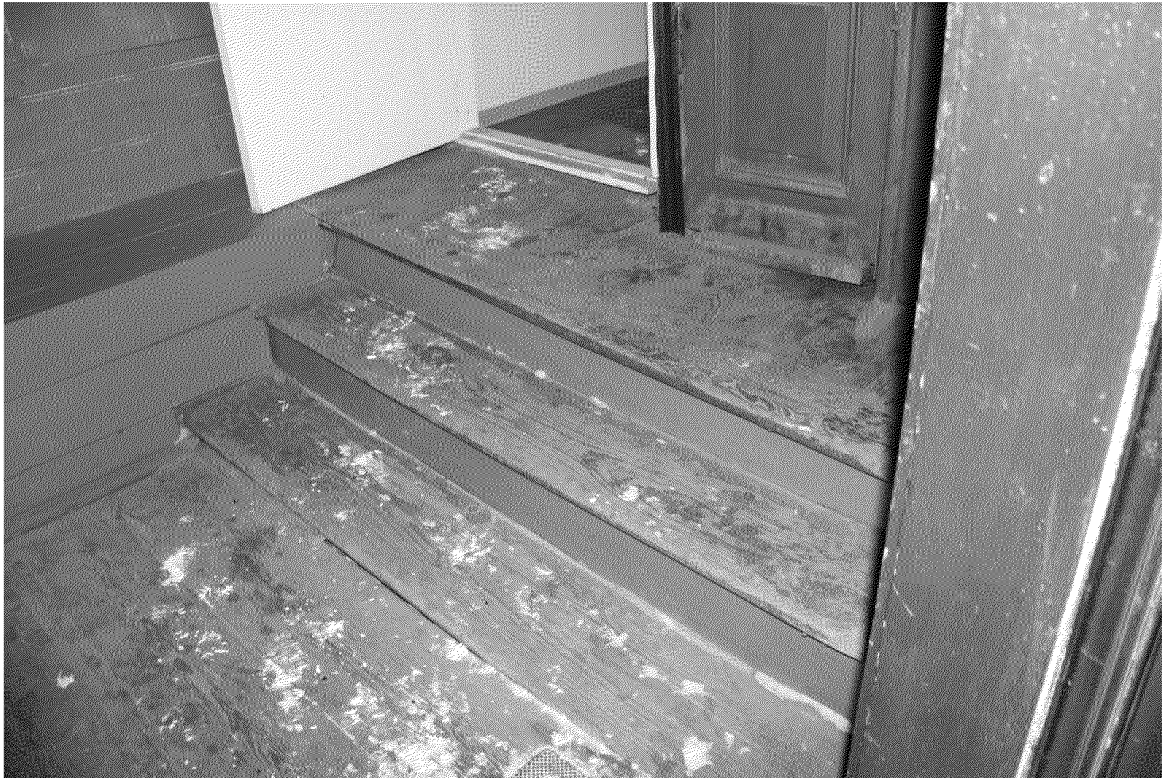
Видовая точка № 9. Крыльцо парадного входа (в пристройке).