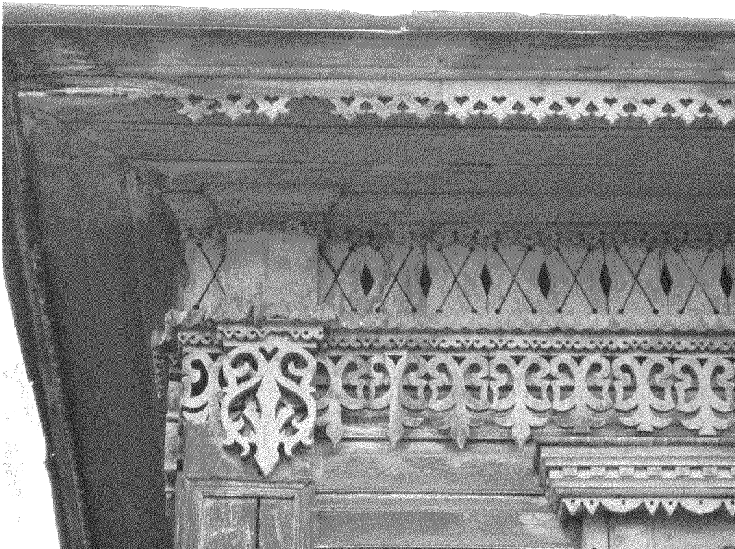
Видовая точка № 5.

Фрагмент главного фасада. Атик (фото Яблонской М.А., 2011 г.)