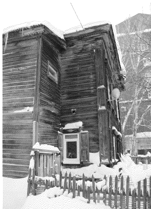
Видовая точка № 3 Северо-западный угол здания (вид со двора).