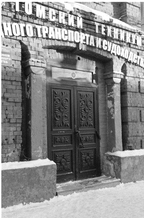
Видовая точка № 5 Декор парадного входа (17.11.2014).