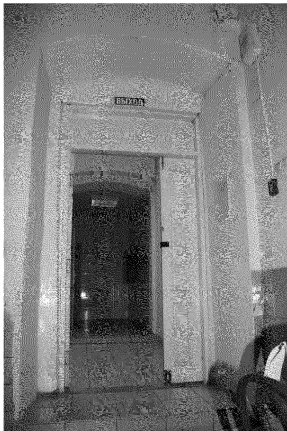
Видовая точка № 11 Лучковые дверные проемы (28.01.2019).