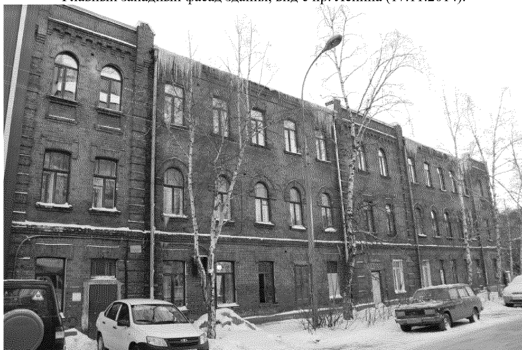
Видовая точка № 2.

Главный западный фасад здания, вид с пр. Ленина (17.11.2014).