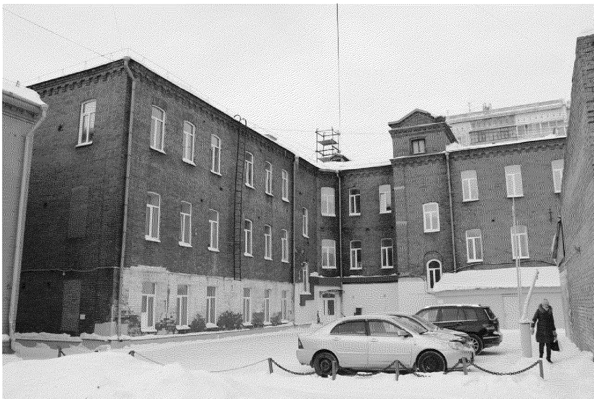
Видовая точка № 7. Общий вид дворовых фасадов (восточного и южного), 28.01.2019