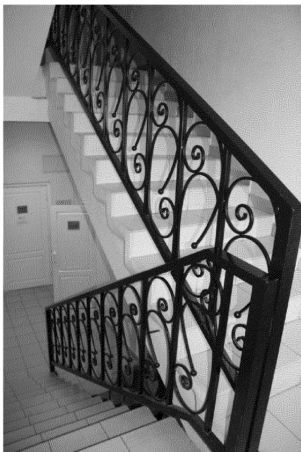
Видовая точка № 12 Двухмаршевая лестница (28.01.2019).