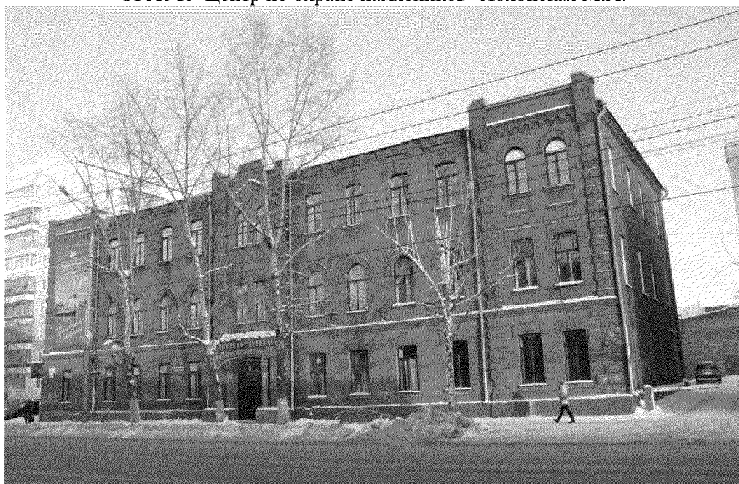
Видовая точка № 1.