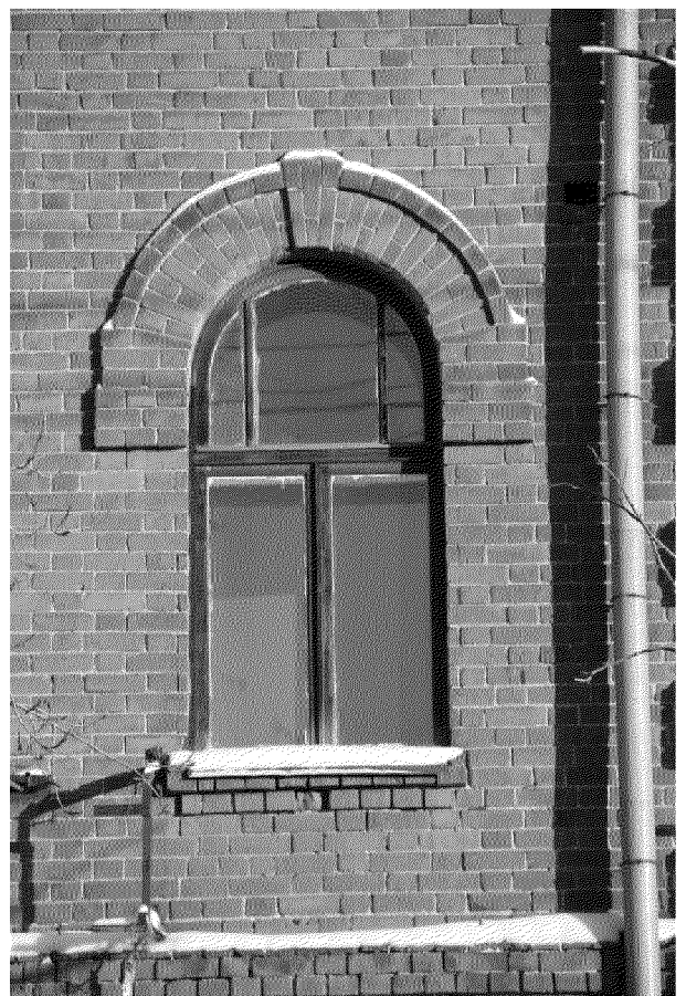
Видовая точка № 6 Окно 2-го этажа главного фасада (17.11.2014)