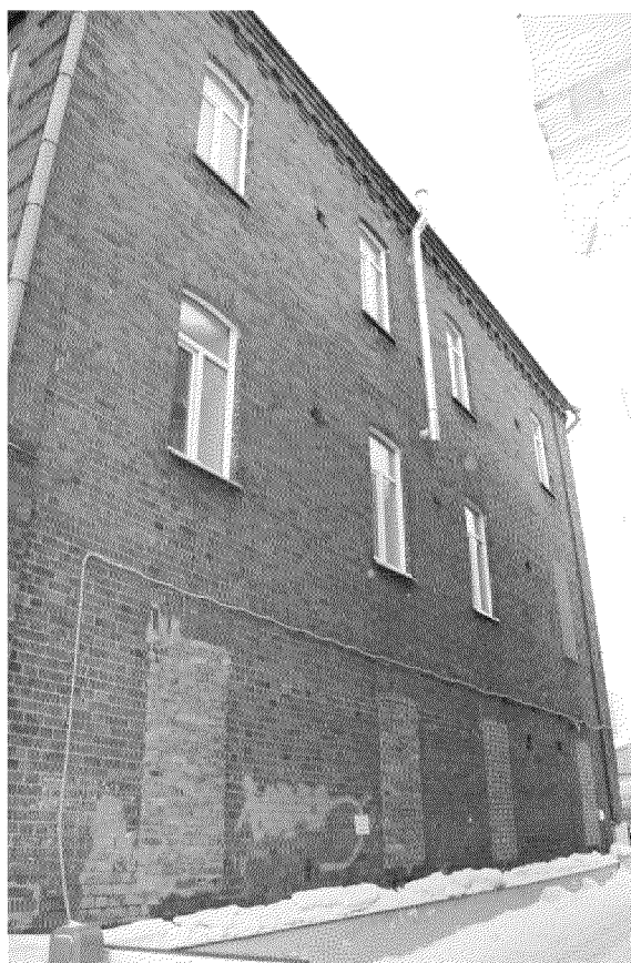
Видовая точка № 9 Торцевой (южный) фасад (28.01.2019).