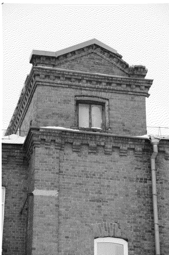
Видовая точка № 8 Фрагмент южного фасада (28.01.2019).