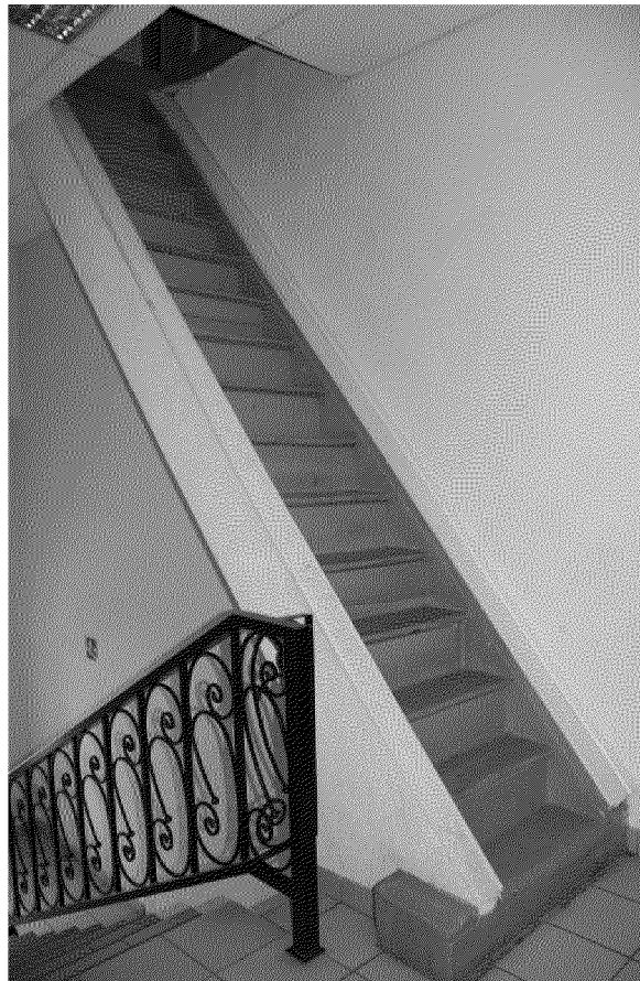
Видовая точка № 13 Деревянная лестница на чердак (28.01.2019)