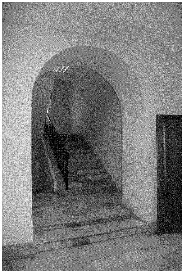
Видовая точка № 10 Арочный проем парадного входа на лестницу (28.01.2019).