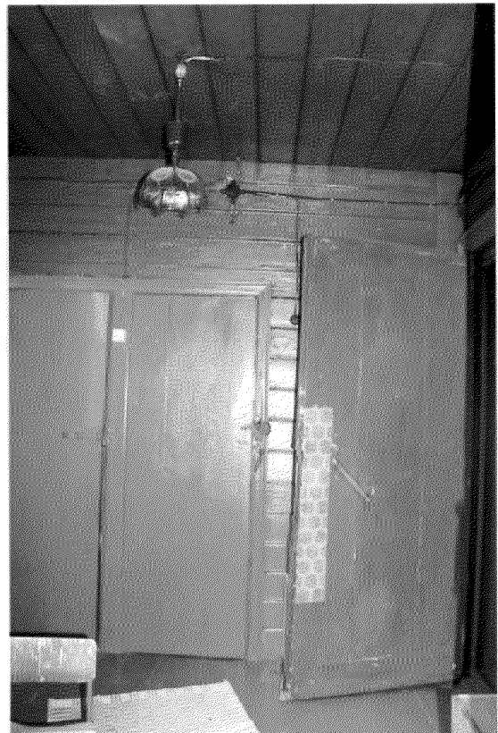
Видовая точка № 13. Пристройка дворового фасада. Вид изнутри помещения.