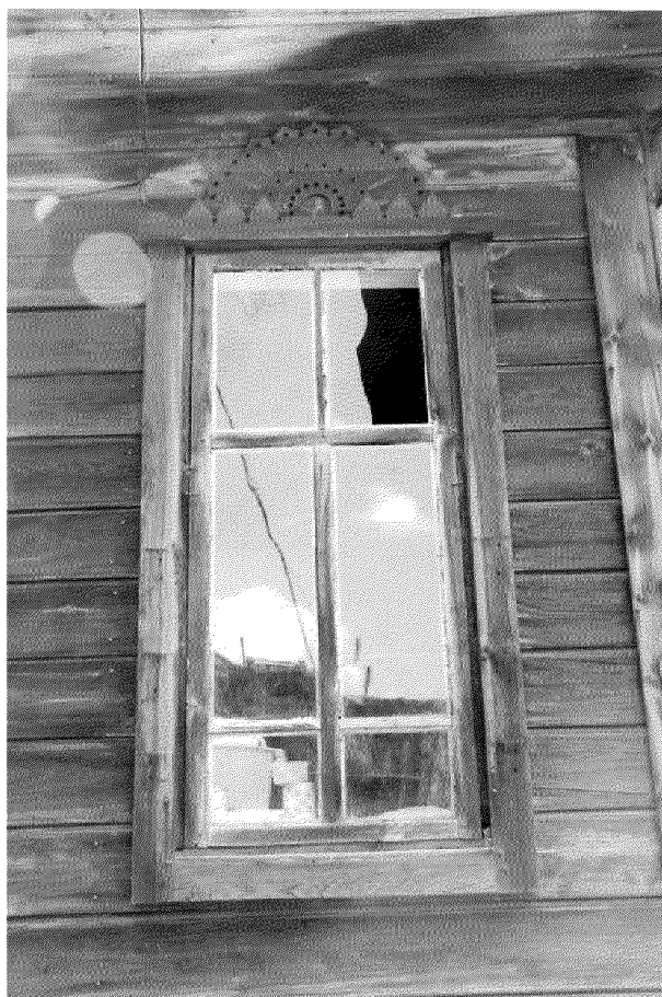
Видовая точка № 10. Окно пристройки дворового фасада.