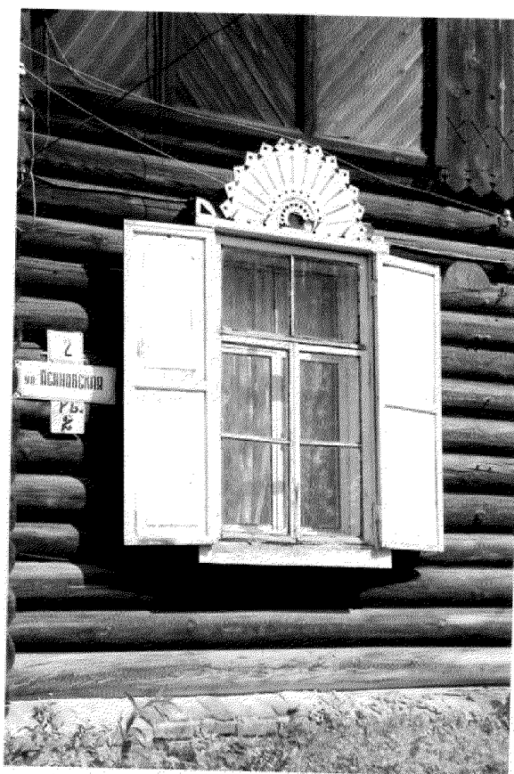
Видовая точка № 5. Окно главного фасада со ставнями.