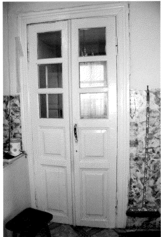
Видовая точка № 15. Фрагмент интерьера квартиры. Внутренняя дверь.