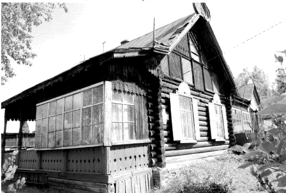
Видовая точка № 2. Общий вид здания с северо-западной стороны.