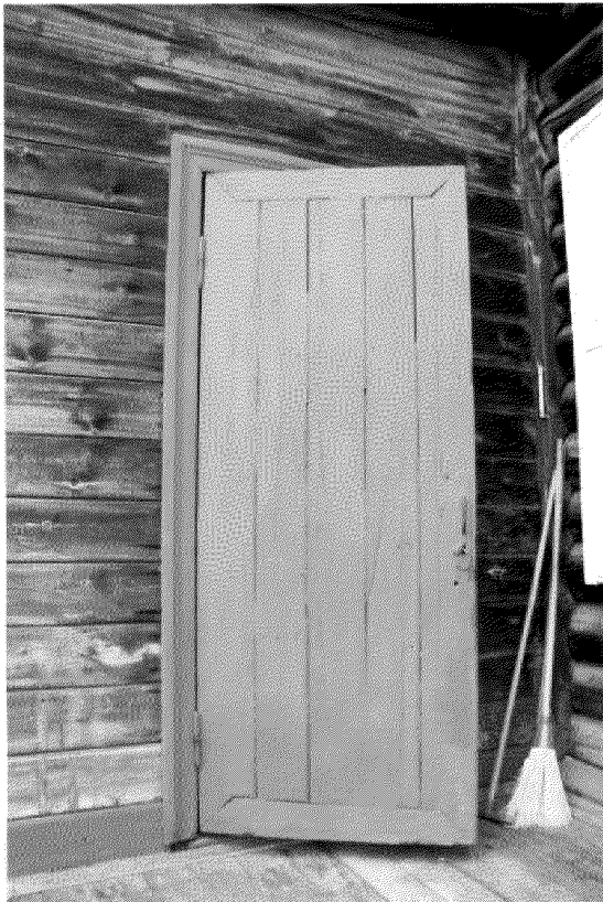
Видовая точка № 12. Наружная дверь.