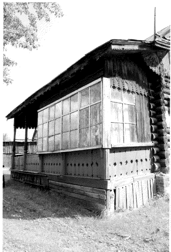
Видовая точка № 8. Терраса с навесом на столбах. Вид с северо-западной стороны.