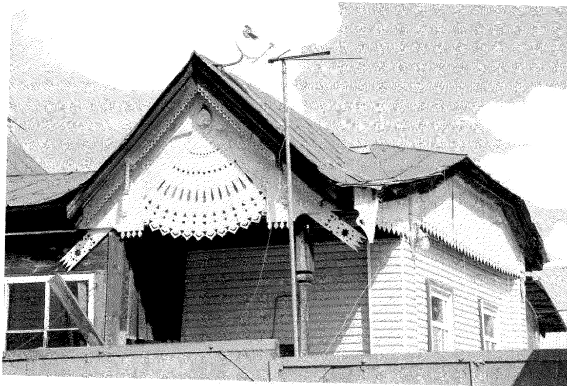
Видовая точка № 3. Фрагмент главного фасада. Вид здания с юго-западной стороны.