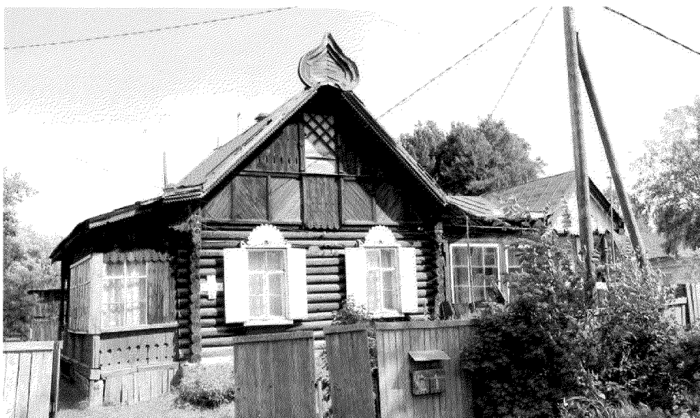
Видовая точка № 1. Общий вид здания с ул. Асиновской.

Фотографические изображения предмета охраны объекта культурного наследия регионального значения «Дом жилой для служащих», 1915 г., входящего в состав объекта культурного наследия регионального значения «Томская Окружная Психиатрическая лечебница», 1901-1915 гг., расположенного по адресу: Томская область, г. Томск, Асиновская улица, 2 дата съемки: 15.07.2015 г.).