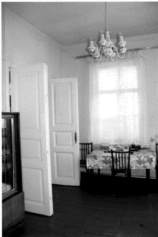
Видовая точка № 14. Фрагмент интерьера квартиры. Внутренняя дверь.