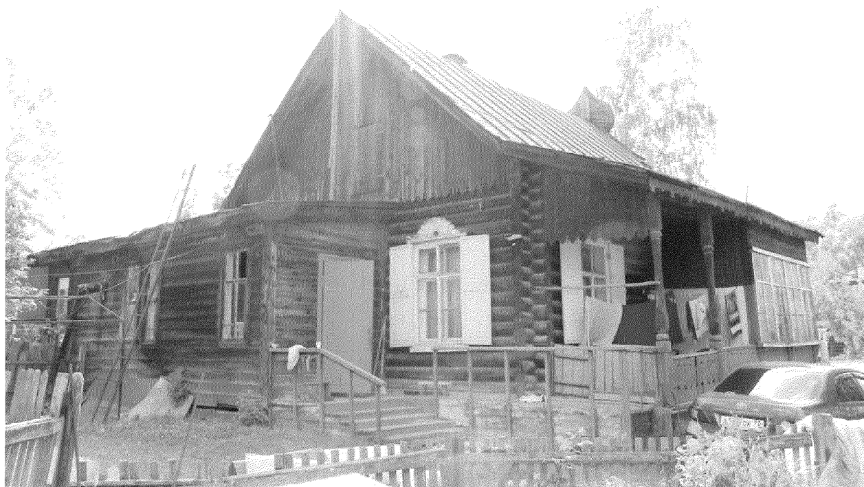
Видовая точка № 9. Общий вид здания со стороны двора.