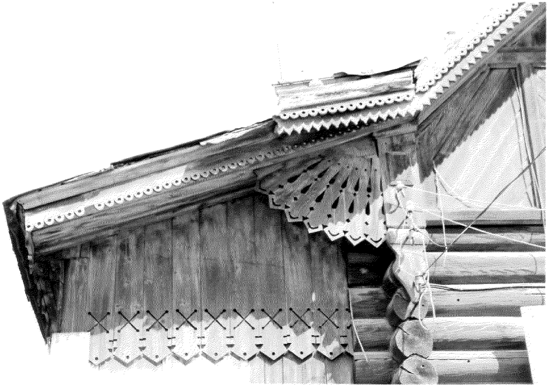
Видовая точка № 6. Фрагмент главного фасада. Декор карниза навеса террасы.