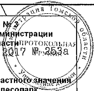
Схема ландшафтного парка областного значения "Припоселковый лесопарк у села Окунево" М 1: 15 000

Приложение № 3 к постановлению Администрации Томской области от 04.07.2017 № 253а