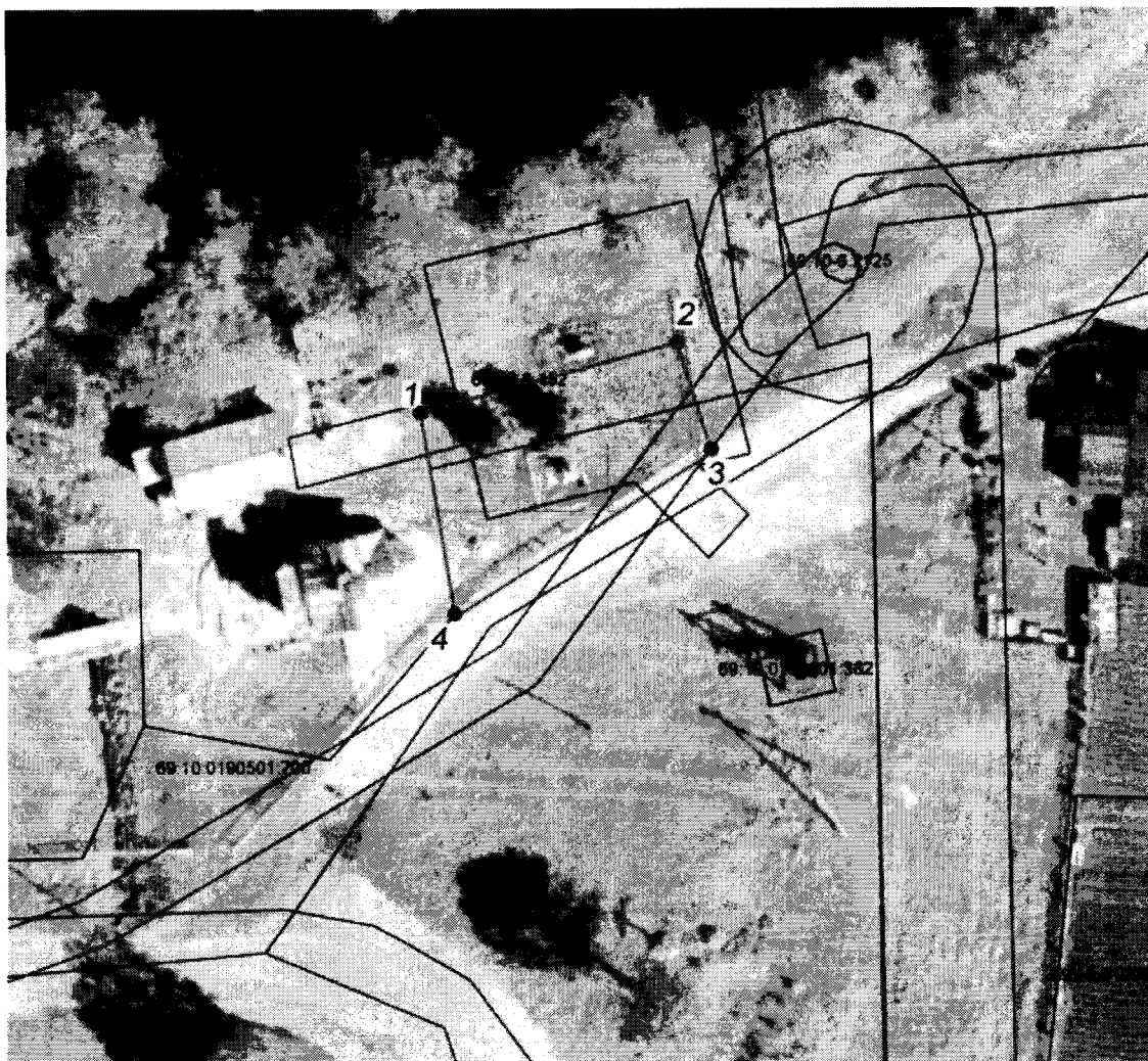
Схема границ защитной зоны объекта культурного наследия регионального значения «Братская могила», расположенного по адресу: Тверская область, Калининский район, д. Савватьево