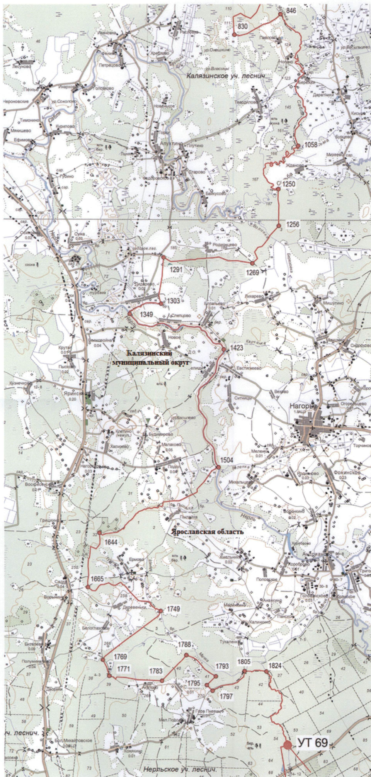
Схема прохождения границы между муниципальным образованием Тверской области Калязинский муниципальный округ и Ярославской областью