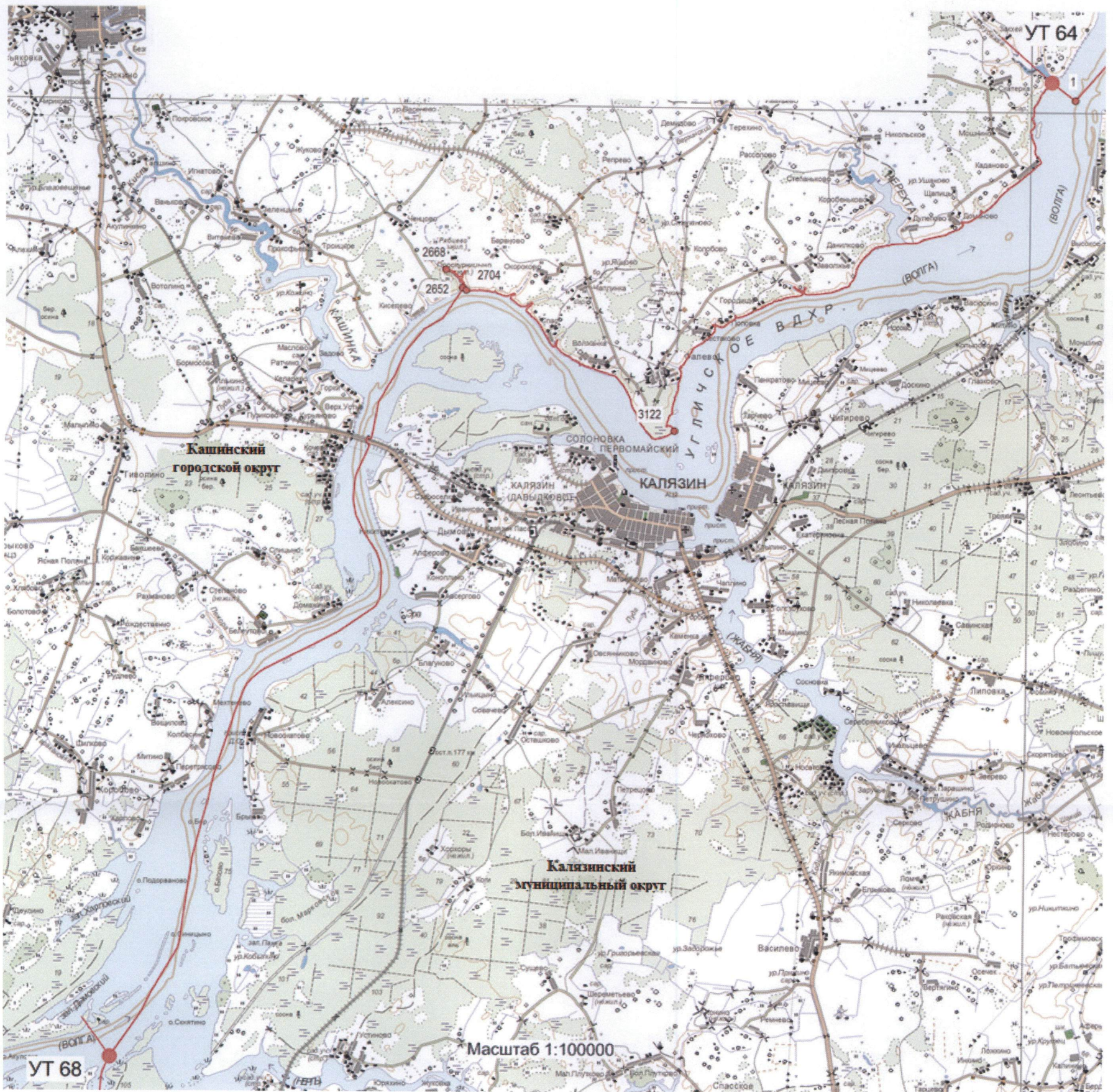
Схема прохождения границы между муниципальными образованиями Тверской области Калязинский муниципальный округ и Кашинский городской округ