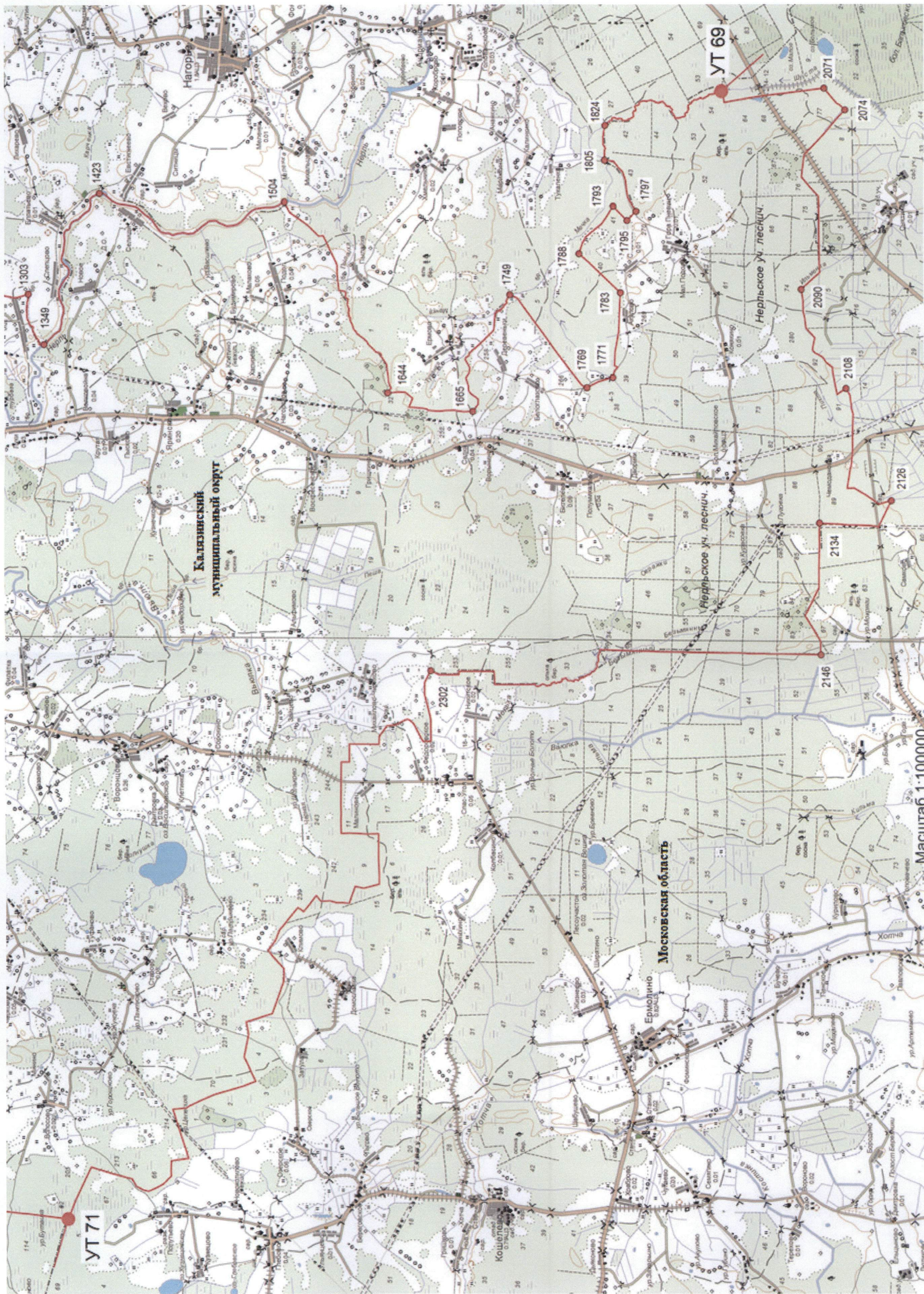
Схема прохождения границы между муниципальным образованием Тверской области Калязинский муниципальный округ и Московской областью