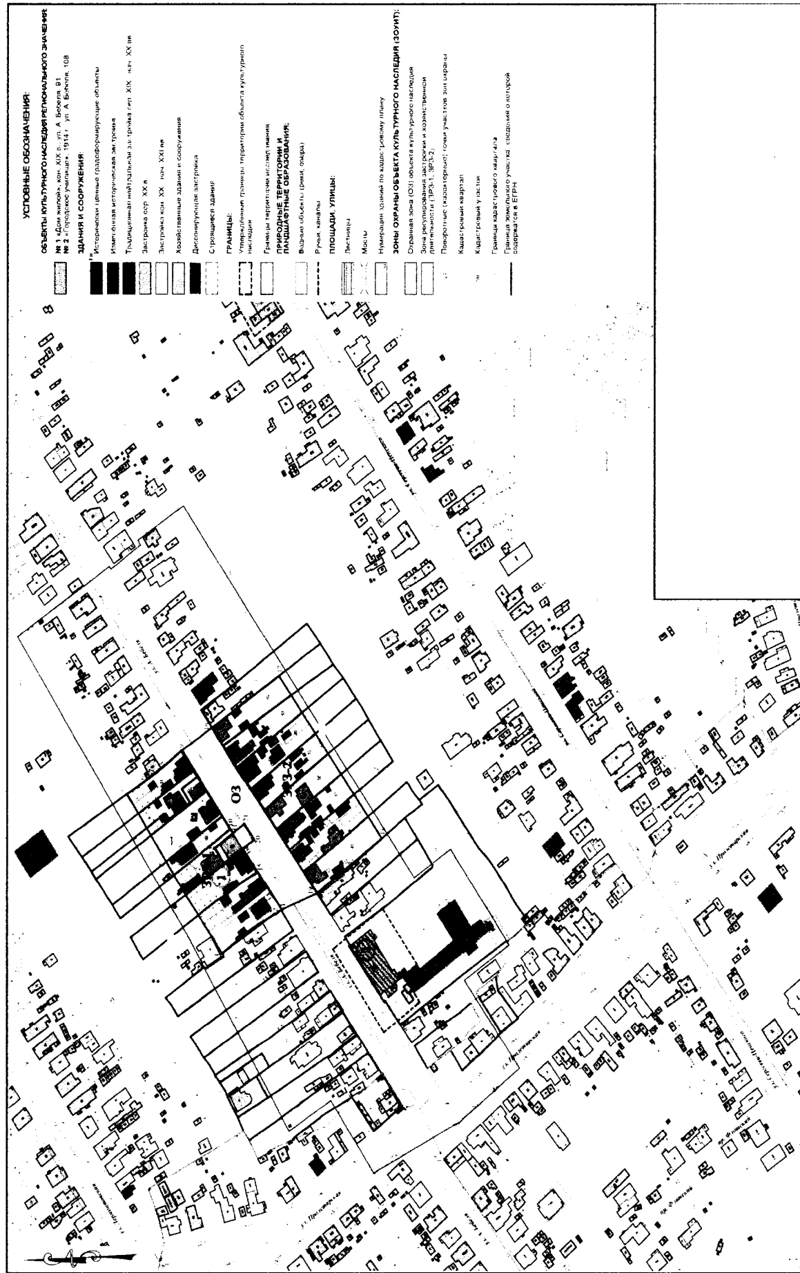
4. Схема границ зон охраны объекта культурного наследия