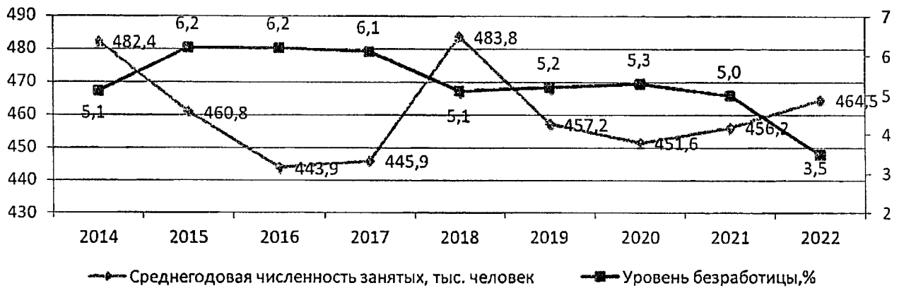
Рис. 1. Среднегодовая численность занятых и уровень безработицы в Смоленской области в 2014 - 2022 годах, % (правая ось), тыс. человек (левая ось)

Наибольшее снижение численности занятых происходило в 2015 - 2016 годах (на 38,5 тыс. человек), а также в 2019 - 2020 годах (на 32,2 тыс. человек). В 2018 году произошел прирост числа занятых на 37,9 тыс. человек.