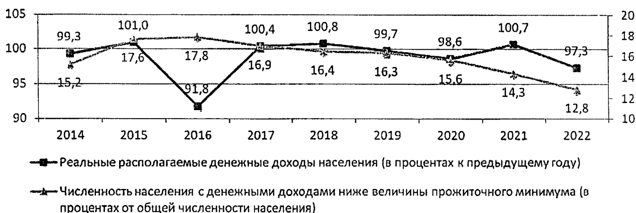
Рис. 3. Численность населения Смоленской области с денежными доходами ниже величины прожиточного минимума и реальные располагаемые денежные доходы населения Смоленской области в 2014 - 2022 годах, в % от общей численности населения (правая ось), в % к предыдущему году (левая ось)

Уровень бедности в Смоленской области в течение всего рассматриваемого периода (2014 - 2022 годы) был самым высоким среди регионов ЦФО, несмотря на то, что в 2022 году уровень среднедушевых денежных доходов 8 регионов ЦФО был ниже, чем в Смоленской области. Такое явление объясняется неравномерностью распределения доходов среди населения Смоленской области. Так, по показателям дифференциации доходов (коэффициент фондов и коэффициент Джини) (последние данные представлены Федеральной службой государственной статистики (далее – Росстат) за 2021 год) все регионы, находившиеся в 2021 году ниже Смоленской области по размеру среднедушевых денежных доходов, имели более низкие значения указанных коэффициентов (доходы в этих регионах распределялись более равномерно). Показатели дифференциации доходов регионов ЦФО, находящихся на 11-18-х местах по уровню среднедушевых денежных доходов в 2021 году, представлены в таблице 2.